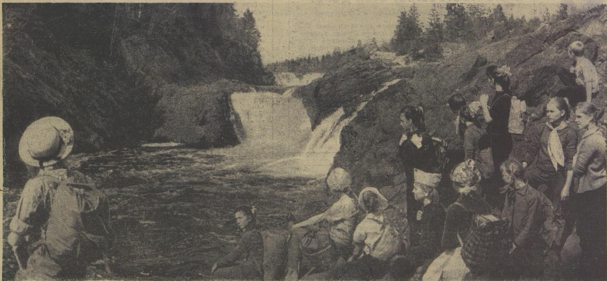
Тысячи туристов приходят к красивейшему водопаду Кивач. Вот и сейчас полюбоваться на него пришли учащиеся 21-й школы города Петрозаводска.