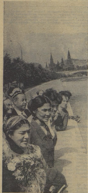
Делегаты съезда учителей знакомятся с Москвой.