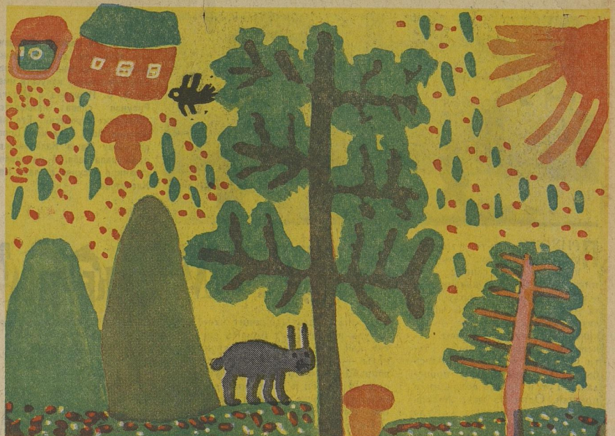
«Поляна, дуб и два стога сена». Рисунок Иры Клокотовой. 8 лет.

Индекс 50101 Редактор Н. М. ЧЕРНОВА АДРЕС РЕДАКЦИИ: Москва, А-30, Сушёвская, 21. Типография изд-ва ЦК ВЛКСМ «Молодая гвардия» А-04218. Зак. 1489. 3