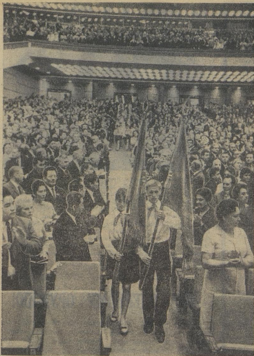
ДЕЛЕГАТОВ ВСЕСОЮЗНОГО СЪЕЗДА УЧИТЕЛЕЙ ПРИВЕТСТВОВАЛИ ПИОНЕРЫ:

Учитель, школьный учитель! Как наш путь ни далёк, В руках у вас будут нити Наших дальних дорог.