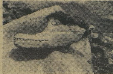
ПРИЧУДЫ ПРИРОДЫ. Крым.

РАБОТЫ ПРИСЫЛАЙТЕ ПО АДРЕСУ: Москва, И-51, Петровка, 28, Центральный Совет Всероссийского общества охраны памятников истории и культуры. На конверте пишите: «ОТЕЧЕСТВО».