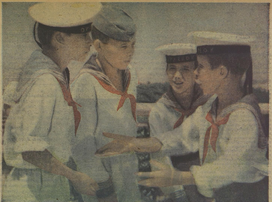
О море мечтают мальчишки. О дальних странах, белых кораблях, которые поведут они по голубым океанским дорогам. «Гремящие сорочковые шпроты», слезящий зной тропиков, белое безмолвие Арктики ждут мальчишек. Через несколько лет всё это обязательно случится. А пока... Пока будущие капитаны готовятся к походам в пионерском лагере «Юрленок».