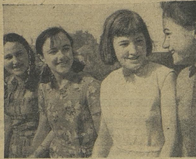
Плывают в море рыболовецкие сейнеры. Пасутся на выгонах стада. Спешат на ферму доярки. Везде нужны руни молодых.