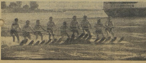
Кама. Водная ширь, простор! Такую картину можно увидеть в городе Сарануле каждый погожий день. Даже малыши из детского сада умеют тут крепко стоять и мчаться на водных лыжах. Почему? Секрет прост: водные лыжи — любимый вид спорта саранульцев.