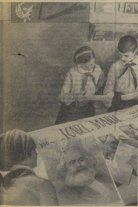
Скоро исполнится 150 лет со дня рождения Карла Маркса. И ребята из одиннадцатой школы Антисиньки уже готовятся к юбилею великого революционера. Им помогает знание немецкого языка. На этом снимке вы видите, как пятиклассники тоуют стену, в котором все материалы будут написаны по-немецки.