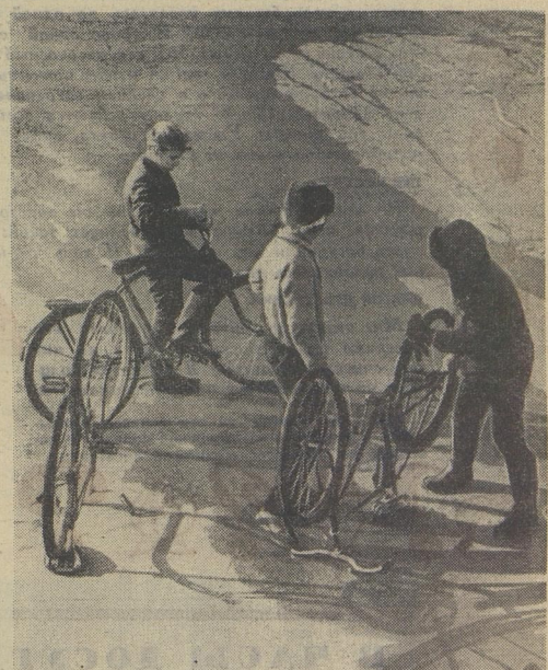
«МАЛЬЧИШКИ». г. Петродворец Ленинградской области.

Издательство «Советская Россия» выпустило в свет для ребят сборник рассказов Андрея Платонова, назвав его просто «Рассказы». Эти произведения писателя для детей интересны и поучительны. Замечательного русского советского писателя Андрея Платонова давно уже нет с нами, но его книги живут, потому что в них бьётся огромное умное сердце, полное безграничной любви к людям и всем существам, населяющим землю. Для него нет в мире ничего слишком малого и потому не стоящего внимания. Он полон восхищённого уважения и к мальчику Никите (рассказ «Никита»), старшему сыну, проникнуть в грозные тайны жизни, и к Акиме («Свет жизни»), по-