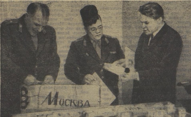
Да, невбная сейчас работа у юнры: всё проверь, всё просмотри. Кому не «Светофор» открыт зелёную улицу!