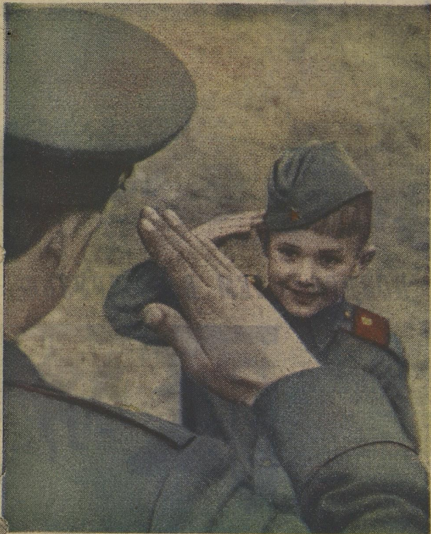
— Разрешите встать в строй?