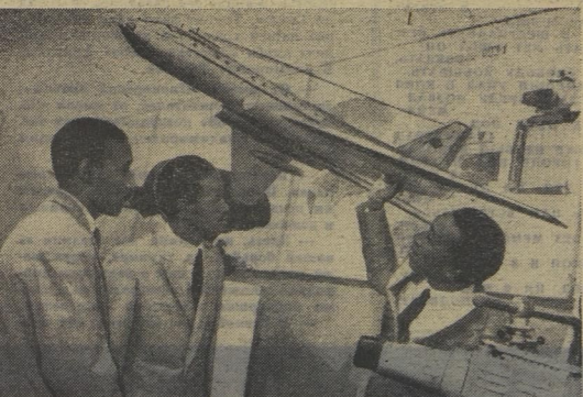
Эти лётчики из африканской Республики Мали будут летать на советском самолёте «АН-24».