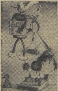
НА СНИМКАХ: Валя ПОПОВА (вверху). ВНИЗУ — некоторые из её работ.