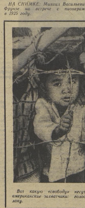
Вот такую «свободу» несут южноветнамским детям американские захватчики: воюют, бомбят, колют проволокой.

НА СНИМКЕ: Михаил Васильевич Фрунзе на встрече с пионерами в 1926 году.