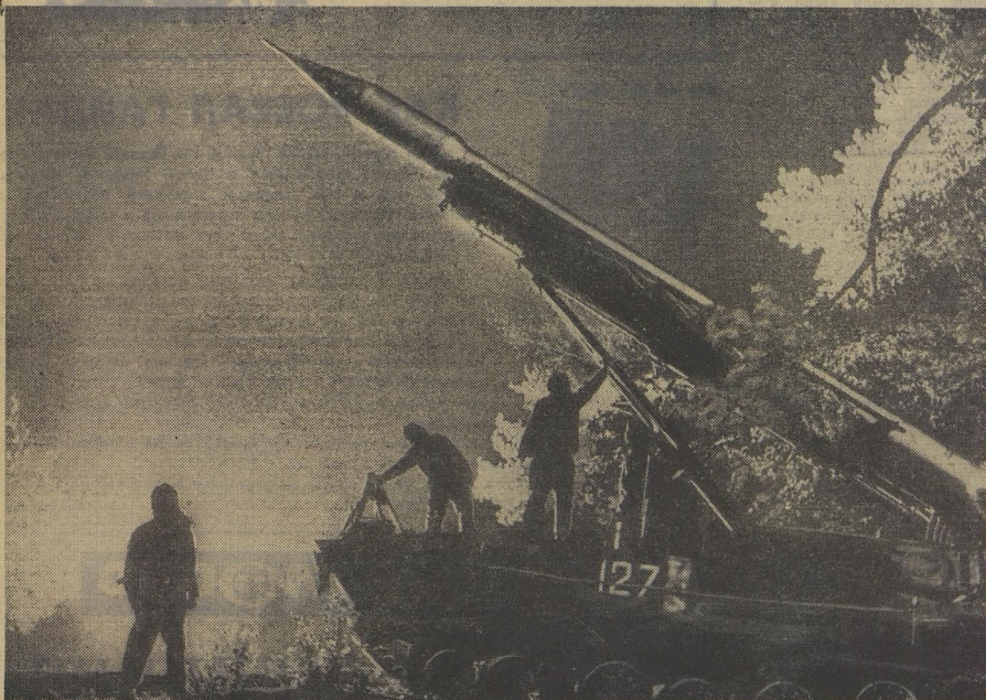
На снимке: «Ракеты и бою!»