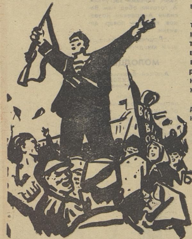
Советская власть: мир народам.