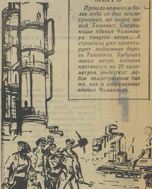
Мы наш, мы новый мир построим...