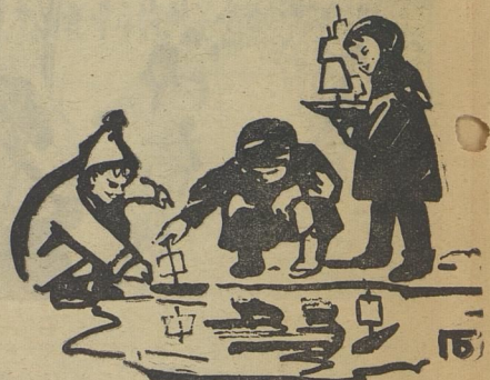
Во имя счастья жизни!