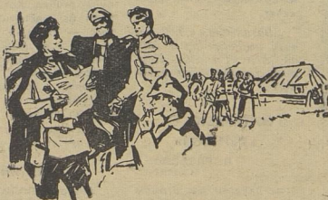
Гражданская война рождала новых героев.