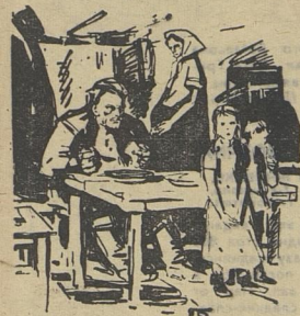
а внизу — нищета.