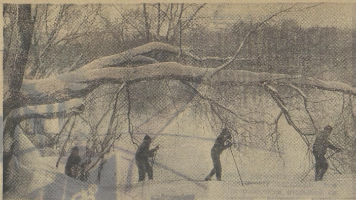
«На зимней прогулке».

Ромн АССР, Сясьский район, село Визинга. Т. МАЧНЕВА.