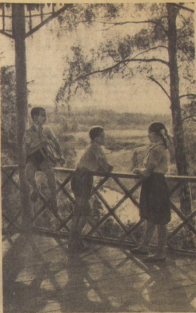
В ПИОНЕРСКОМ ЛАГЕРЕ «ЛЕСНАЯ ЗАСТАВА». Московская область, Рузский район.

Московская область, Красная Пахра детский санаторий № 57.