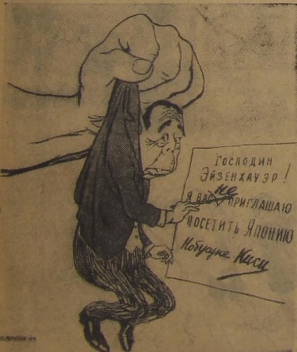
Поправка в последний час.