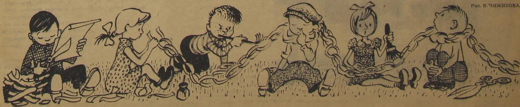
Рис. В. ЧИЖИКОВА.