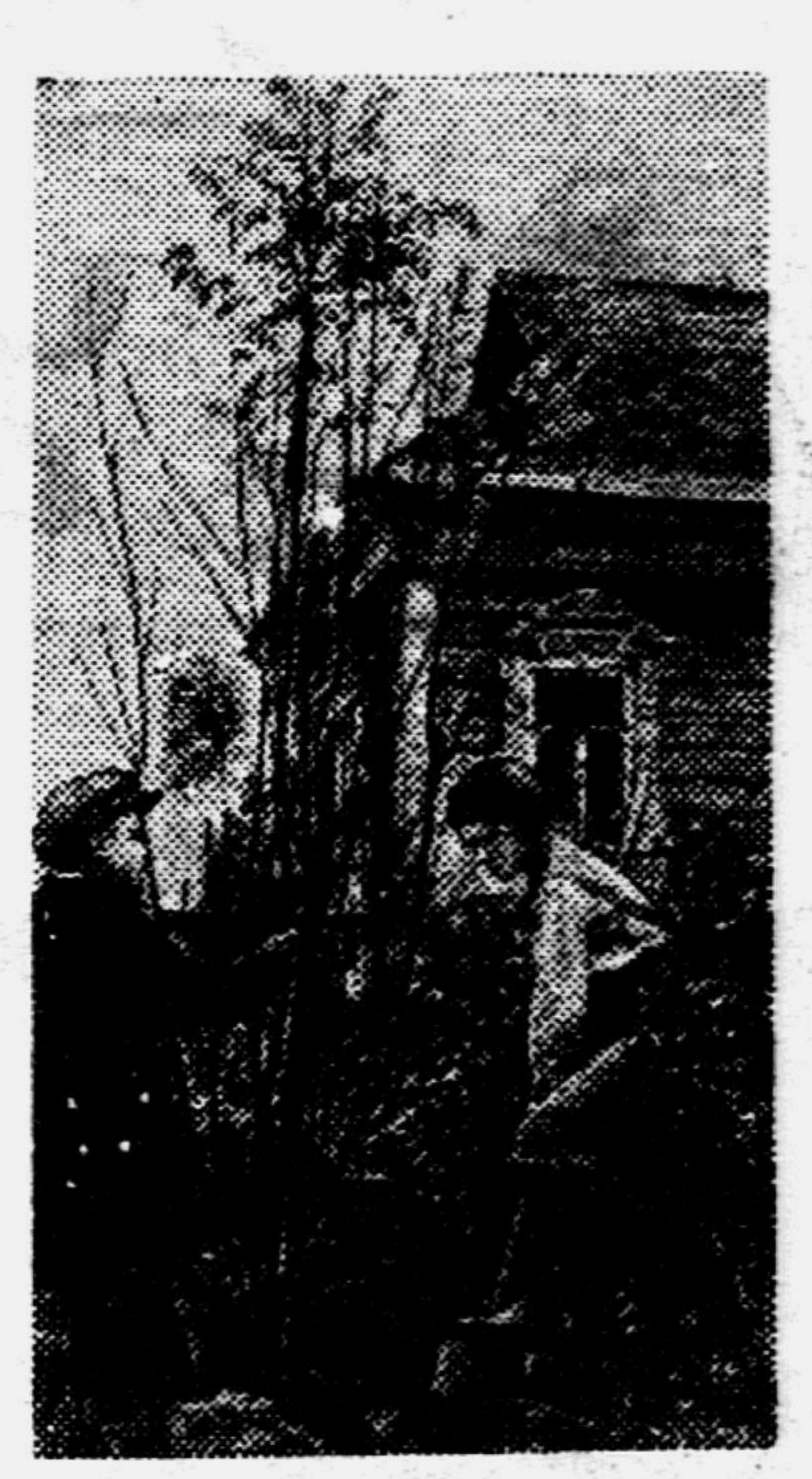
В Москве, на Трубной площади, открылся зелёный базар. Московские пионеры покупают там яблоны, крупноплодную смородину и различные многолетние цветы — сирень, золотые шары, ирисы. Ребята бережно обертывают корни и спешат отнести растения домой, чтобы посадить у себя во дворе.