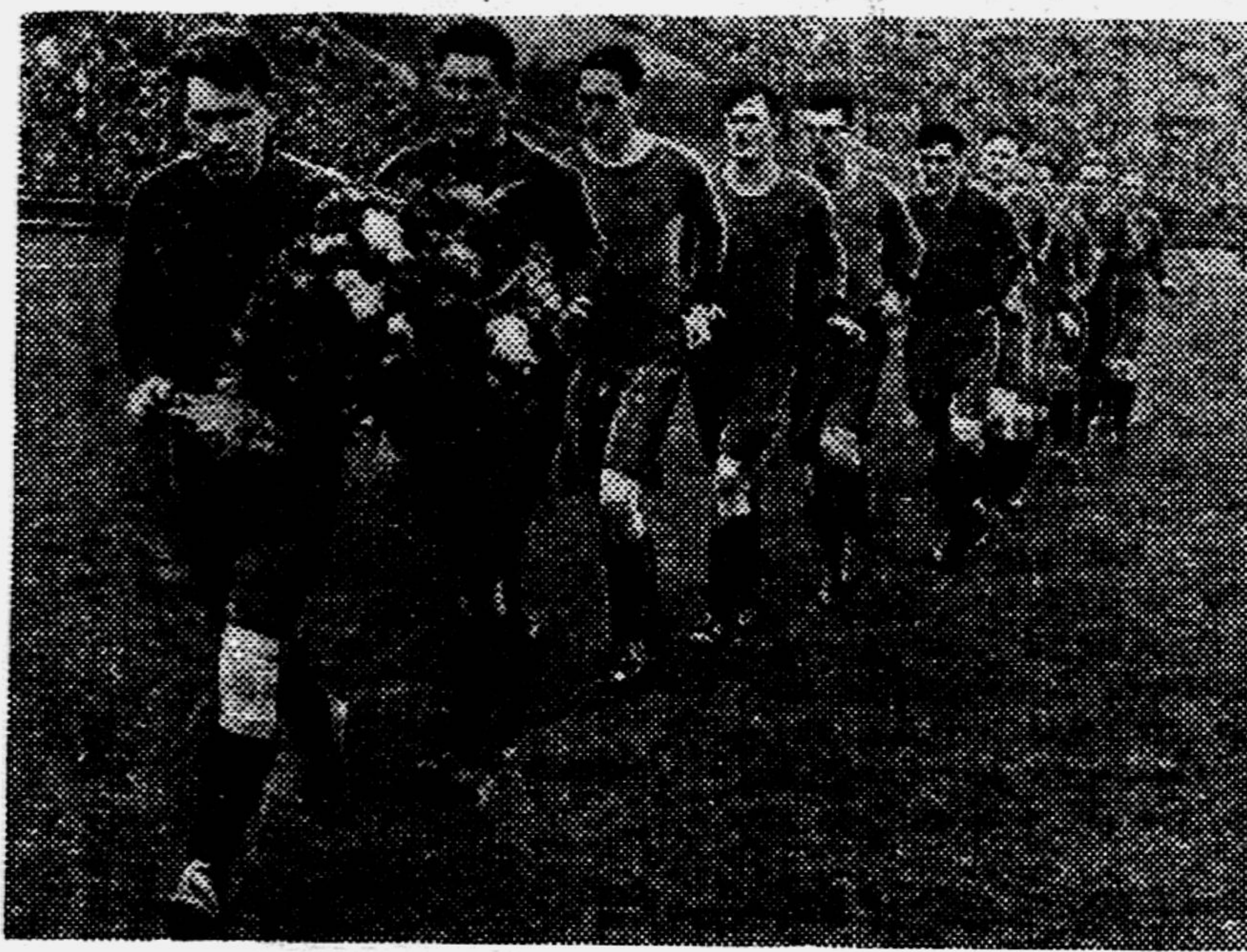
Команда ЦДКА выходит на поле стадиона.

Больше 80 тысяч москвичей пришло в воскресенье на Московский стадион «Динамо» посмотреть финальный матч на «Кубок СССР». Игра эта была, пожалуй, самой интересной в нынешнем сезоне. Встретились сильнейшие команды страны — московское «Динамо» и ЦДКА. С первых же минут динамовцы повели энергичное наступление; на девятой минуте был забит первый мяч в ворота ЦДКА. От второго гола с трудом спас свою команду вратарь ЦДКА Никаноров, который буквально снял мяч с ноги прорвавшегося к воротам динамовца Трофимова. Только полминуты оставалось до перерыва, а счёт ещё был 1:0 в пользу «Динамо». Но вот ловкий «двойной» удар Боброва и Николаева — и мяч в сетке динамовцев! Счёт 1:1. Как ни старались динамовцы, им не удалось сдержать натиск армейской команды. Сильным ударом полузащитник А. Виноградов забивает второй мяч в ворота «Динамо». Игра окончена. Счёт 2:1. Здесь же на поле игры команде-победительнице был вручён «Кубок СССР».