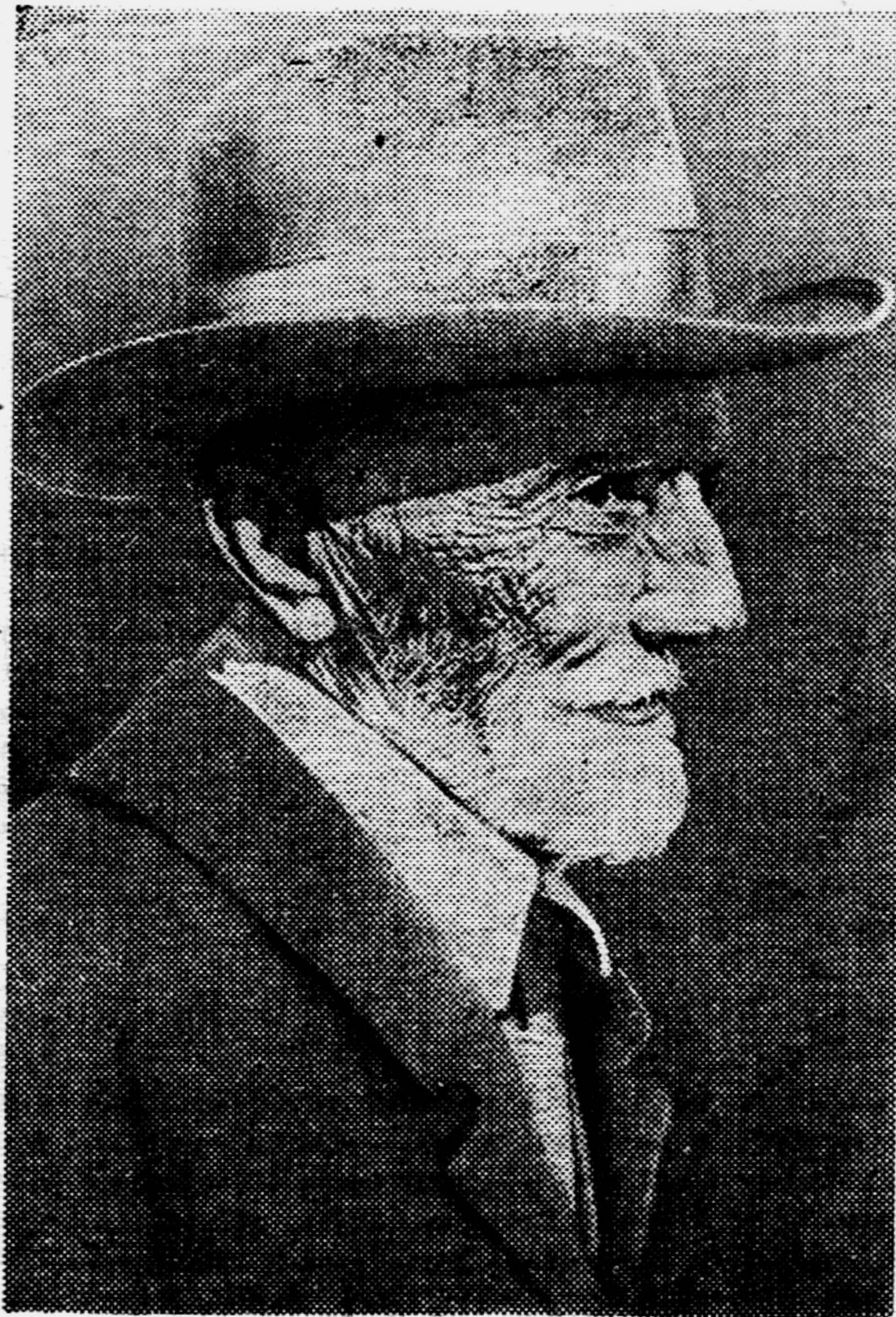
И. В. МИЧУРИН.