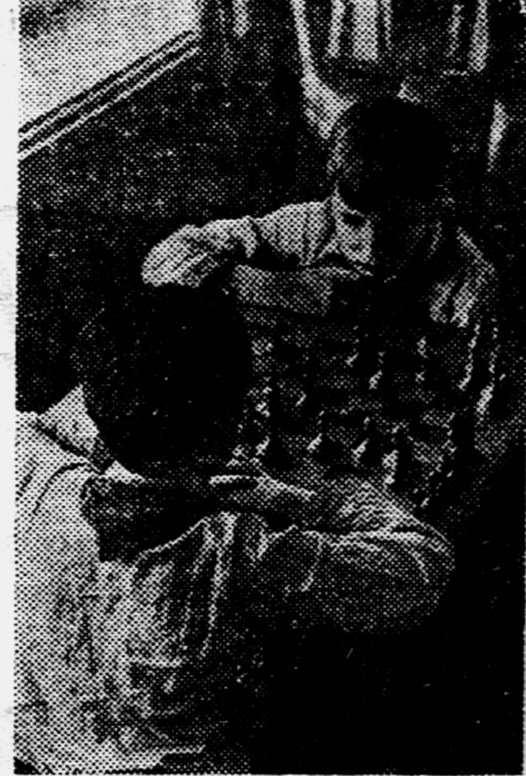
За шахматной доской.