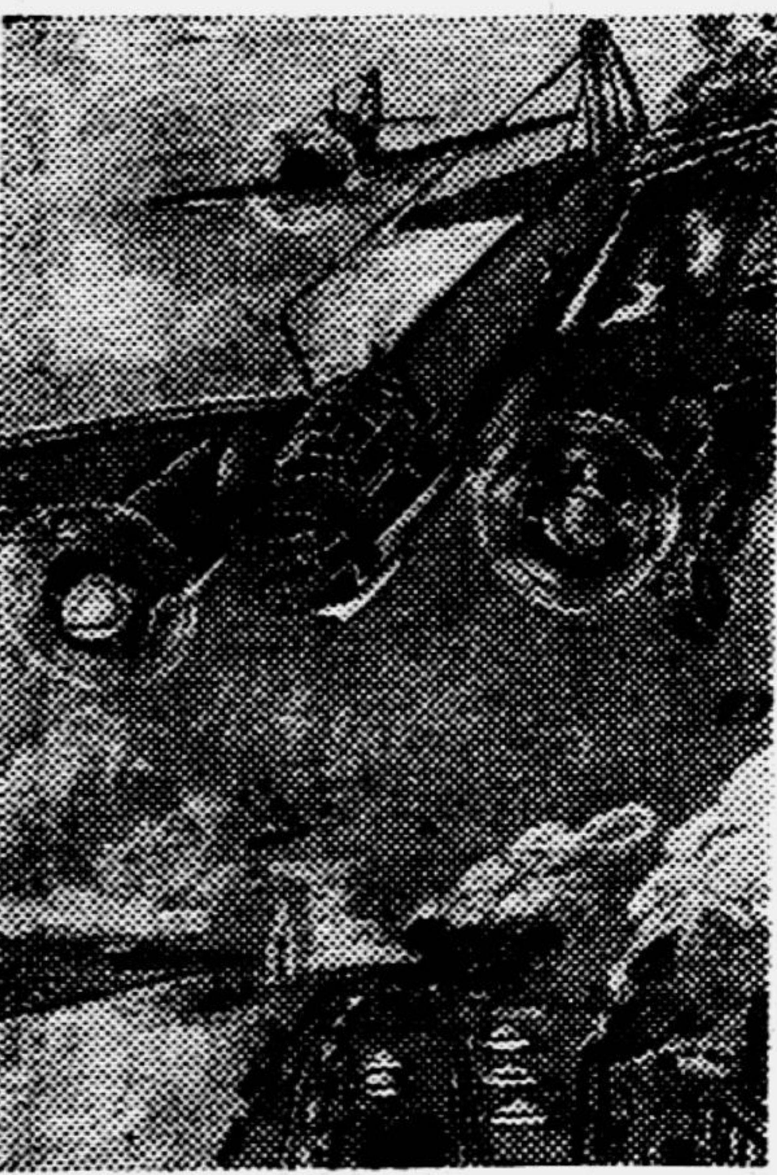
«Фашистский самолёт горит». Рисунок школьника Г. Красте, 14 лет (г. Рига).