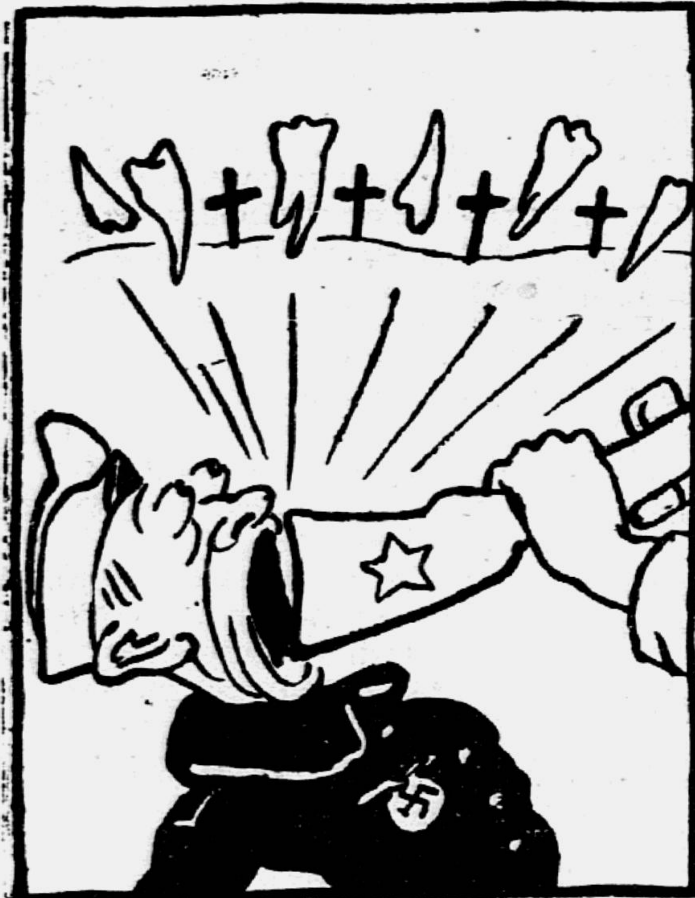
По арифметике — сложение выбитых зубов.