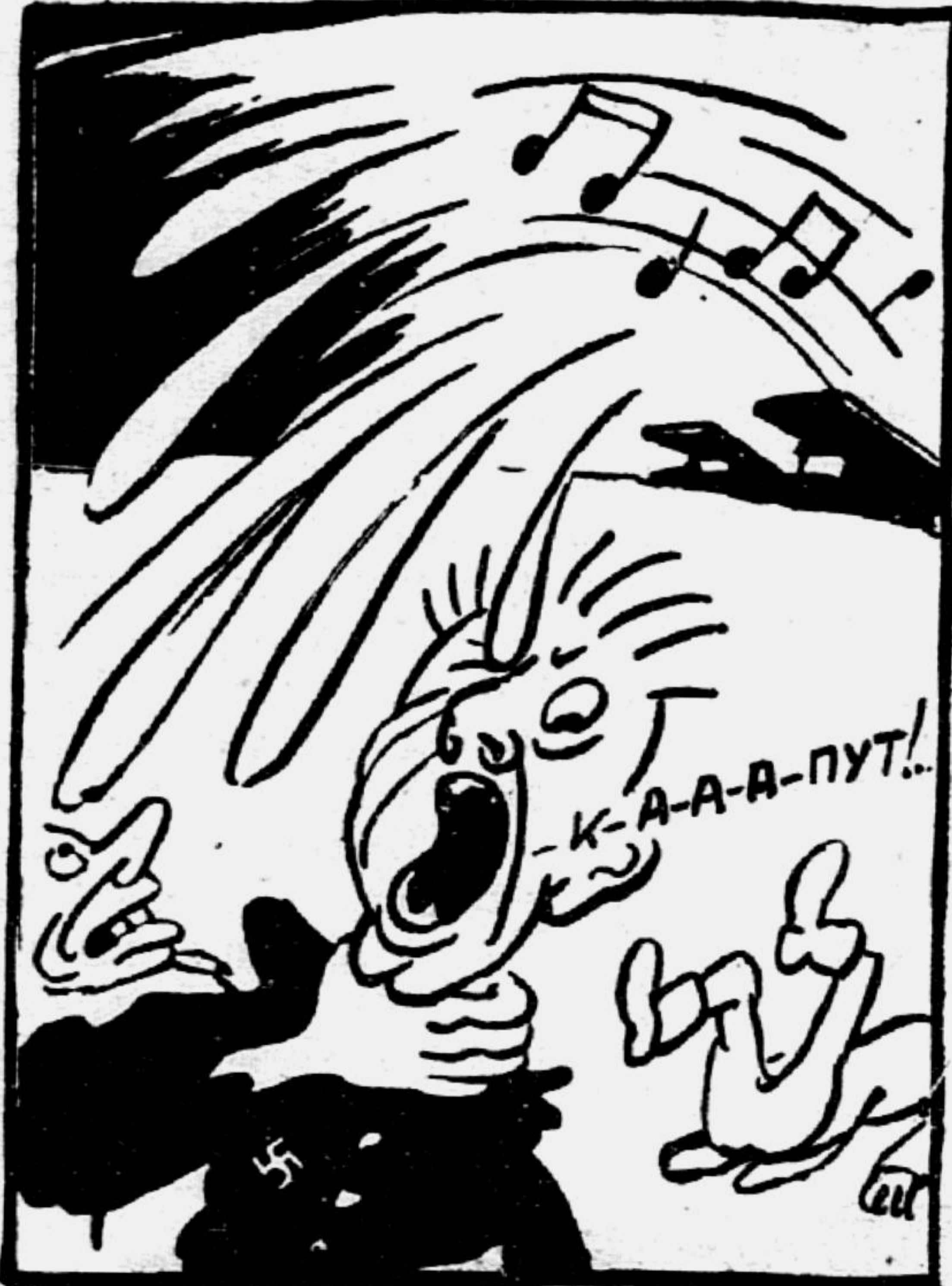
Урок пения под музыку «катюши».