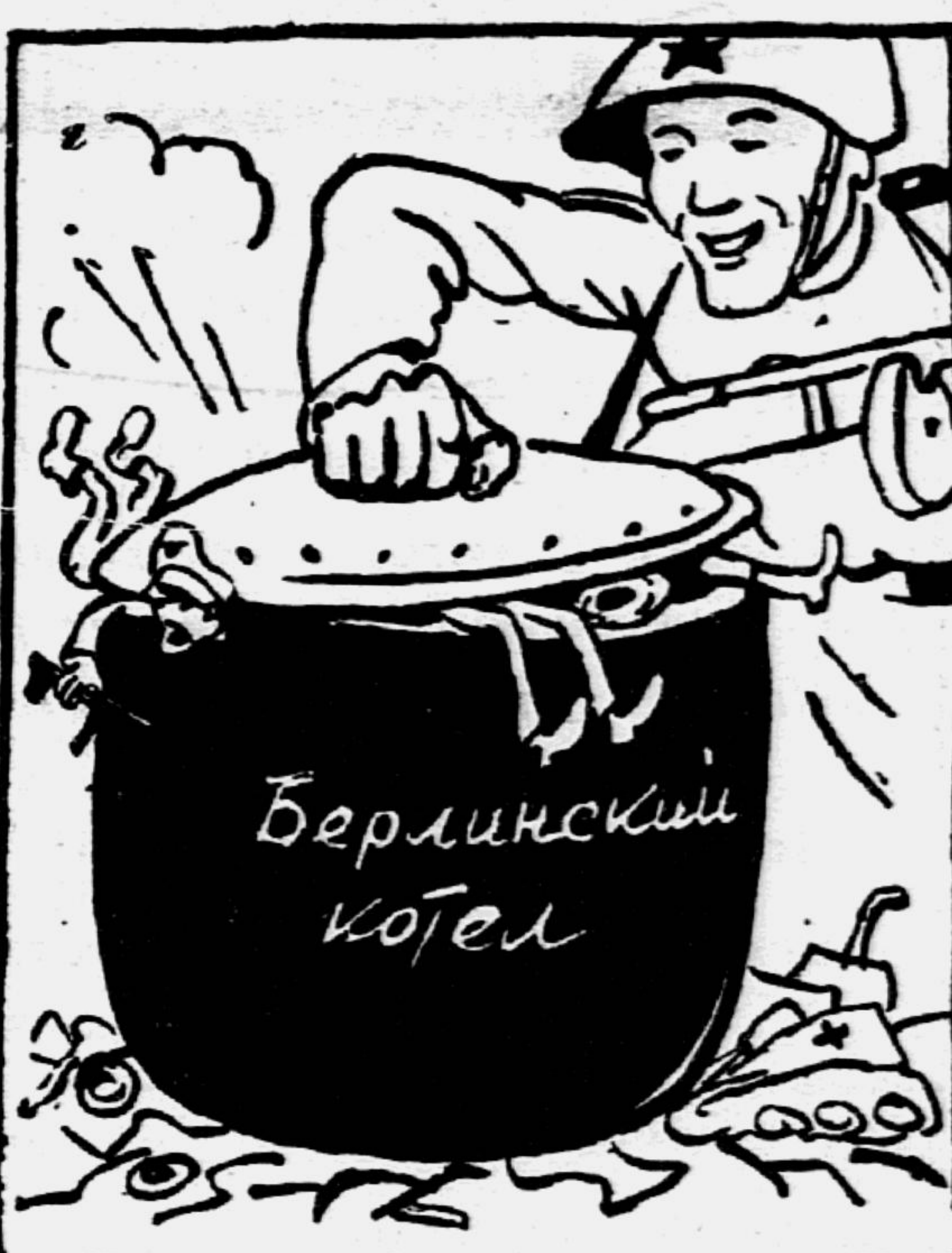
Ознакомление с тактикой и стратегией Красной Армии.