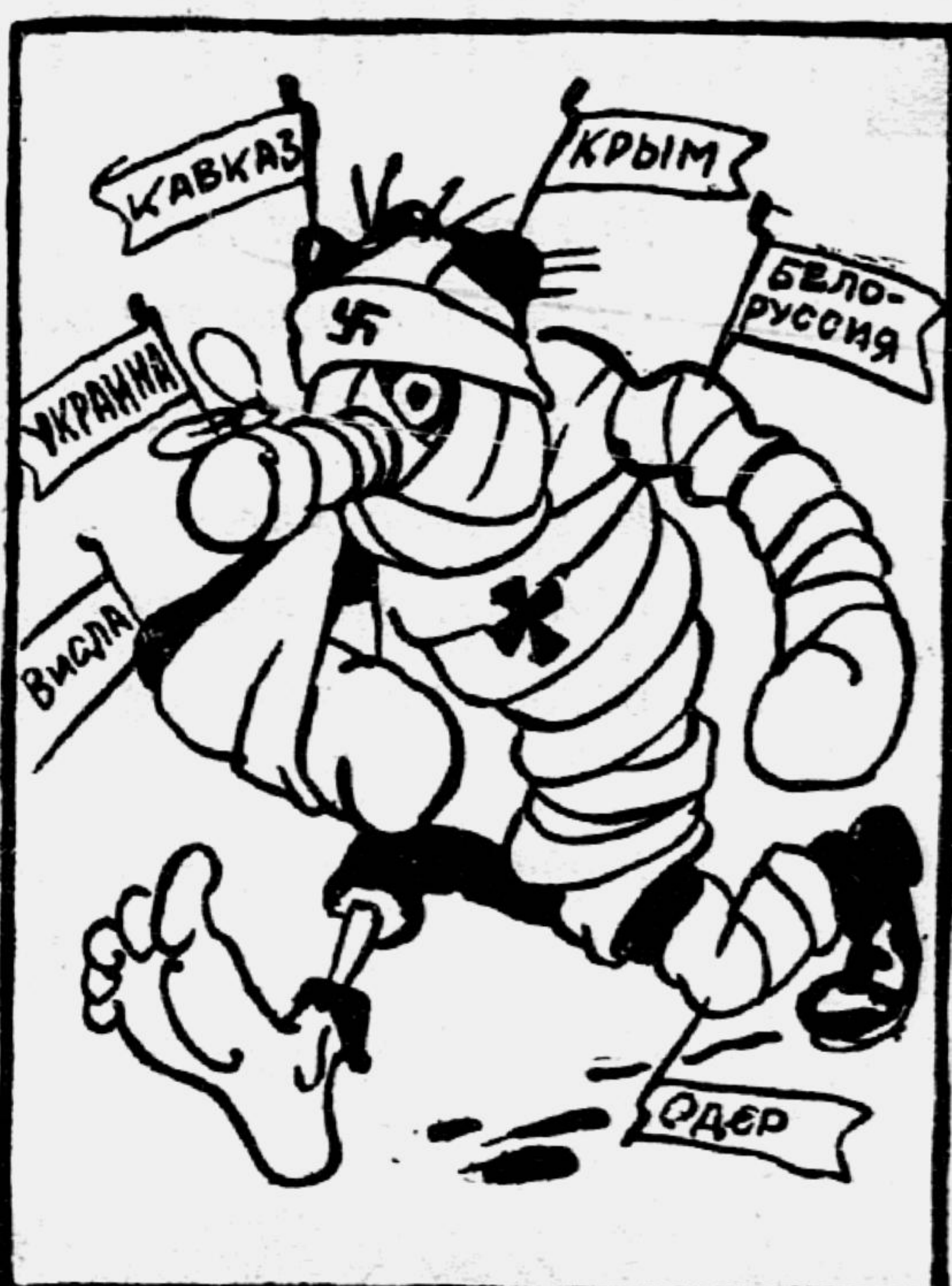
Отметки по географии — весьма поучительные.