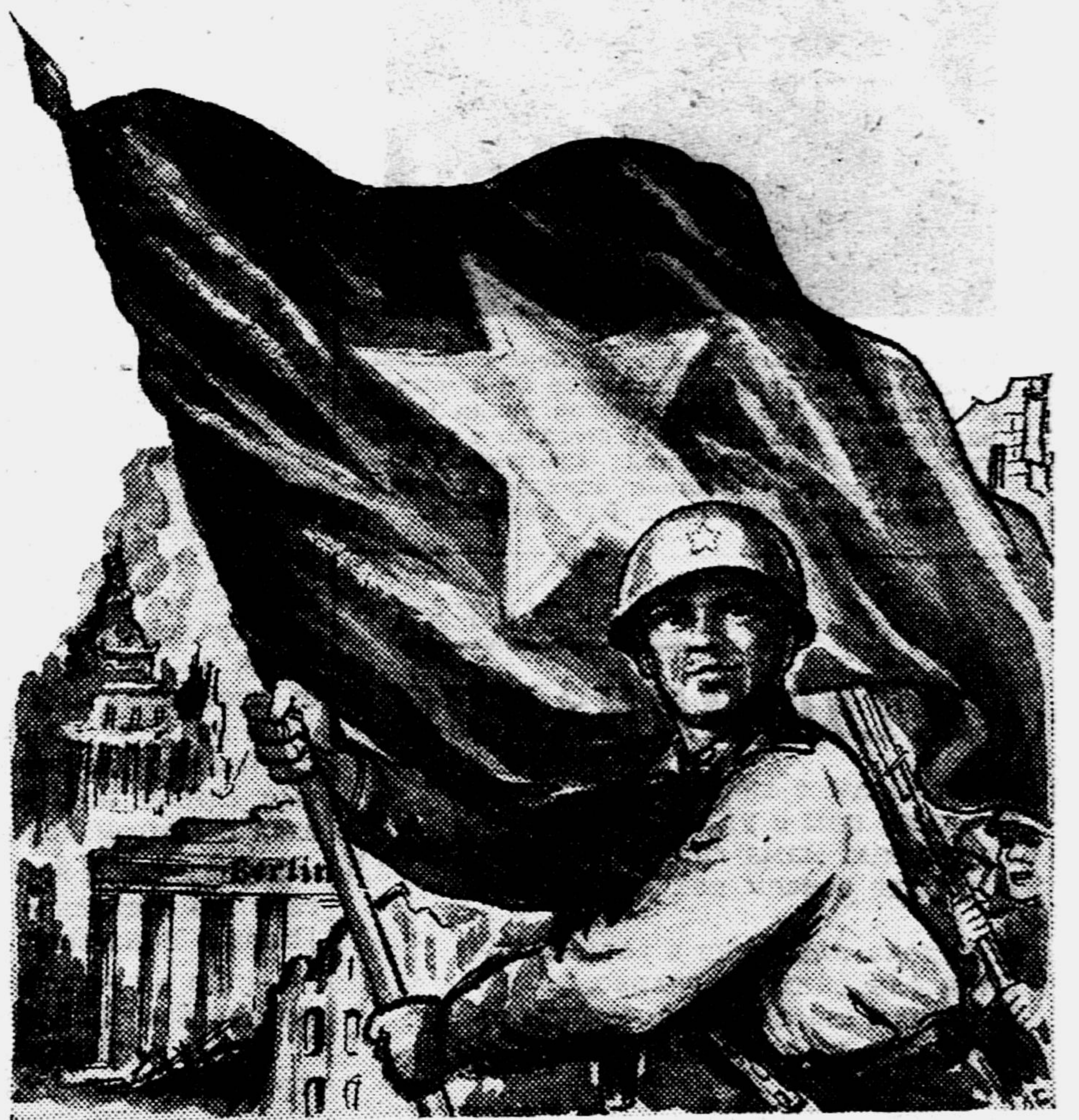
Рисунок Л. СМЕХОВА.

Желаю вам, ребята, быть достойными этого дня и скорее встретить его. Он близок, друзья!