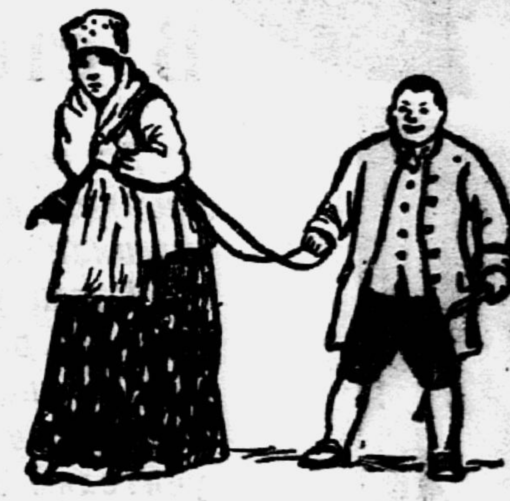
«...То-то умное дитя, то-то разумное, забавник, затейник...»

Денис Иванович Фонвизин родился в Москве 14 апреля 1745 года в семье чиновника. Образование он получил в Московском университете, окончив философский факультет. Затем началась служба. Далее всего Фонвизин служил в коллегии иностранных дел, секретарём. Как писатель и общественный деятель он выступил в 60-х годах XVIII века. Это было тяжёлое для нашего народа время. Крестьянство изнывало в цепях крепостничества. За 8 лет до появления на сцене «Недоросль» произошло пугачёвское восстание, которое было подавлено. Деспотическая власть Екатерины II вызвала недовольство и брожение в передовых слоях русского