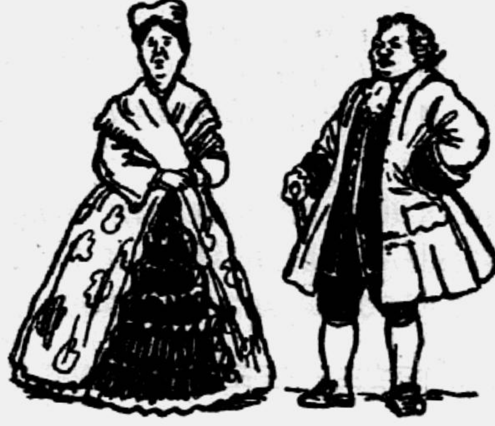
«...Нас ничему не учили... и не будь тот Скотинин, кто чему-нибудь учиться захочет».

Один из товарищей Гоголя по лицу писал так: «...Удачнее всего давалась у нас комедия Фонвизина «Недоросль». Видал я эту пьесу и в Москве и в Петербурге, но сохранил всегда то убеждение, что