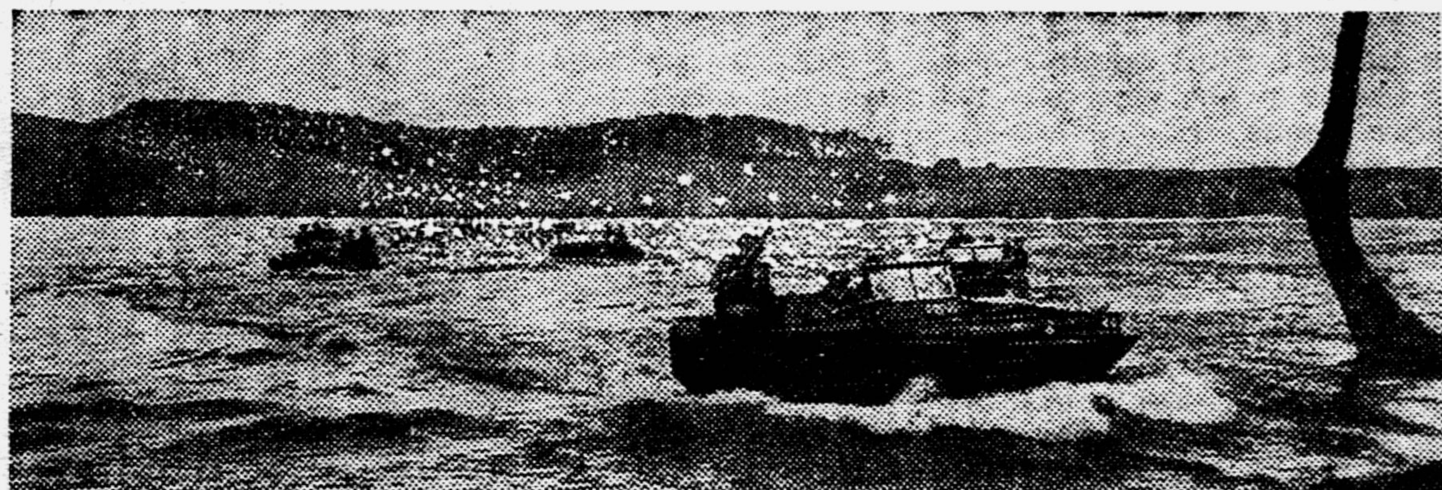
Действующая армия. Автомобили-амфибии форсируют водный рубеж.

Юго-западнее озера Балатон наши войска, действуя совместно с войсками болгарской армии, очистили от противника всю юго-западную часть Венгрии и вступили на территорию Югославии.