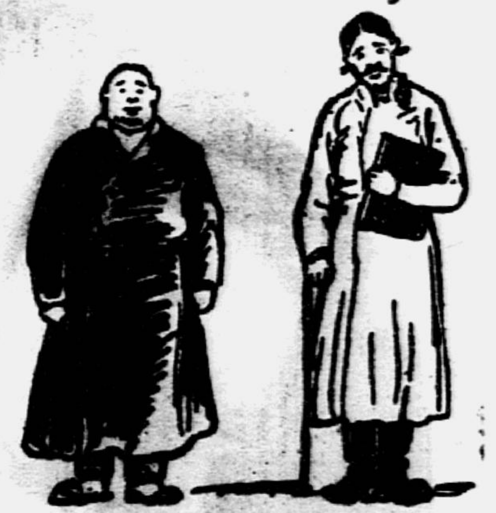
«...Для грамоты ходит к нему дьячок от Покрова-Кутейки. Арифметике учит его один отставной сержант Цыфиркин».

ные представители крепостнической России. Никто до Фонвизина не изображал их так смело и так выпукло. И недаром сатира «Недоросля» нашла отклик в русской литературе, в творчестве Гоголя,