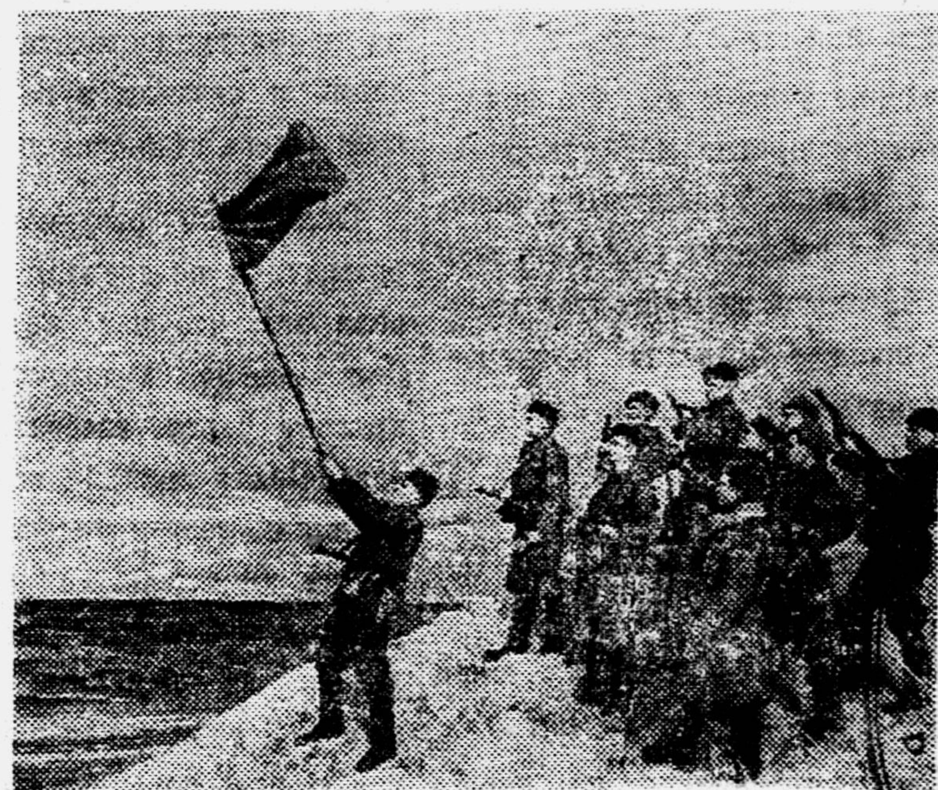
В Германии в районе Кезлина. Разведчики водружают советский флаг на берегу Балтийского моря.