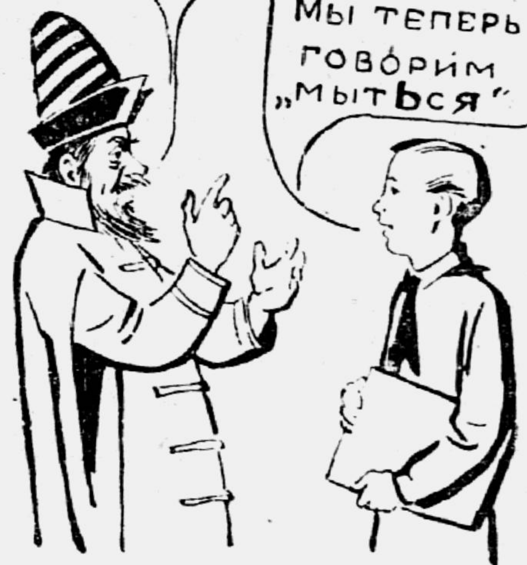
Рис. Ник. КОГОУТА.