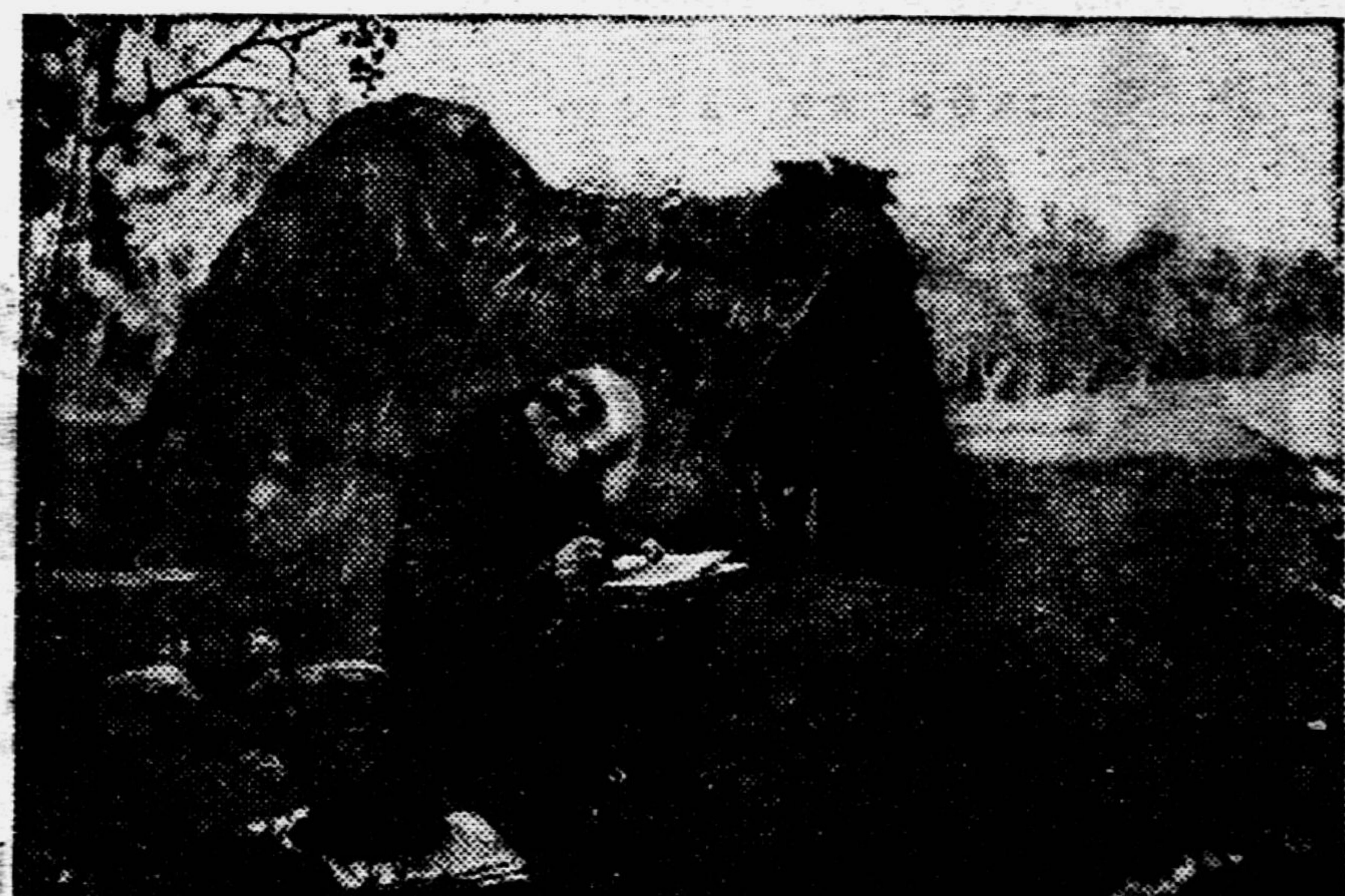
В. И. ЛЕНИН в Разливе.