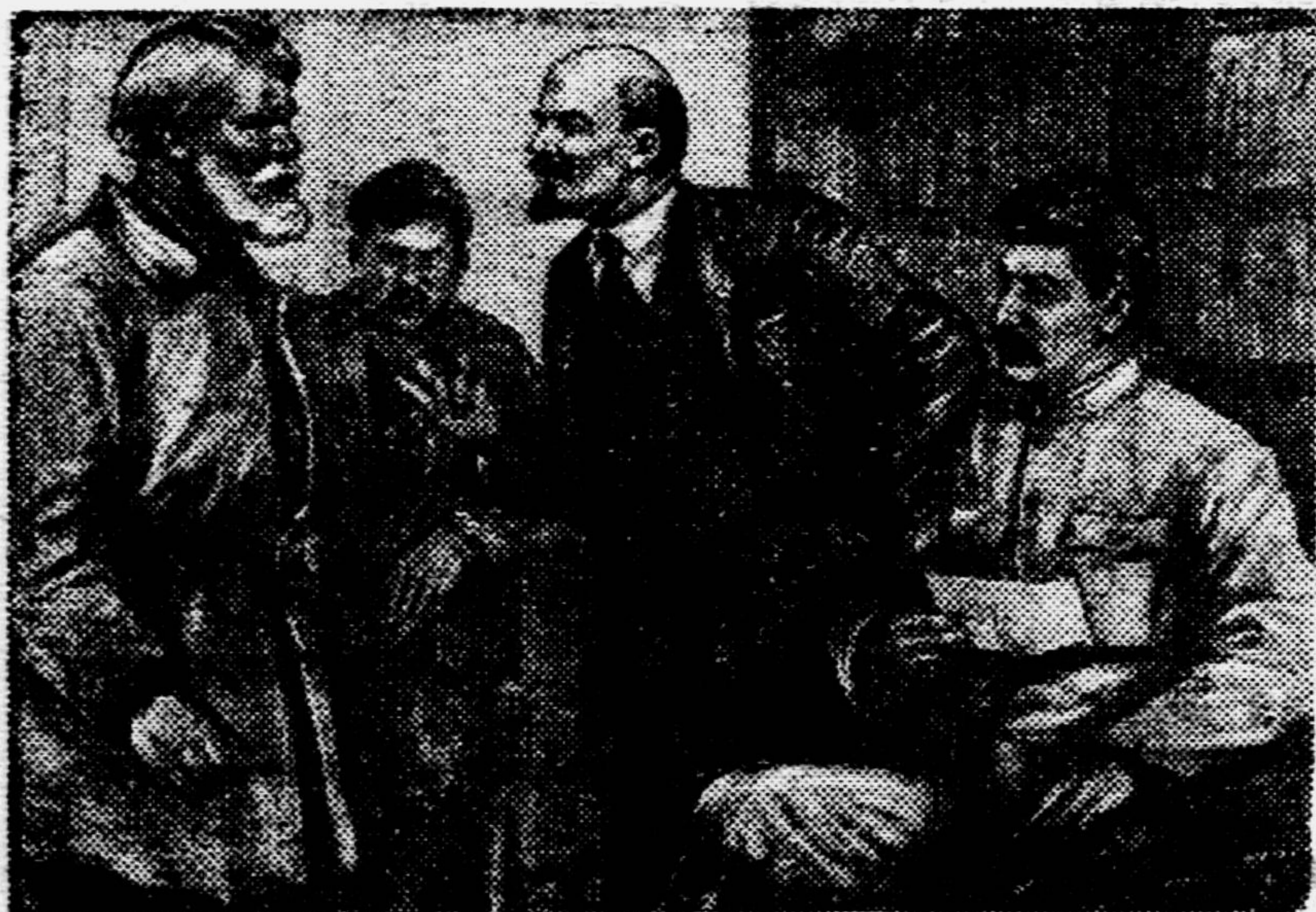
В. И. Ленин и И. В. Сталин беседуют с крестьянами-ходоками.