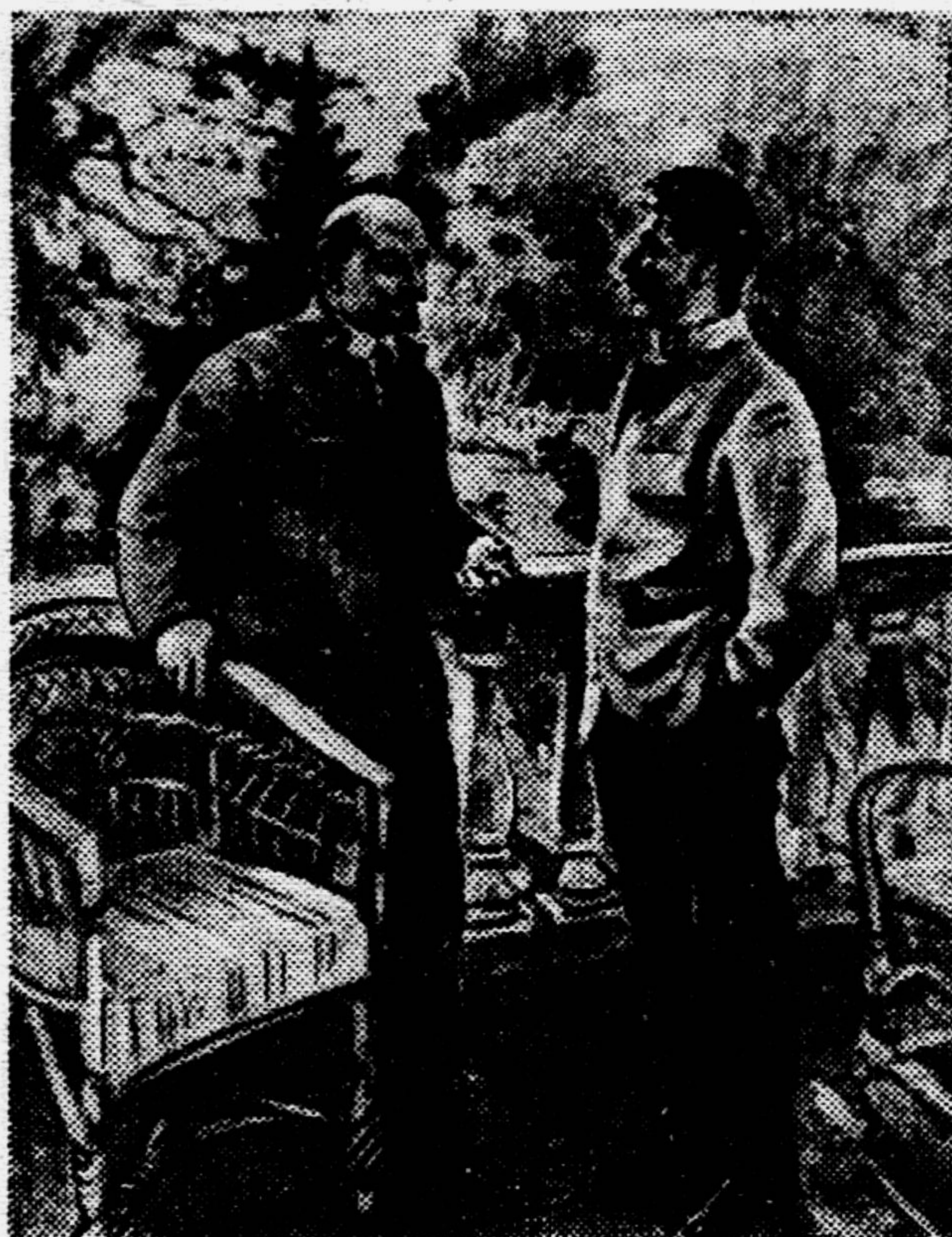
В. И. Ленин и И. В. Сталин в Горках.