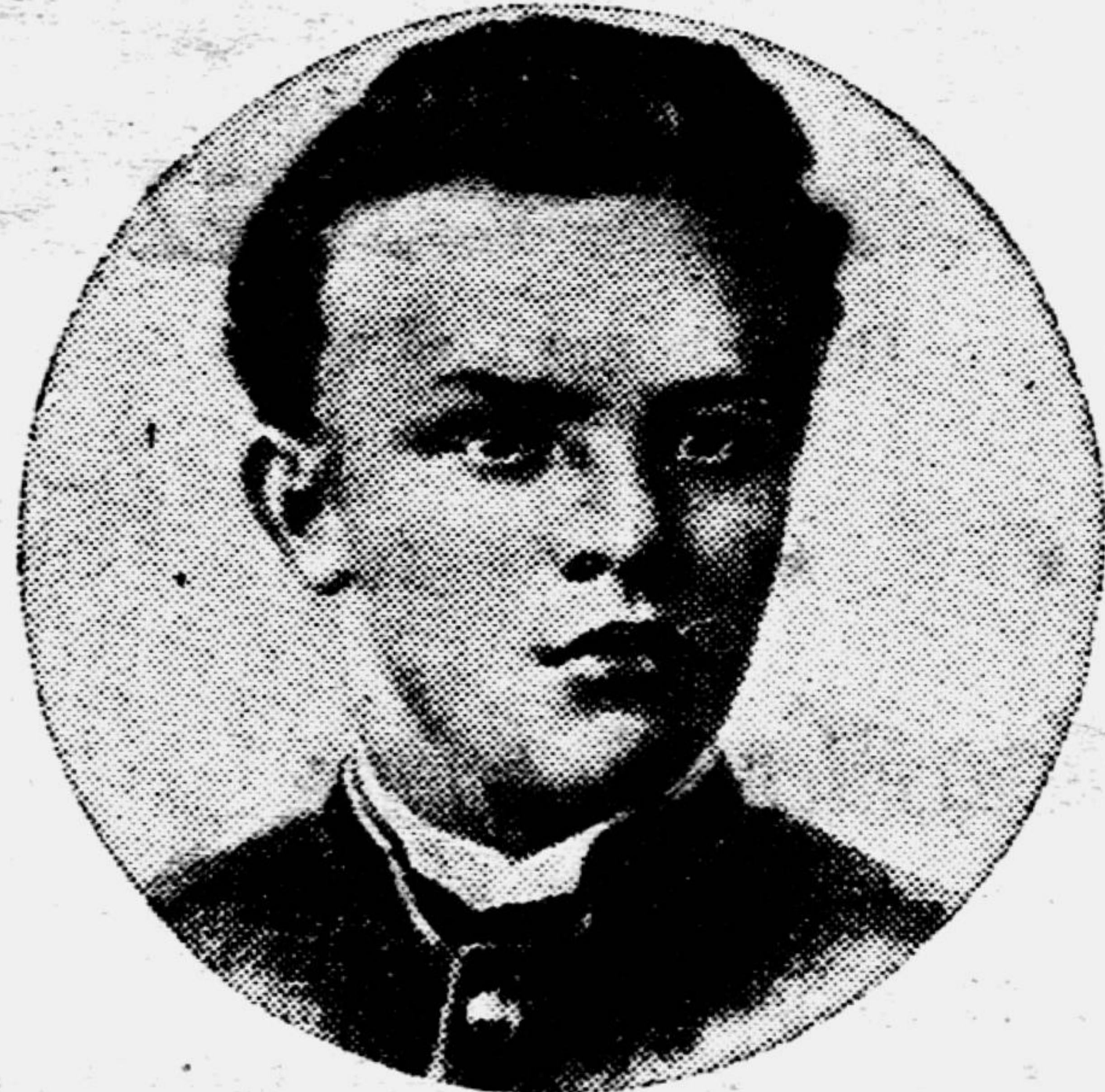
В. И. ЛЕНИН — гимназист.