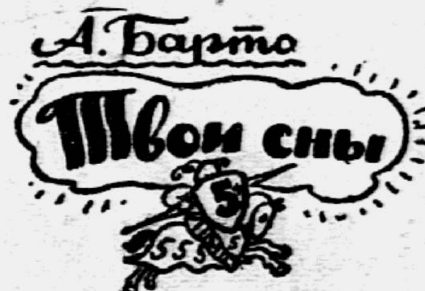
Рис. А. ДАВЫДОВОЙ.

Перед тем, как спать ложиться, Ты заказываешь сон. Ну, пускай тебе приснится Сон из рыцарских времён.