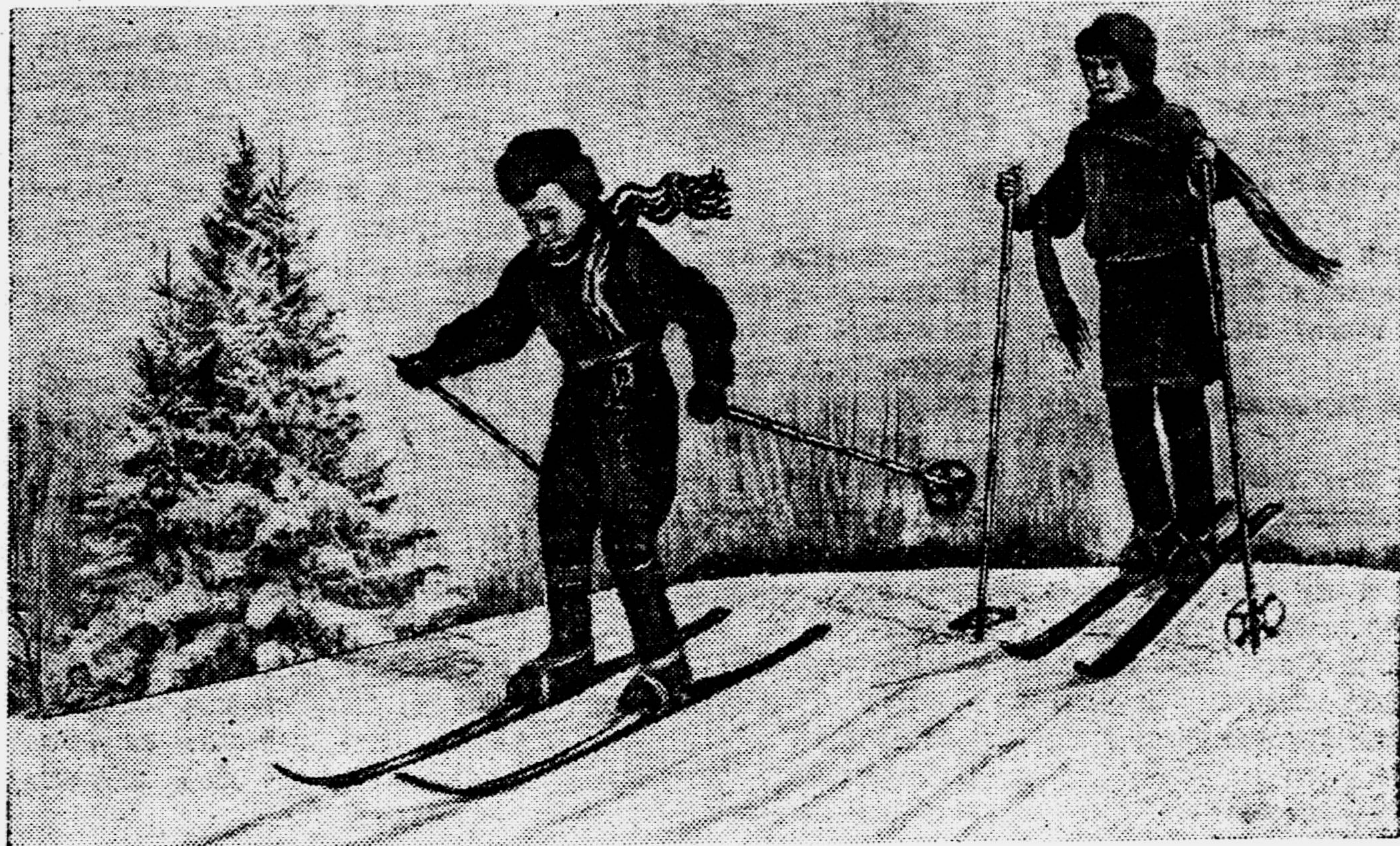
Выпал снег. Зима! Многие звеньевые и начальники штабов пионерских отрядов и дружин столицы уже совершили со своими пионерами первые вылазки за город. На снимке: на Ленинских горах под Москвой.