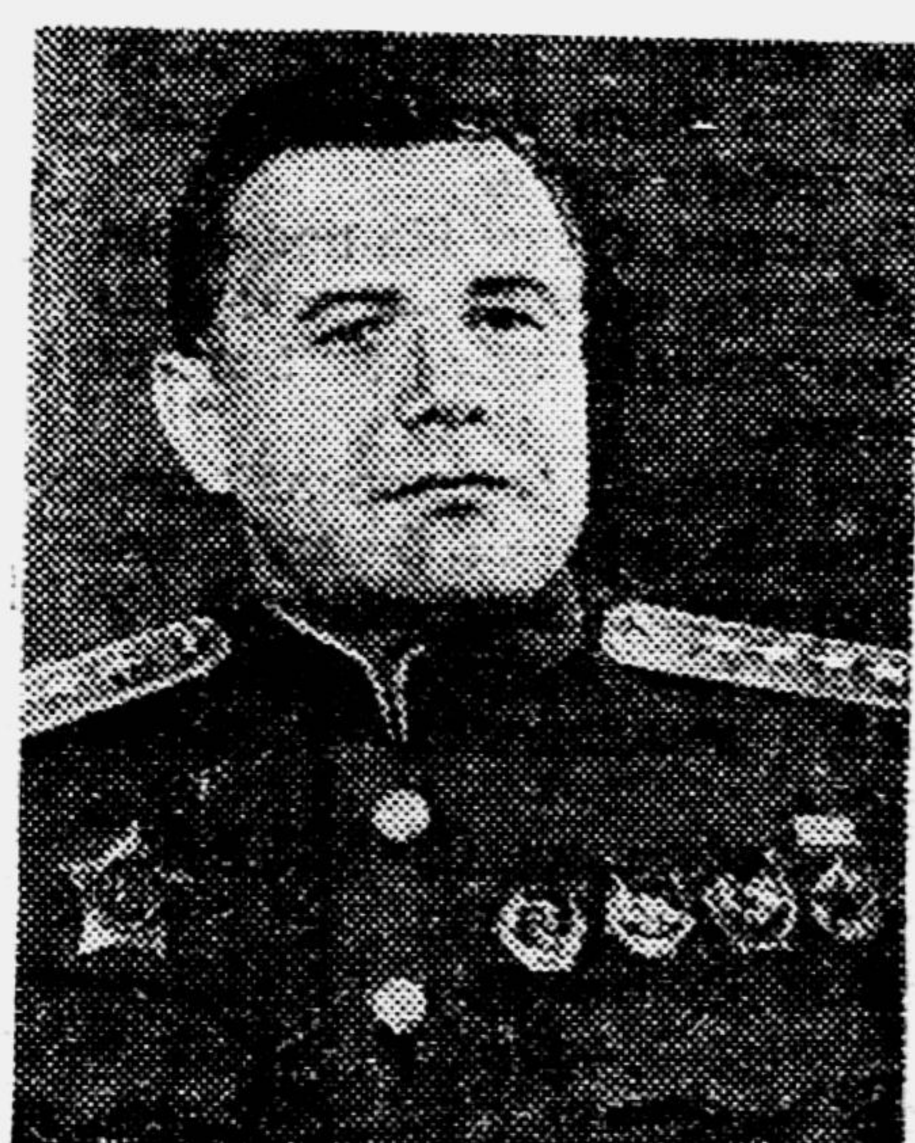
Герой Советского Союза Генерал Армии А. И. ЕРЕМЕНКО.