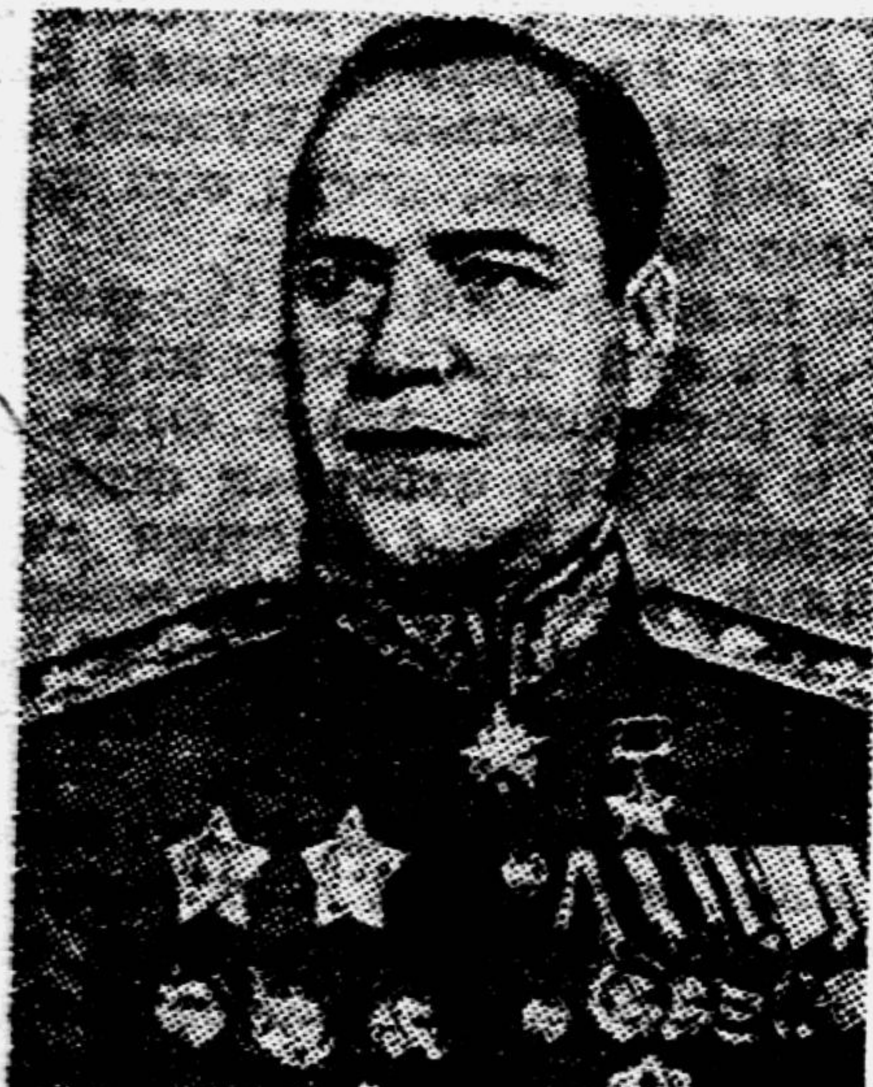
Дважды Герой Советского Союза Маршал Советского Союза Г. К. ЖУКОВ.

Слава маршалам, генералам, офицерам и воинам победоносной Красной Армии! Слава великому полководцу маршалу Советского Союза товарищу Сталину!