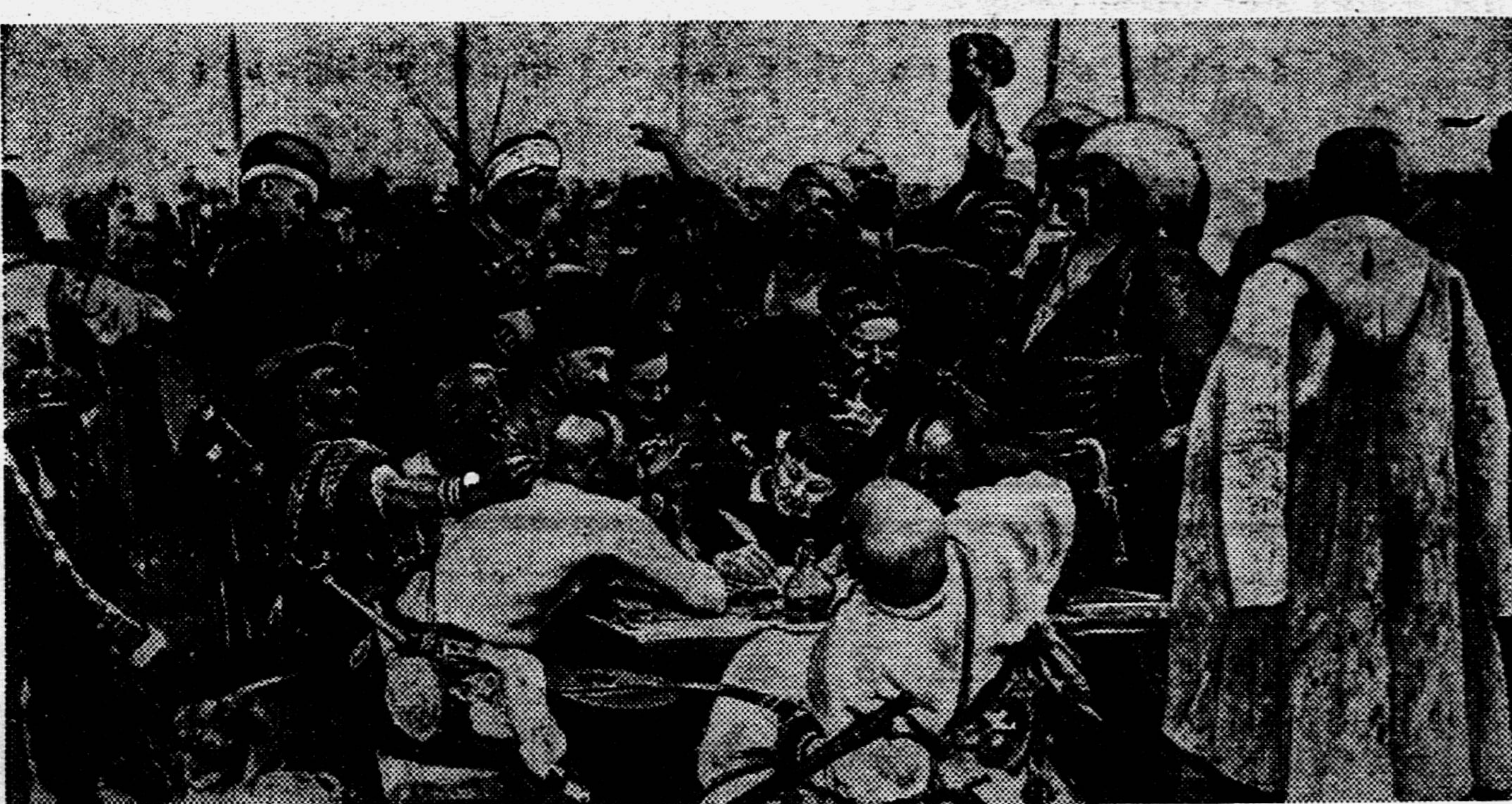
«ЗАПОРОЖЦЫ». Картина И. Е. Репина.