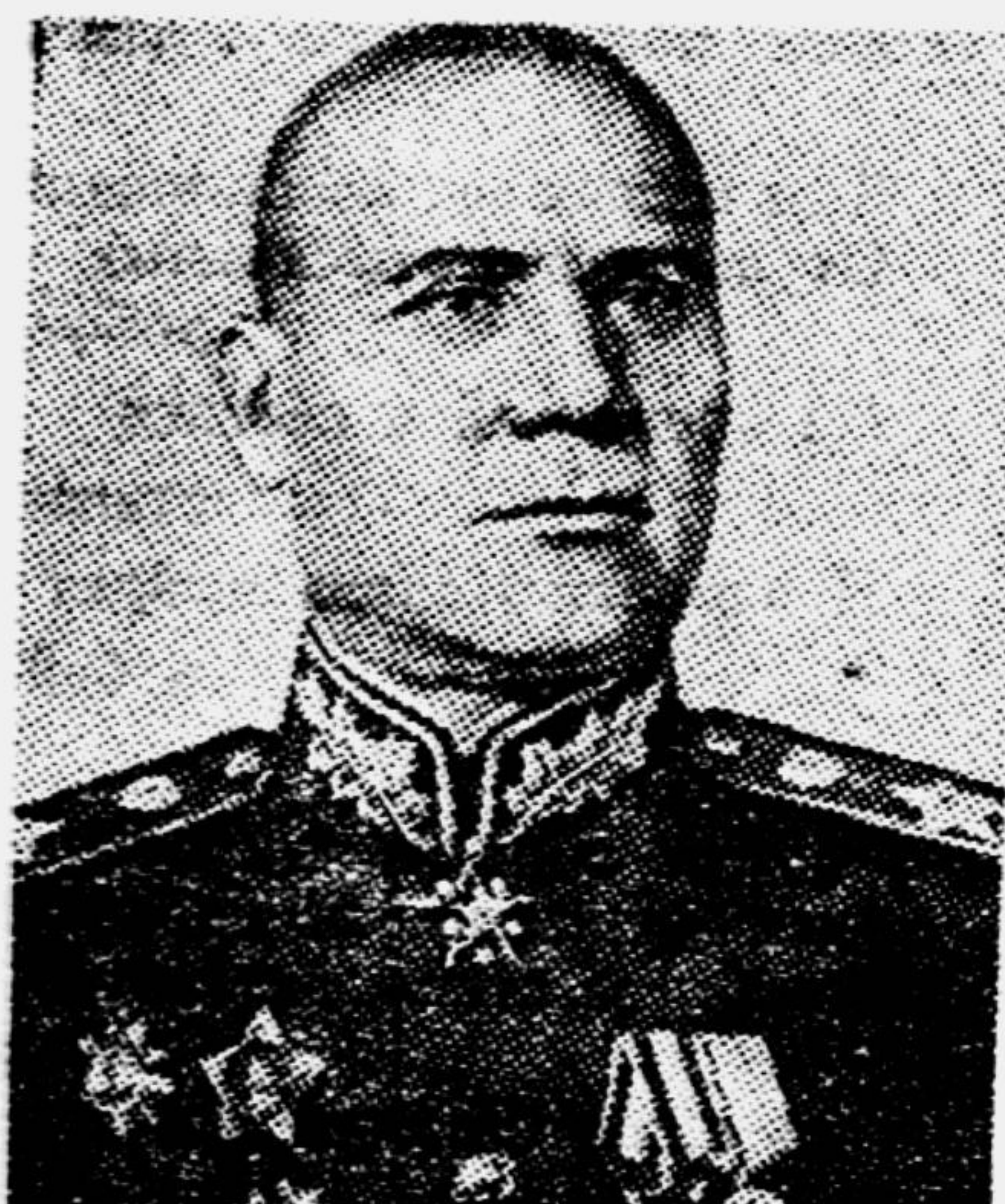
Герой Советского Союза Маршал Советского Союза И. С. КОНЕВ.