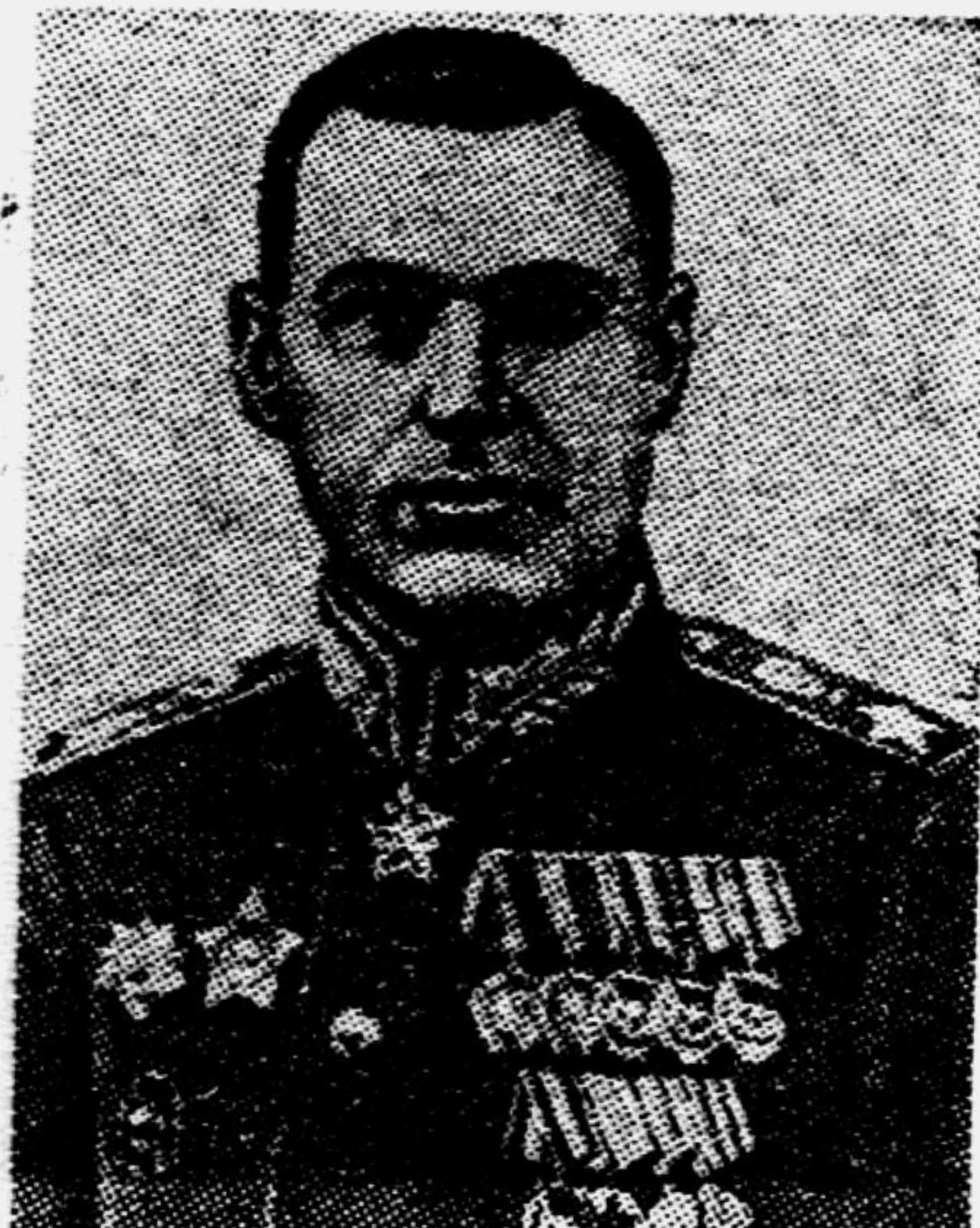
Герой Советского Союза Маршал Советского Союза К. К. РОКОССОВСКИЙ.