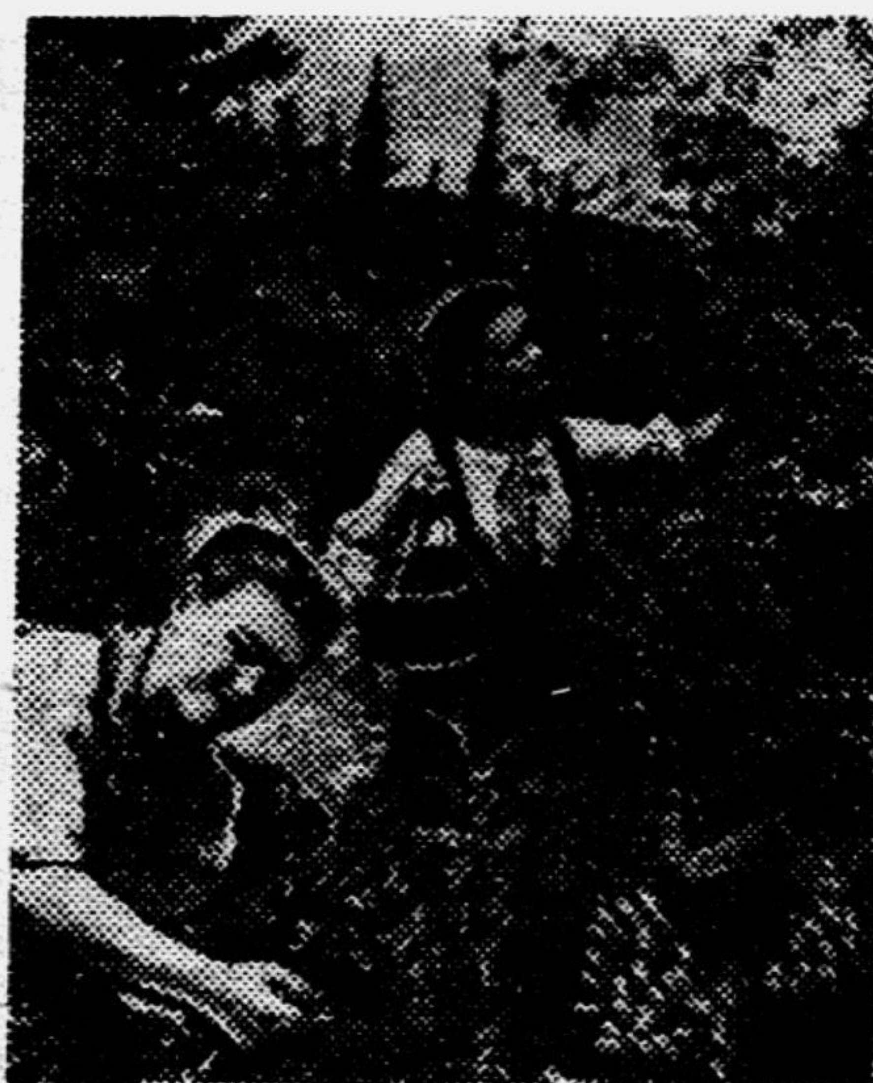
За сбором ягод и лекарственных трав (Ленинградский лагерь пионеров в Казахстане).

Он бродил среди родных полей, Как ловил с товарищами вместе Рыбок позолоченных — линей.