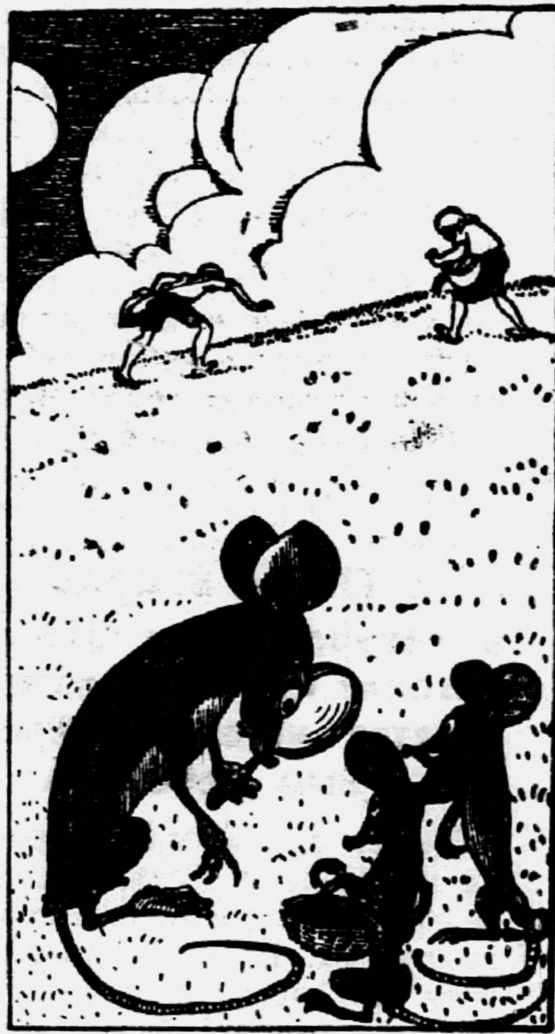
Рис. К. ЕЛИСЕЕВА