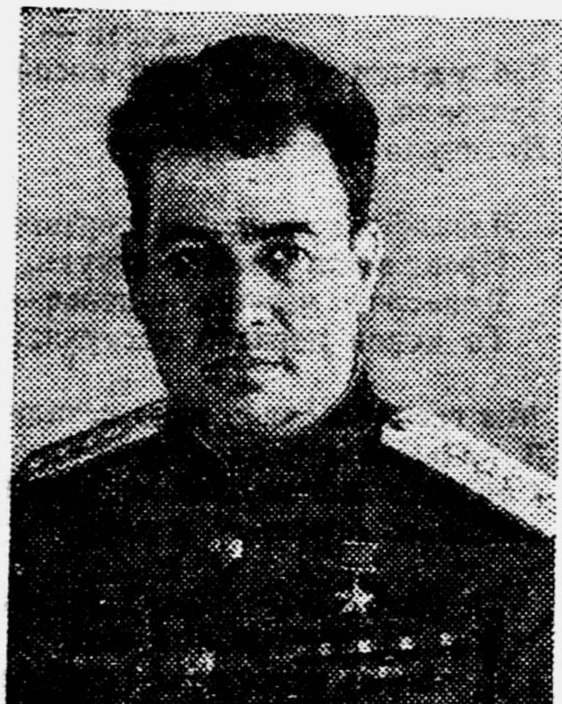
Дважды Герой Советского Союза Генерал Армии И. Д. ЧЕРНЯХОВСКИЙ.