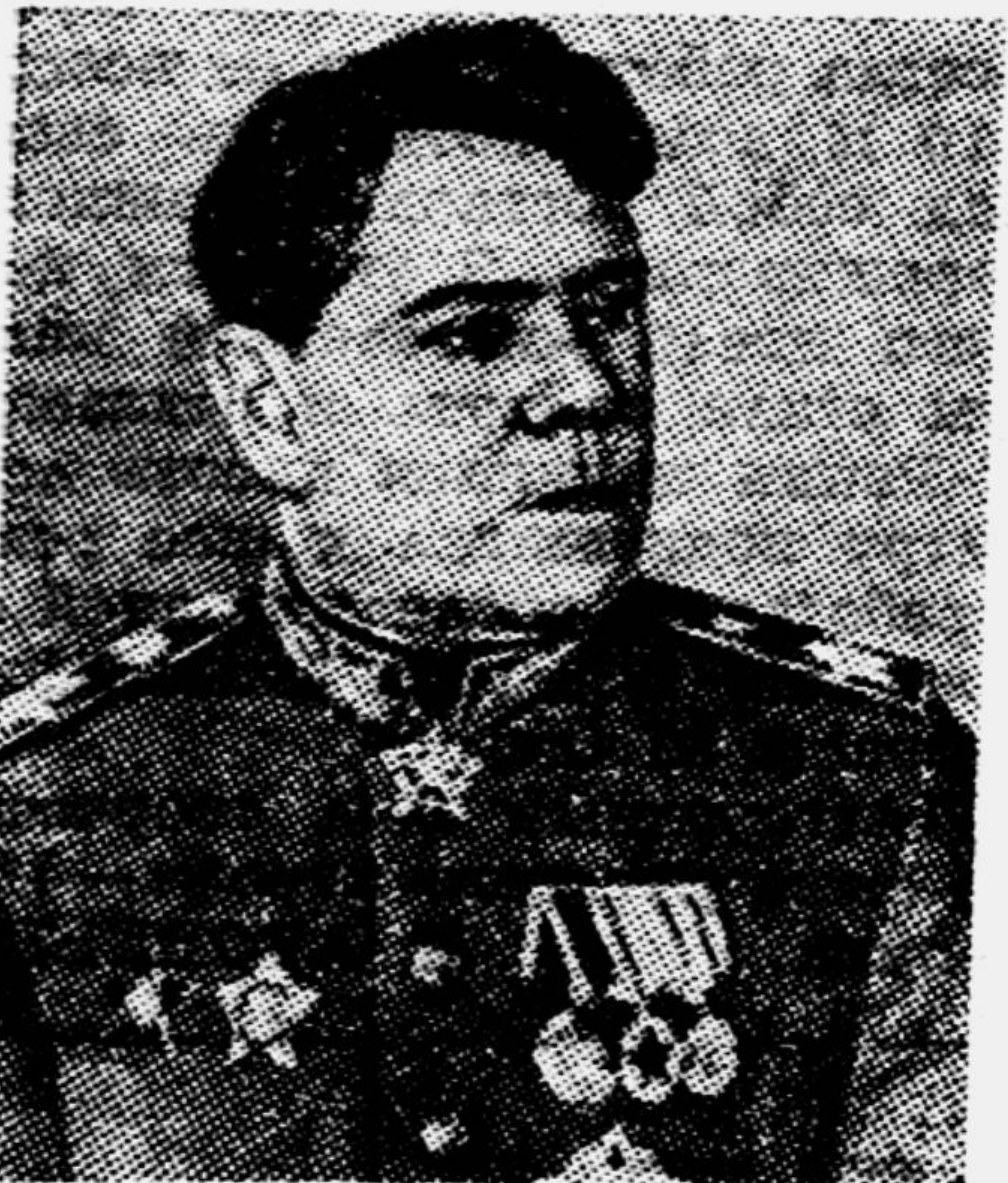
Герой Советского Союза Маршал Советского Союза А. М. ВАСИЛЕВСКИЙ.