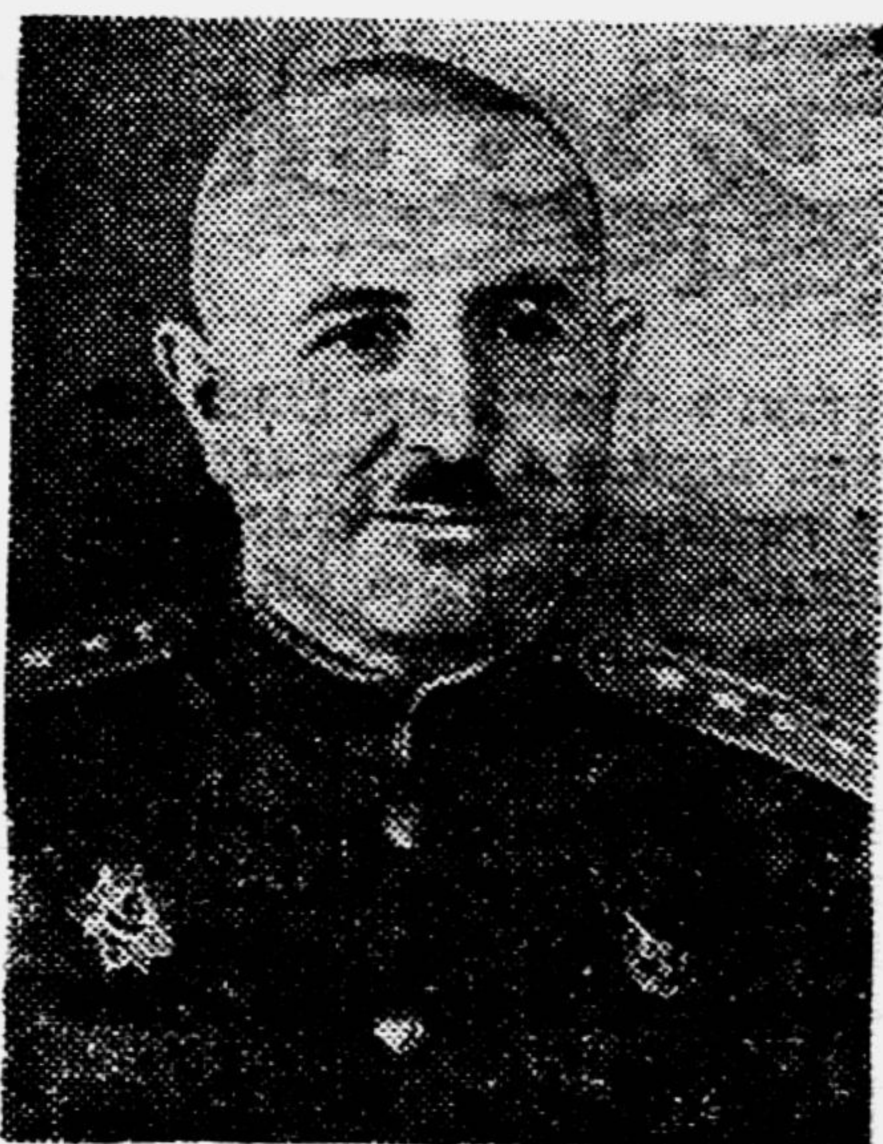
Герой Советского Союза Генерал Армии И. Х. БАГРАМЯН.