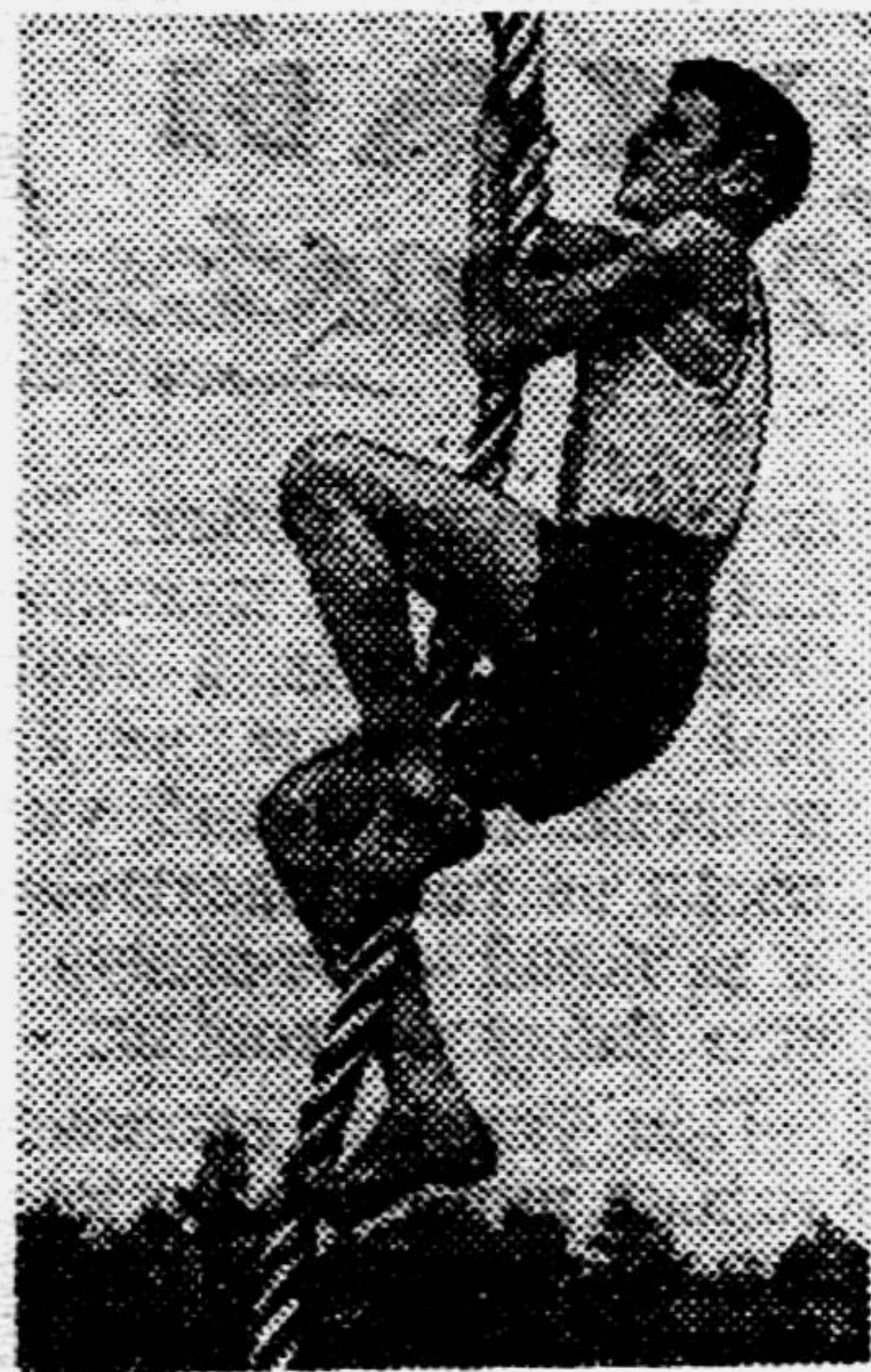
Всё выше! На московском Стадионе юных пионеров.

В городе Або произошла демонстрация против участия Финляндии в войне на стороне Германии. Полиция пустила в ход холодное оружие. Демонстранты бросали в полицейских камни и кричали: «Долой нацистов!» Такие же демонстрации произошли в Хельсинки и Тамперфорсе.