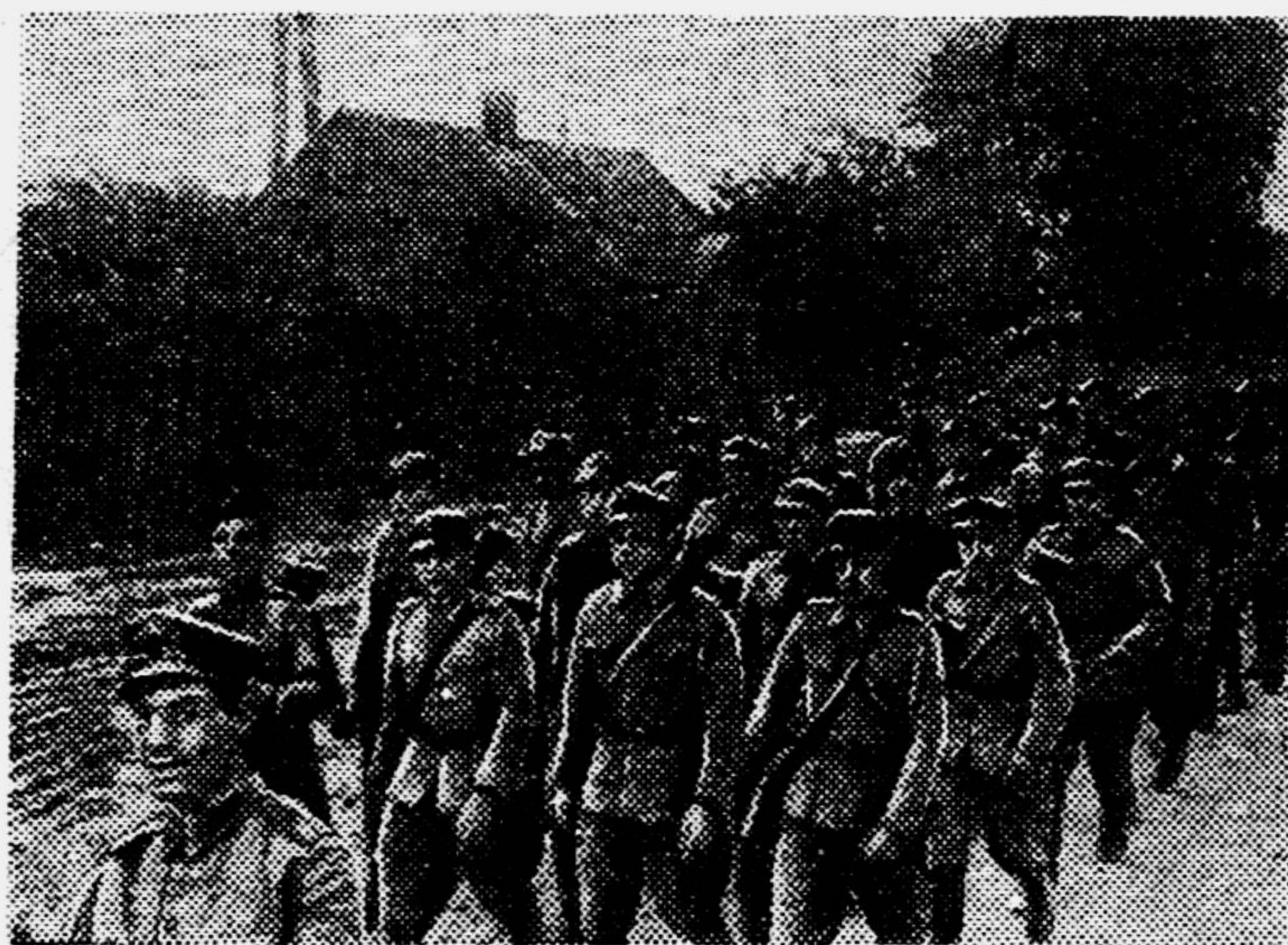
Часть польской армии на марше.

Красная Армия, преследуя и уничтожая гитлеровские полчища, перешагнула через реку Западный Буг и вступила на польскую землю. Вместе с Красной Армией вошли в родимую страну и части Польской армии, действующей на советско-германском фронте.