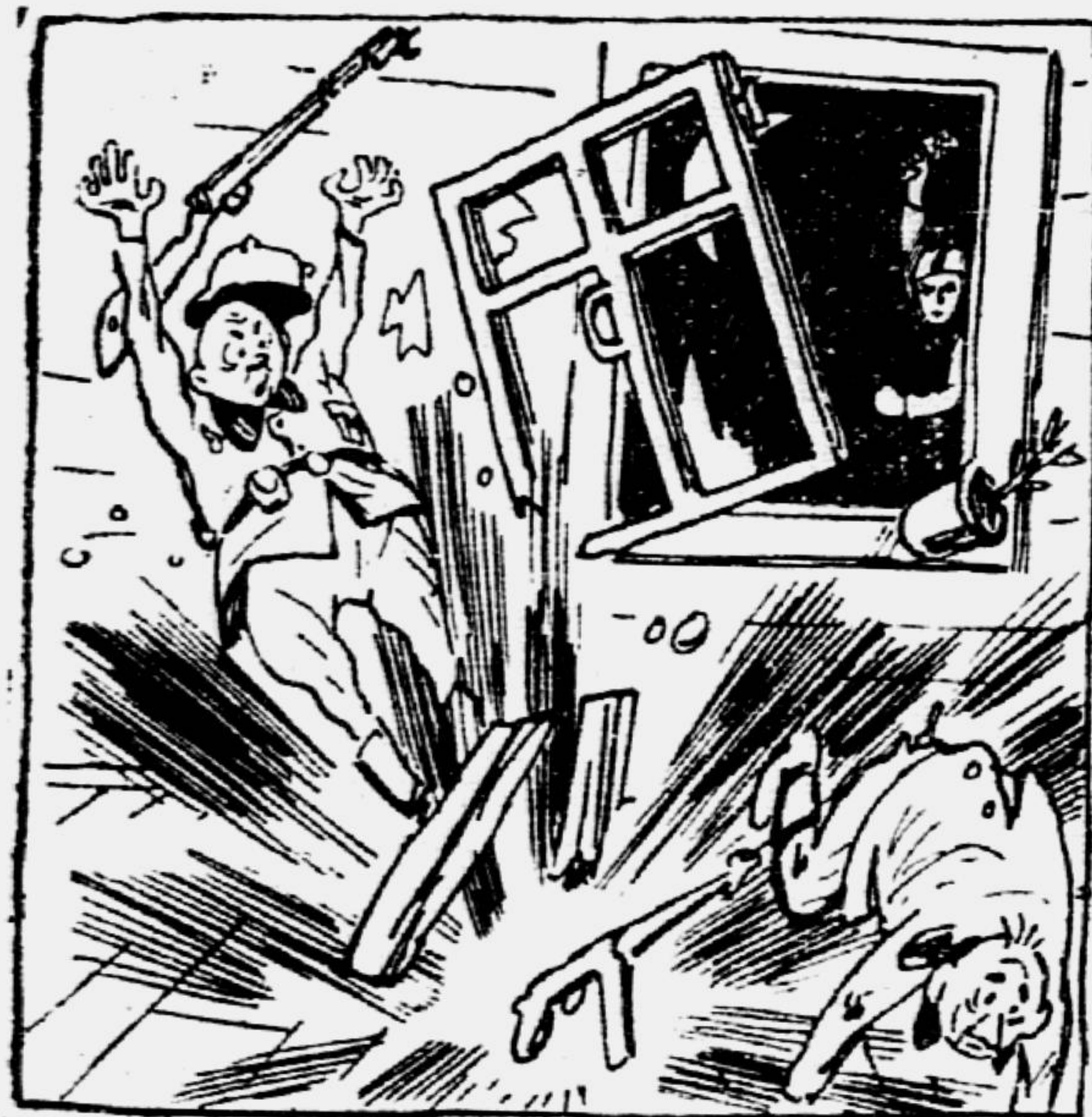
Рис. Г. ВАЛЬКА.

Весна! Выставляется первая рама — И в комнату шум ворвался... А. МАЙКОВ.