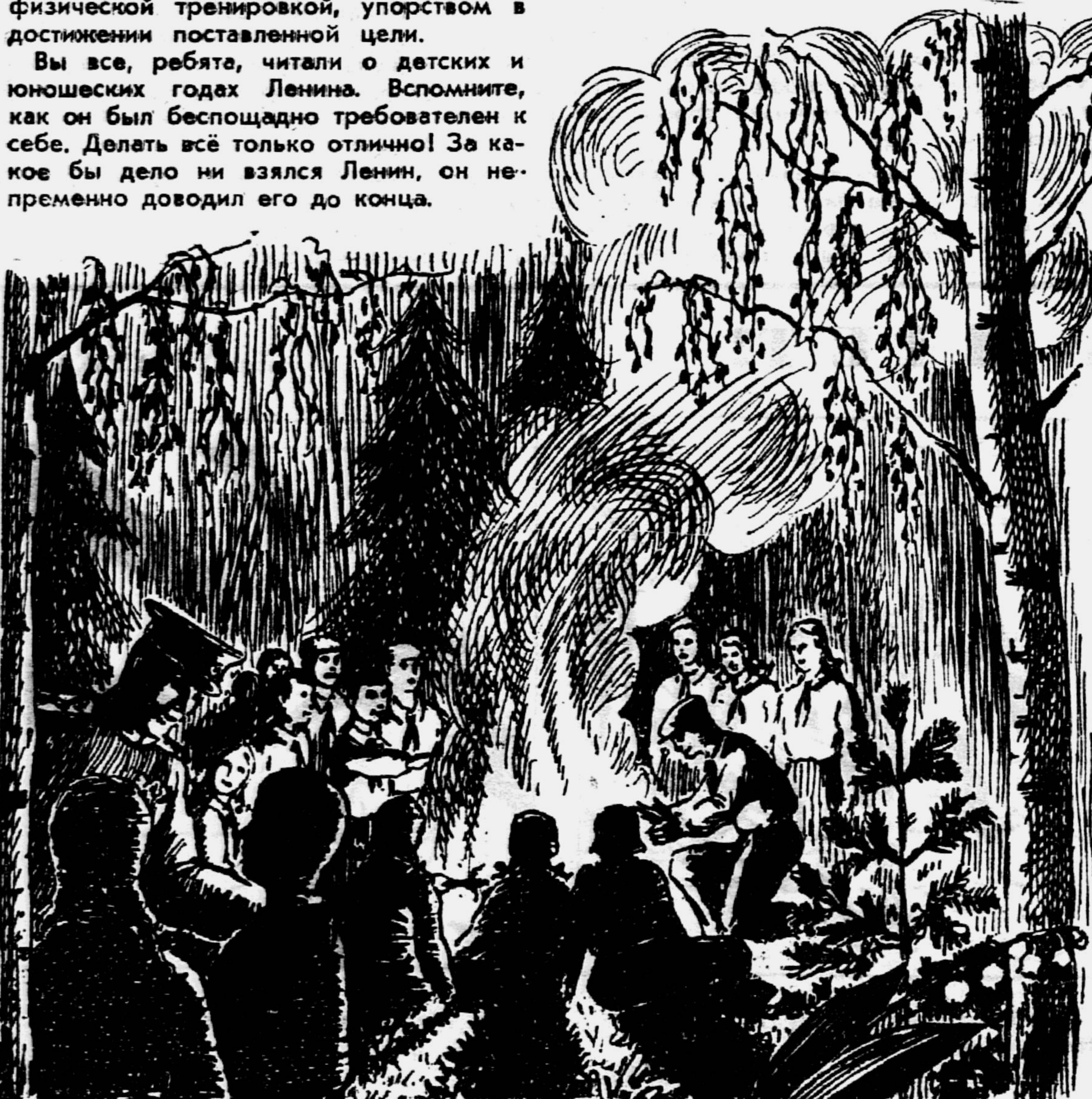
Рис. худ. Н. СМОЛЬЯНИНОВА.

Воспитывать в себе характер надо с детских лет. Как часто многие из вас бросают задачу нерешённой только потому, что она у вас не вышла сразу. Сколько ребят не занимается физкультурой лишь потому, что у них не хватает воли заставить себя раньше встать с постели и сделать зарядку. Я знаю: дел у каждого из вас много. Чтобы справиться с ними, необходимо соблюдать строгий режим, беречь время. А для этого надо уметь управлять своими желаниями.