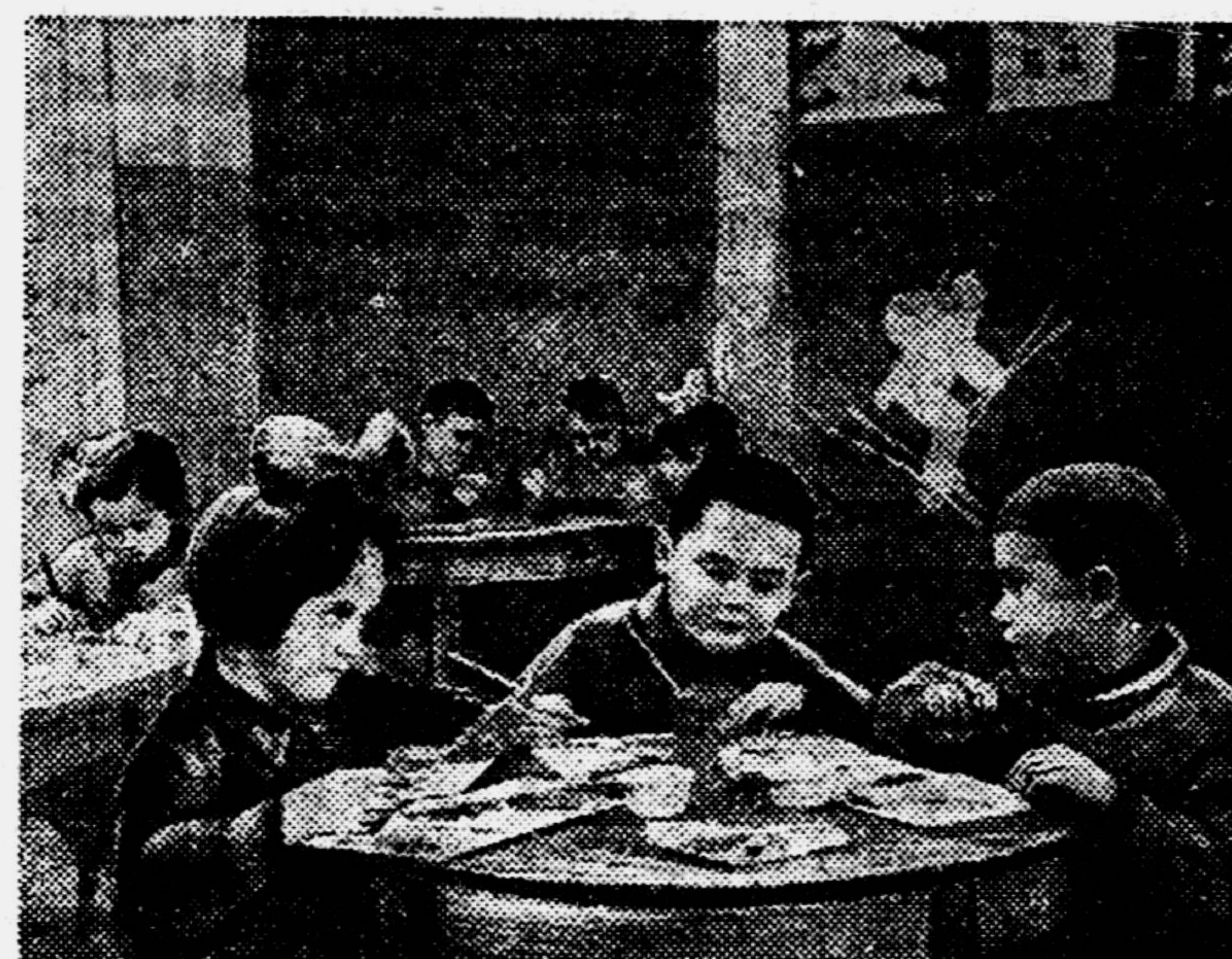
— Ничто не угрожает нам. Мы весело встречаем Первуюмай! (Детский сад № 20 в Октябрьском районе города Ленина).