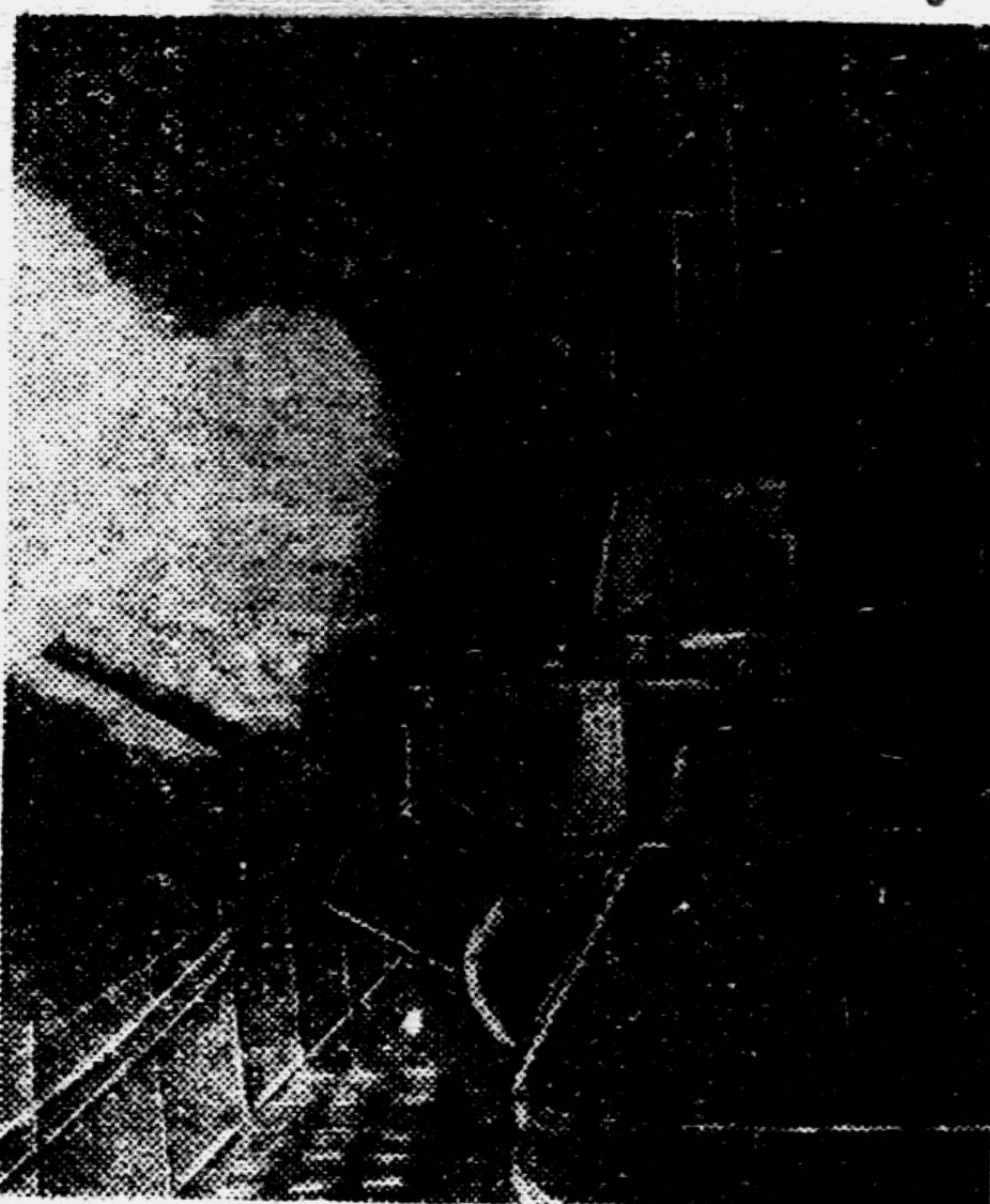
И днём и ночью моряки-черноморцы совершают дерзкие налёты на берега, занятые ещё немцами, разрушают их склады, уничтожают батареи. На снимке: бронекатер Черноморского флота ведёт огонь по врагу.

Попрыгунья-стрекоза зиму целую пропела, оглянуться не успела, как весна катит в глаза.