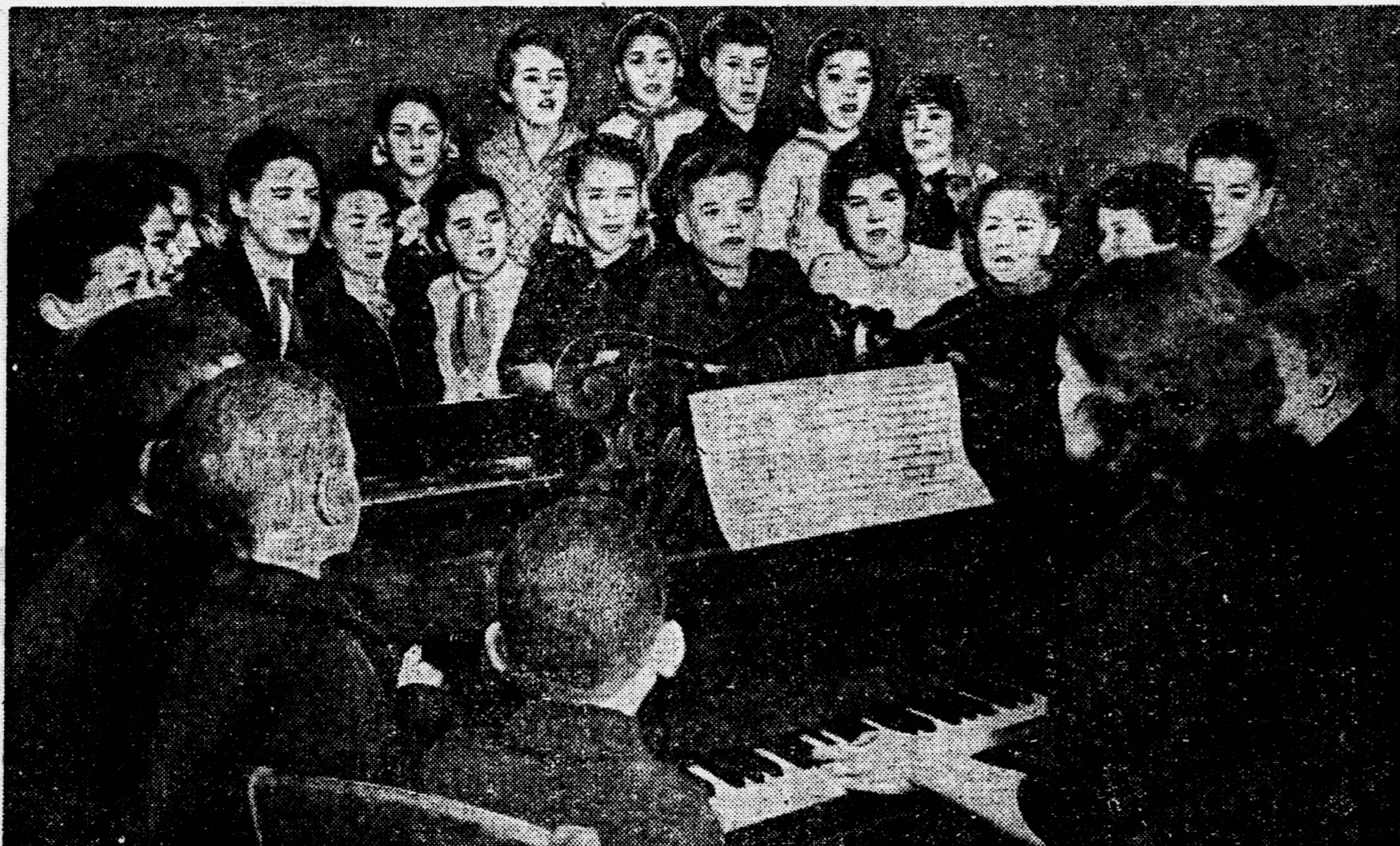
По вечерам в детдоме № 10 Куйбышевского района в Ленинграде собирается хор. Ребята разучивают гимн Советского Союза. Это их любимая песня.