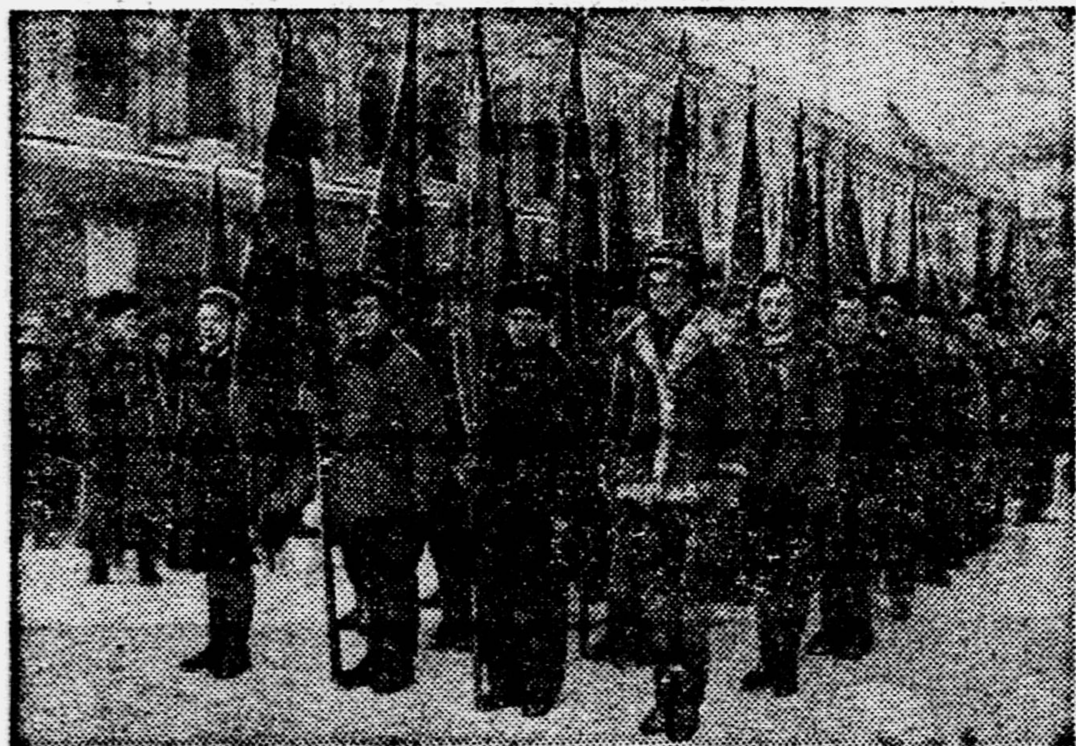
Ничто больше не угрожает пионерам Ленинграда. На днях в освобождённом от вражеской блокады городе состоялся первый парад пионеров. На снимке: колонна пионеров на улице России.