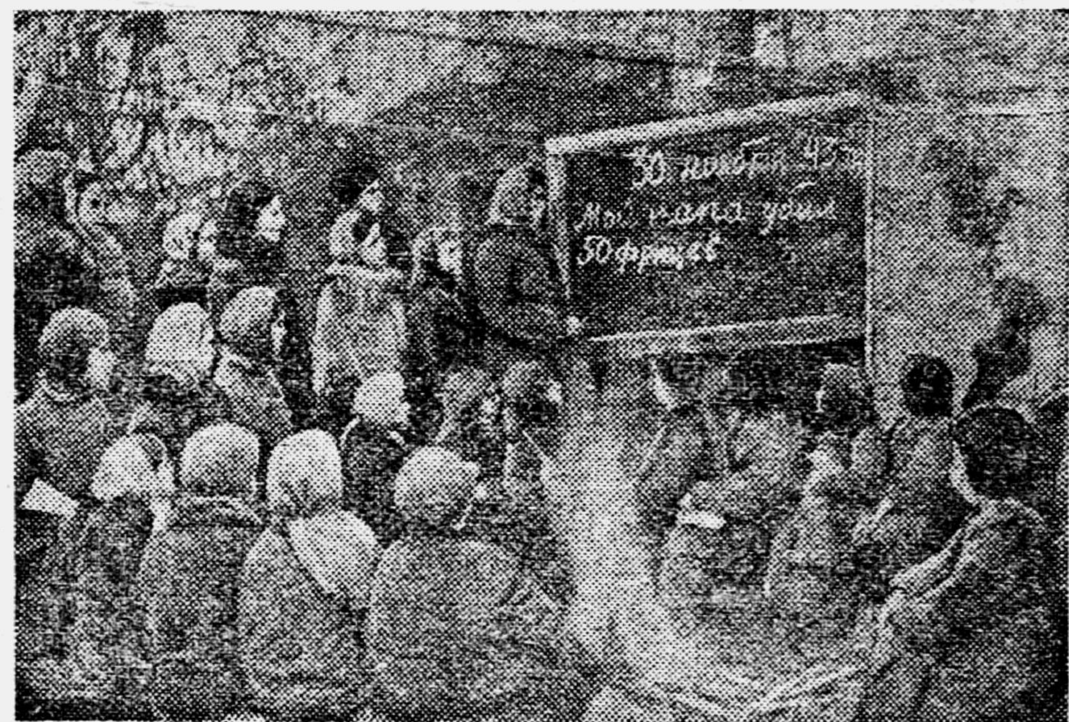
Это очень необычная школа. Её организовали белорусские партизаны отряда им. Калинина. Учатся в этой школе дети, которые вместе со своими семьями скрываются от немецких бандитов в лесах. Ребята стараются учиться как можно лучше. На снимке: на уроке русского языка.