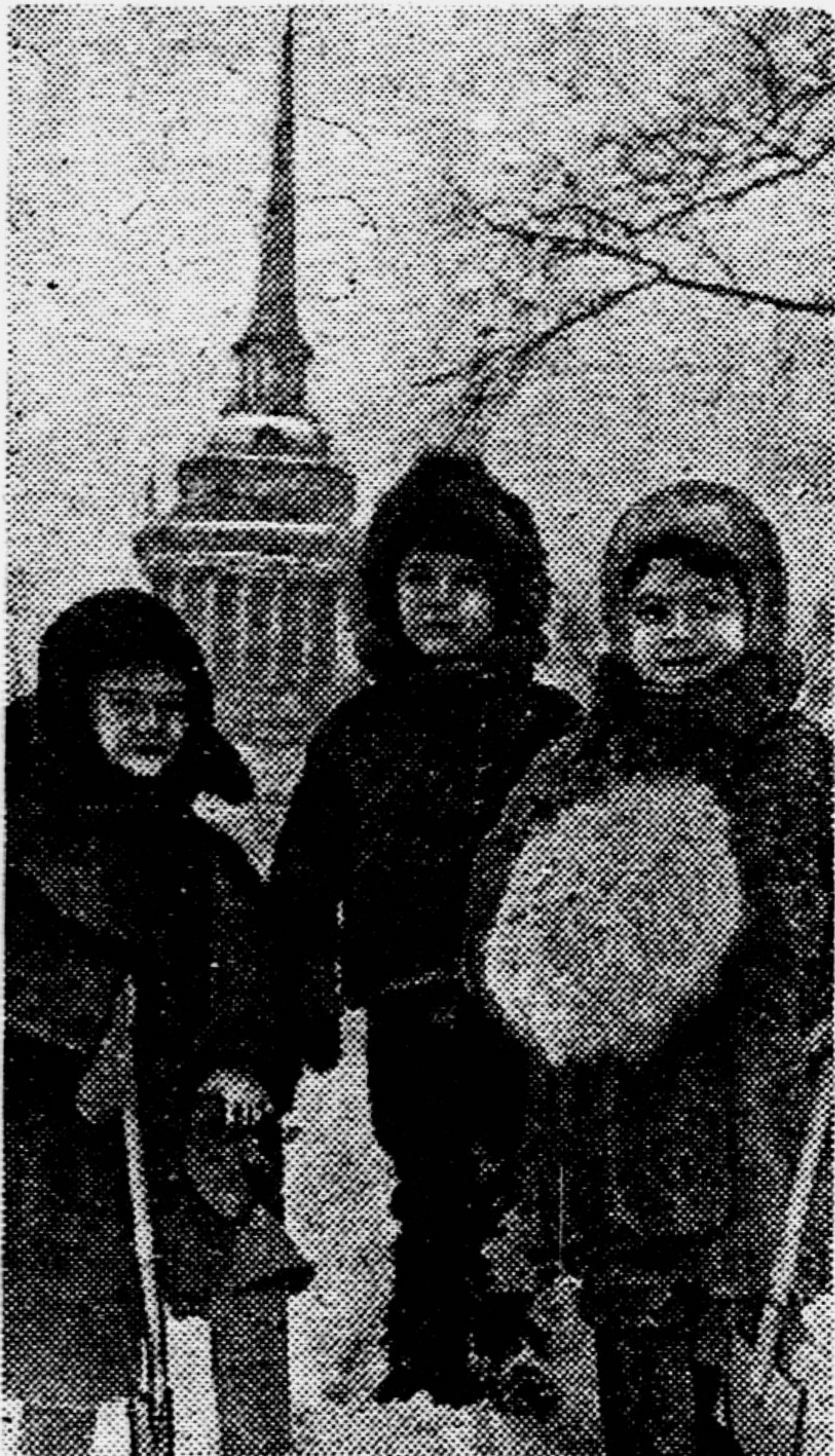
— Теперь нам ничто не угрожает!