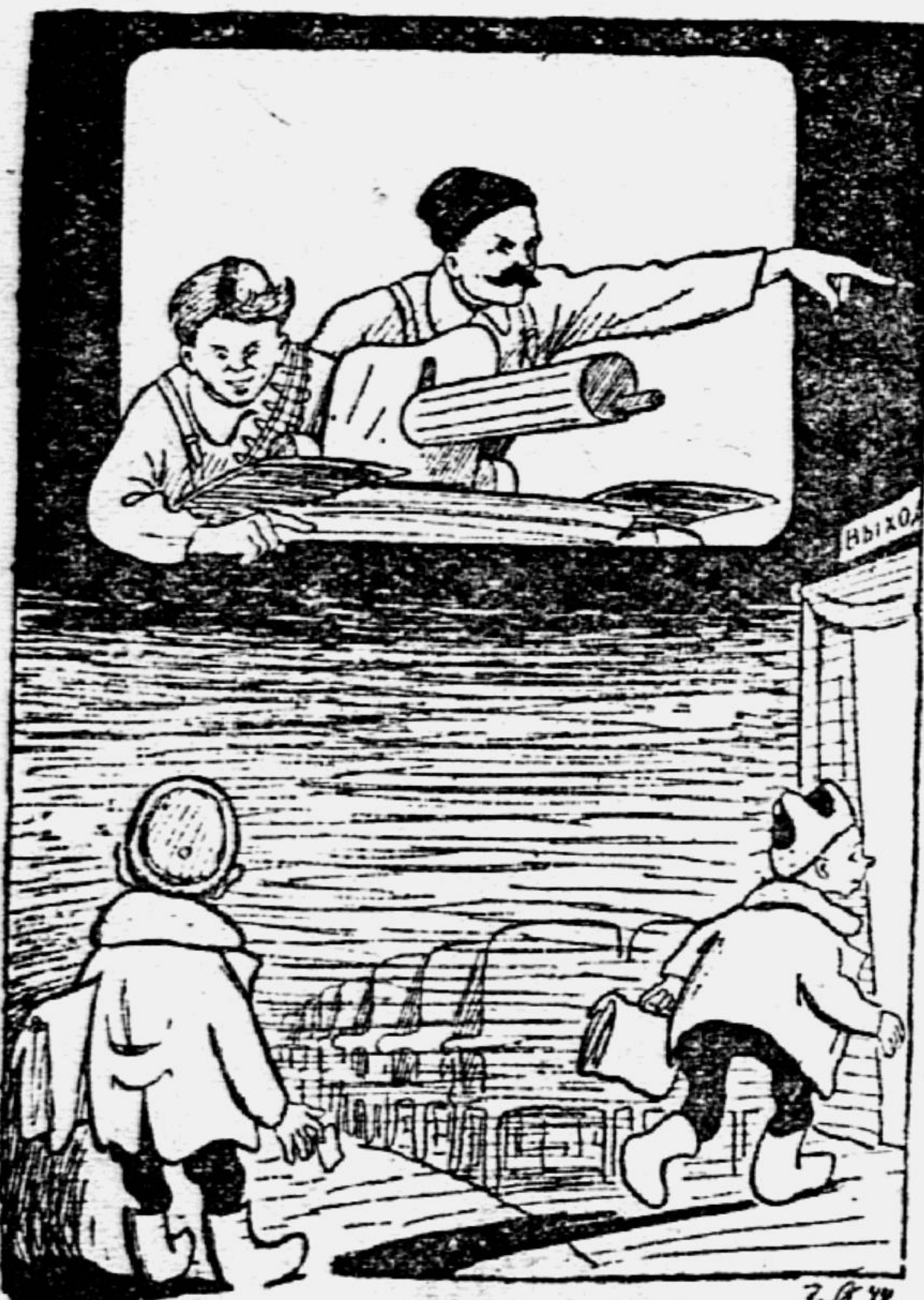
Рис. Г. ВАЛЬКА.

Голос с экрана: — Как же это вы, друзья, очутились в зрительном зале, когда в школе идут занятия? А ну-ка, марш на урок!