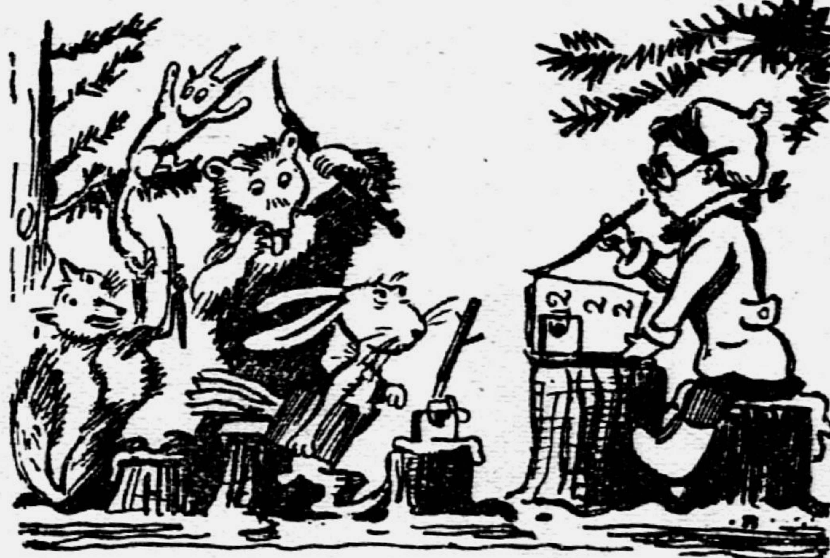
Рис. худ. В. ФРИДКИНА.