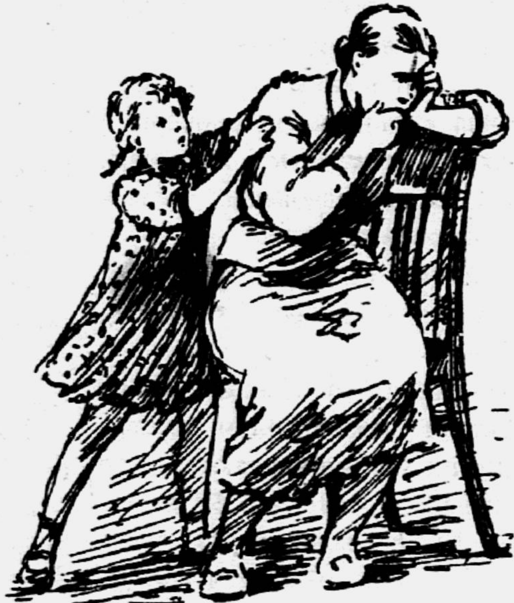
Девошка обнимает её, тербит и по-вторяет: «Мамочка, милая, перестань!»

— Мамочка, милая, перестань! Я тебя тоже люблю, ты же теперь моя настоящая мама.