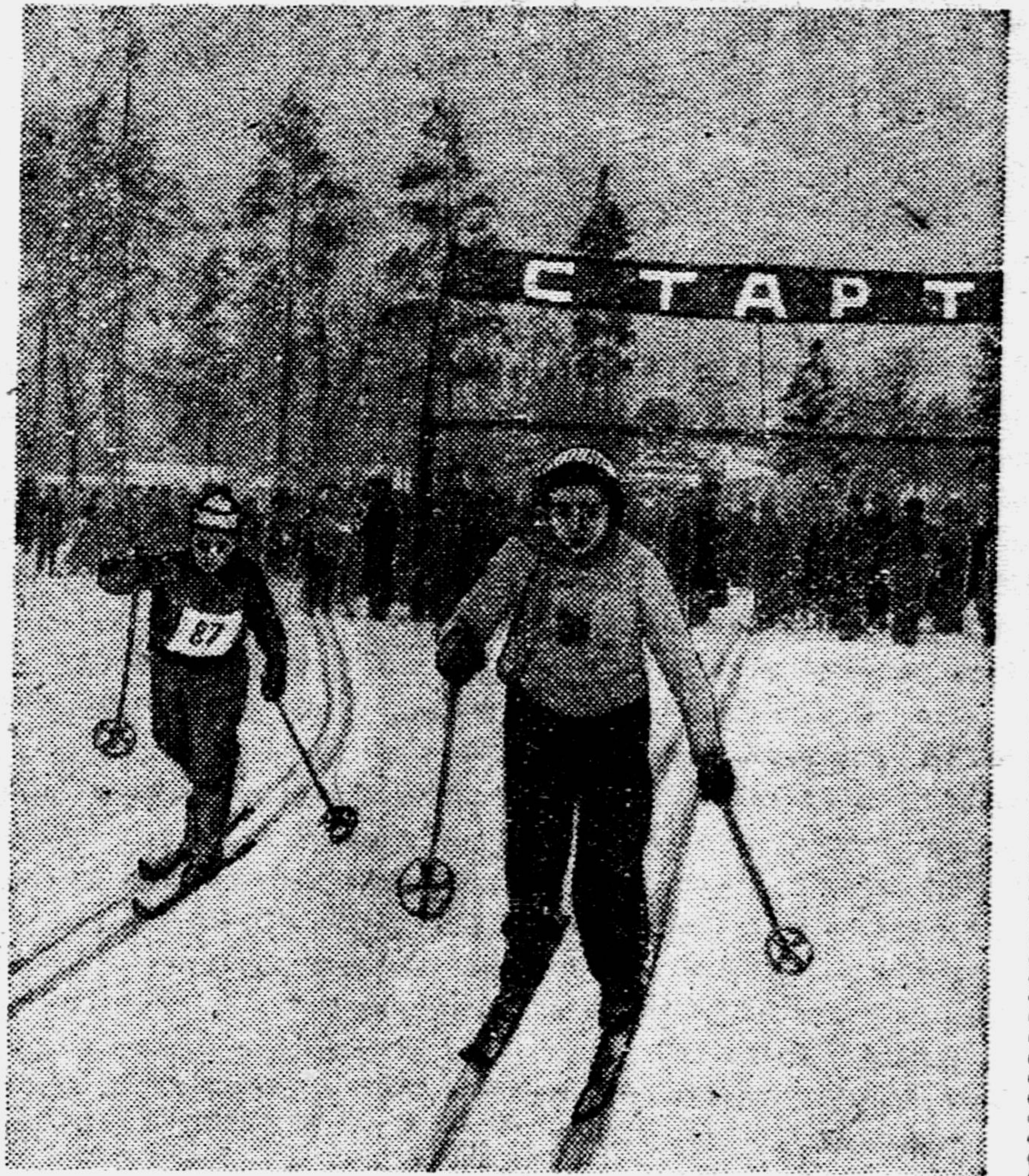
Старт дан! Традиционные соревнования московских лыжников общества «Смена» на приз «Пионерской правды» начались. О том, как они прошли, читайте на второй странице нашей газеты.