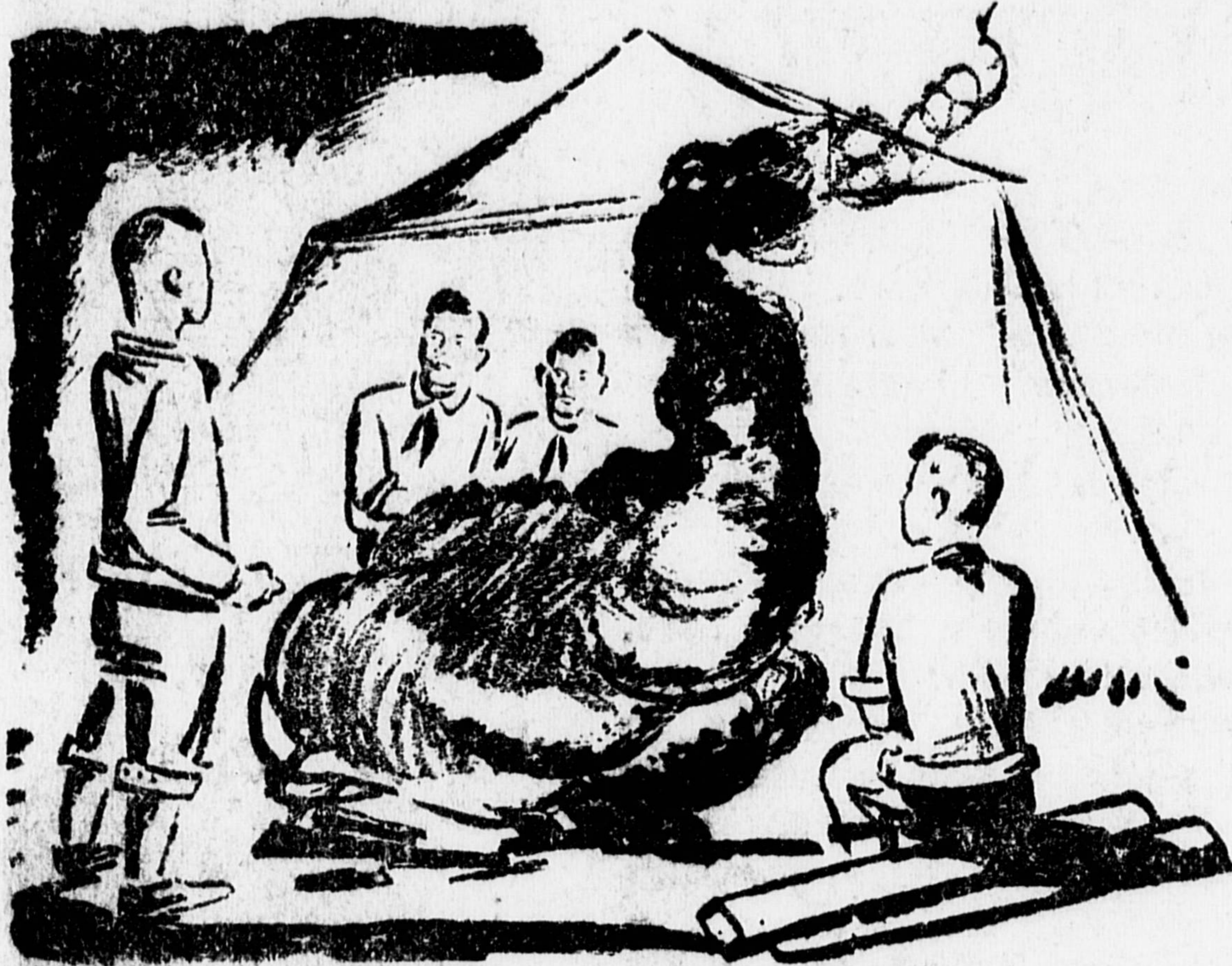
Он произнес горячую речь у костра.

Ребята подхватили слова песни, и все холмы и леса повторили веселый победный клич боевых рабочих детей.