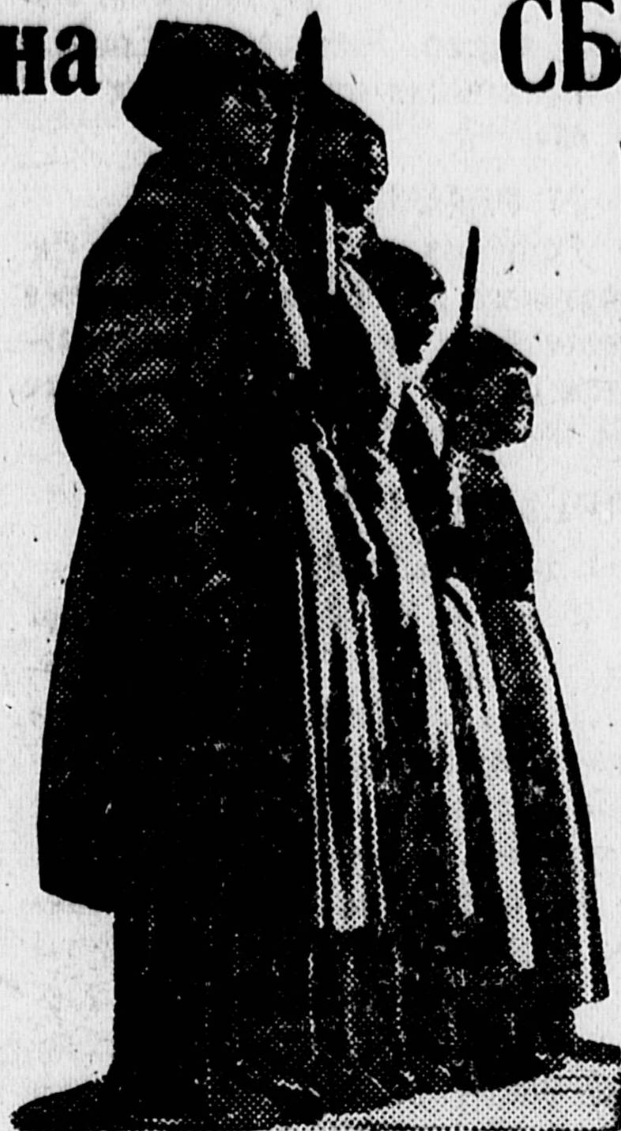
Изучим жизнь Красной армии. НА СНИМКЕ — красноармейцы в боевом строю.