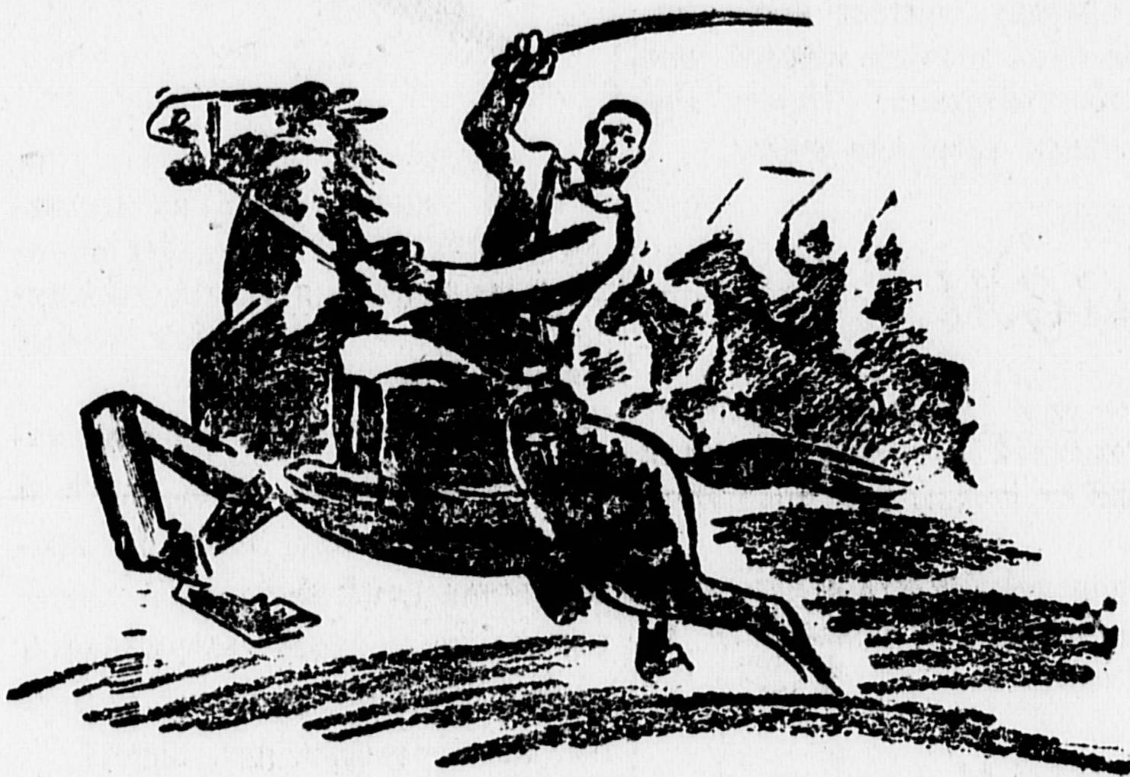
Неудержимой волной ринулись вперед.

★ В Москве с 10 апреля по 1 мая будет проходить детская музыкальная олимпиада. В ней примут участие все московские школы. Будут организованы конкурсы на лучший хор, оркестр, кружок самодеятельности и т. д. Премированные коллективы примут участие во всесоюзной детской олимпиаде, которая будет в Ленинграде.