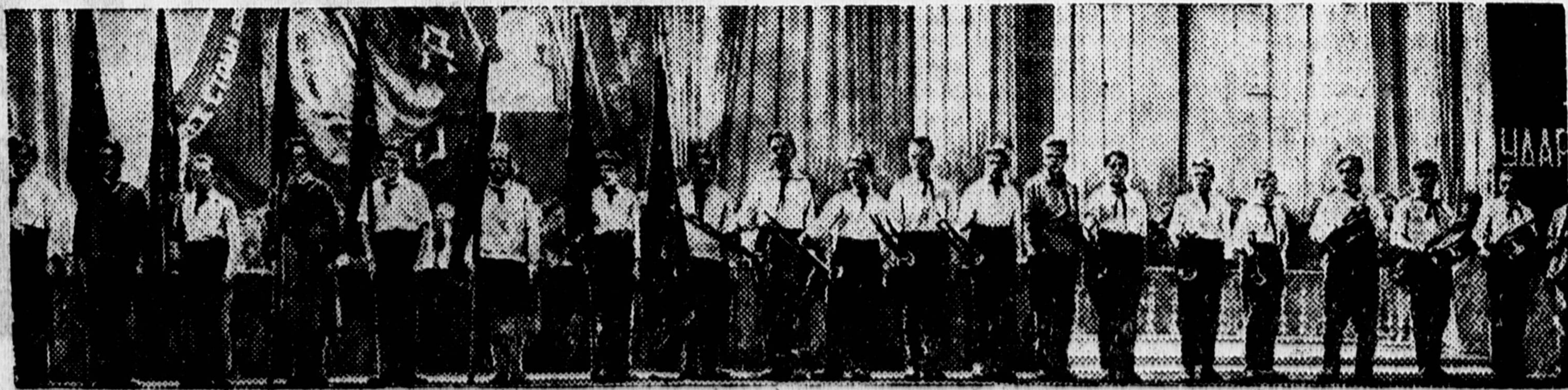
Делегация московских пионеров приветствует съезд колхозников-ударников.