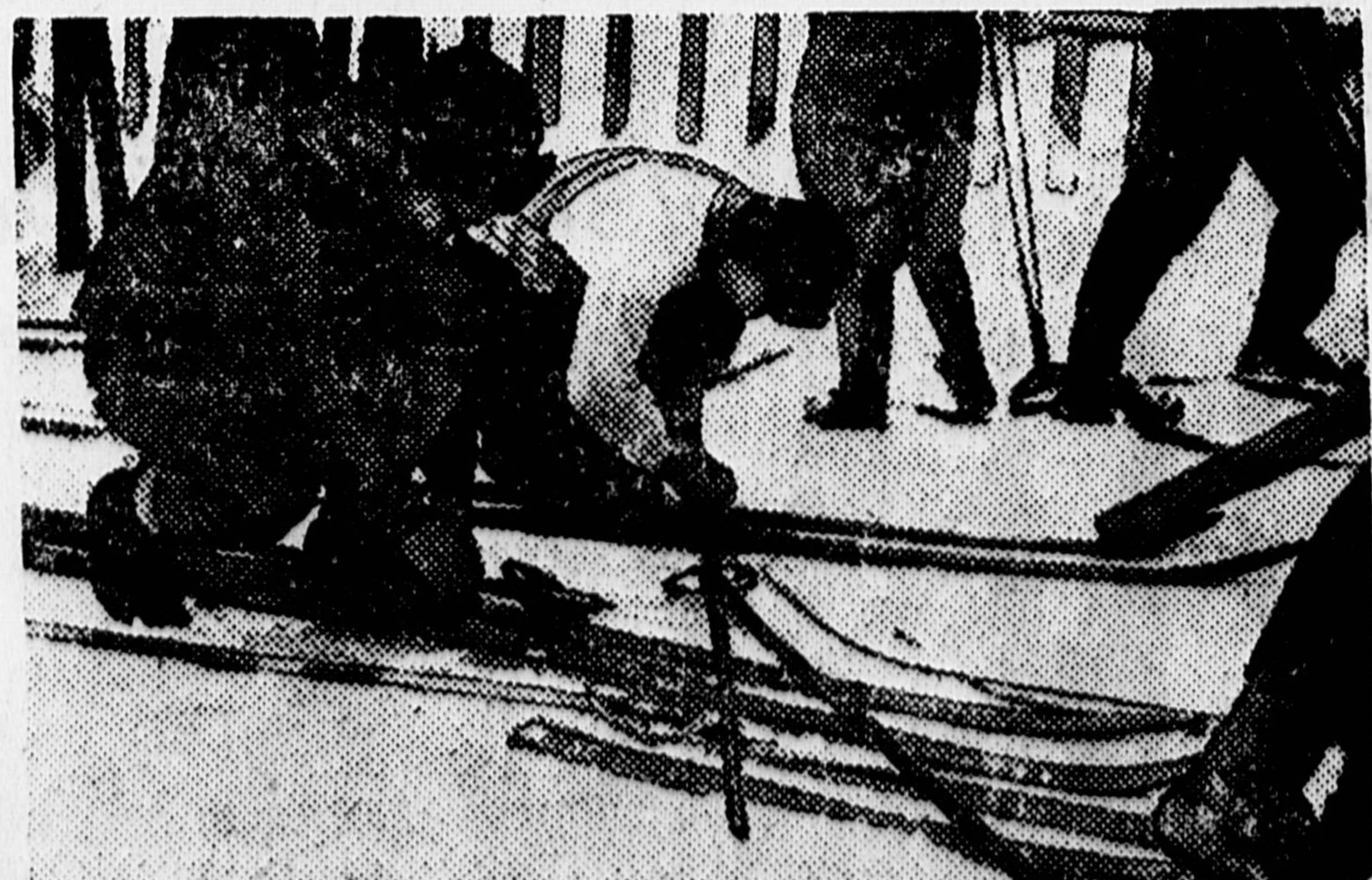
В СОКОЛЬНИЧЕСКОМ ПАРКЕ КУЛЬТУРЫ И ОТДЫХА. На снимке — пионеры немецкой школы в Москве перед выходом на лыжную вылазку проверяют свое снаряжение.