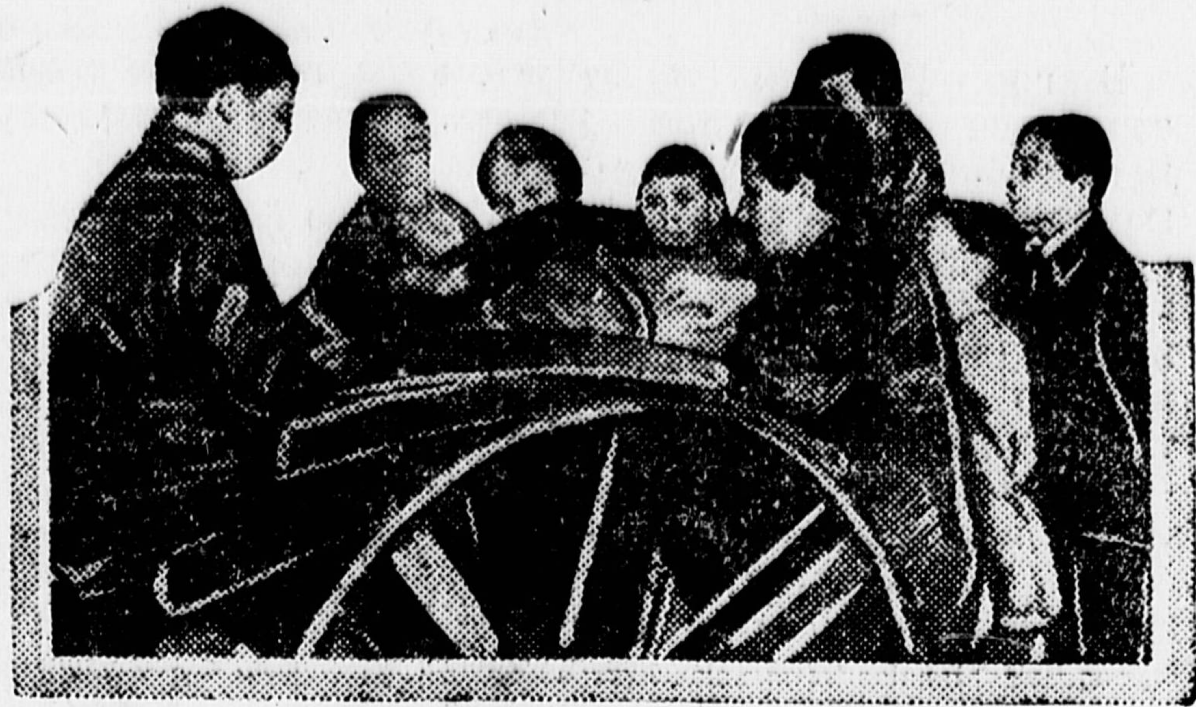
Экскурсия пионеров и школьников осматривает трактор в Политехническом музее.