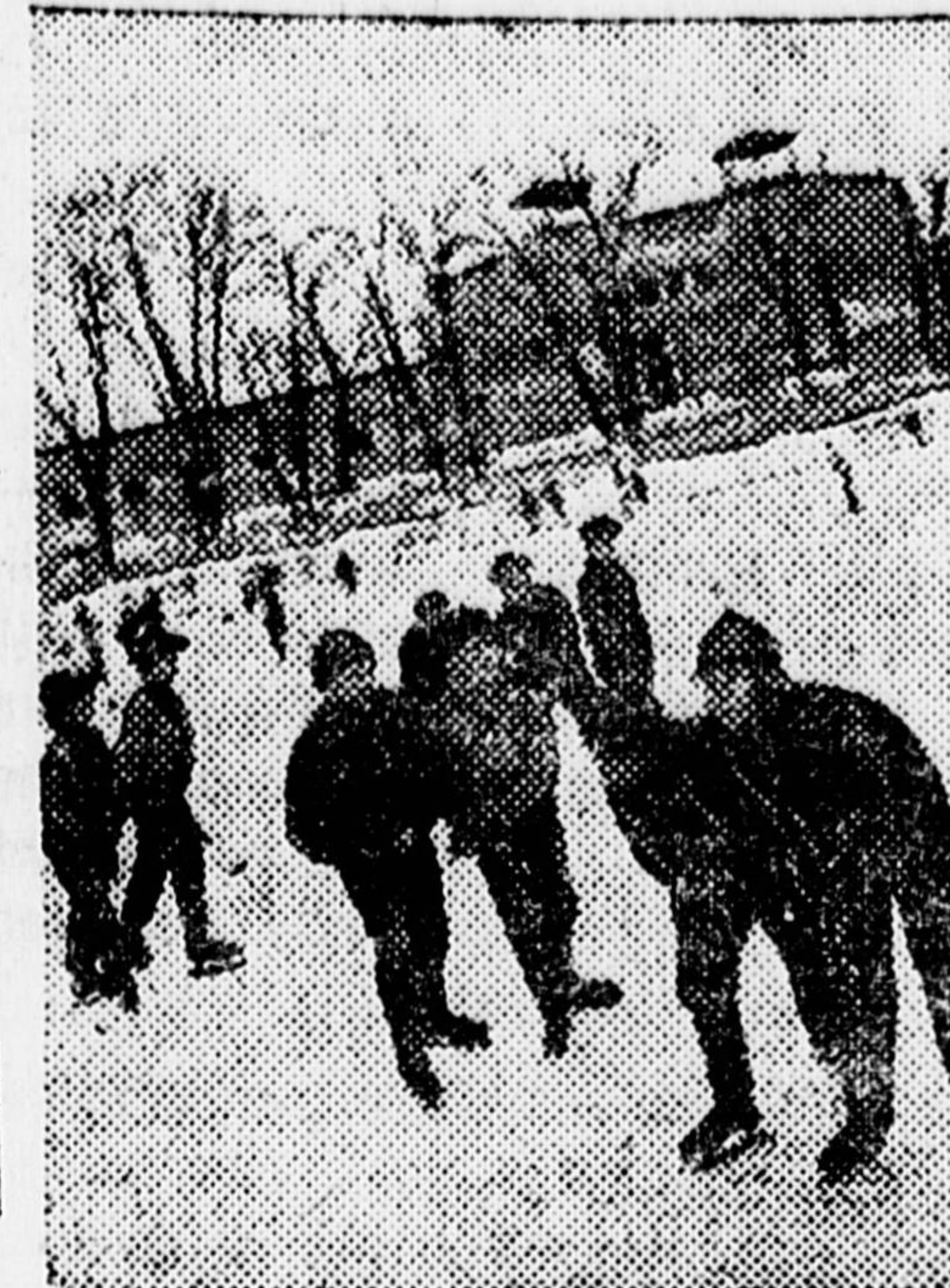
Каникулы в этом году проводились организованнее. НА СНИМКЕ — школьники на катке в Парке культуры и отдыха (Москва).