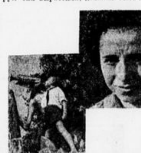
По мнению издательства Текинопечать, пионеры только и делают, что трубят в гори. Плохое у вас зрение, товарищи издатели.

«красивую» внешность нашей организации. Ребята и повзвлиценосная порода курицы, которую они вырастили, должны быть