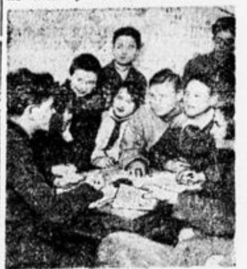
На конференции. Беседуют.

В нашей школе 221 школьник, из числа учащихся отставали в