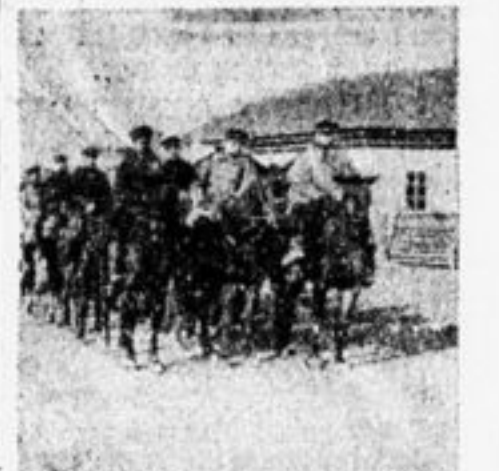
Кавалерийский разезд Особой Дальневосточной армии.

живших семидесяти. Если эти ребята не состоят на бирже, то они сами это дело оформят.