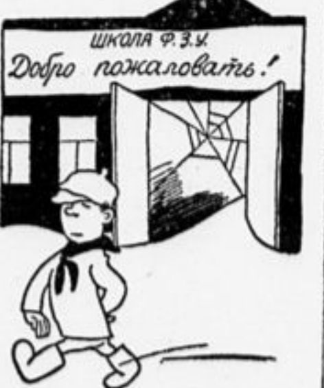
Знать не знаем, ведать не ведаем.

Правда» и «Комсомольская Правда» пишут одно, то мы на деле видим другое: точных директив мы