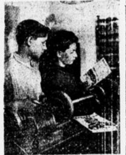
21-я трудовая школа в Харькове. Ученики на практических занятиях.

Козловский округ, Тамбовская губ., ст. Грязи, Маринский пос.