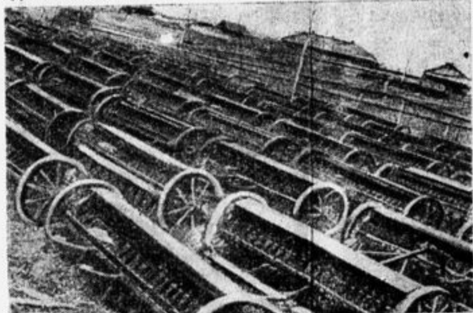
Тысячи машин превратят деревню в крупное сельскохозяйственное предприятие.

Василий взял в правую руку топор. Он с ненавистью взглянул на толпу людей, он бросил бы в них топор, лишь бы они ушли... Стараясь, чтобы рука не дрогнула, он поднес топор к запрыгавшему в глазах станку и спокойно принялся на себя первые искры вдруг вспыхнувшего камня. На