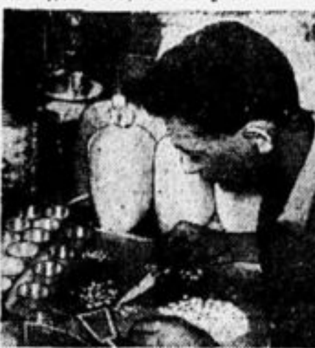
За сельскохозяйственными опытами.

Пионеры Ржаксинского района, Тамбовск. округа, прошедшим летом много сделали для поднятия урожайности. Пионеры отсортировали семена и протравили формалином для того, чтобы убить голов-