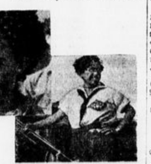
назначаться не для альбома, а должна быть плакатом, зовущим на работу.