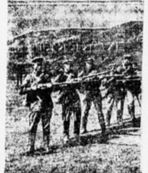
ОДВА на учебе.