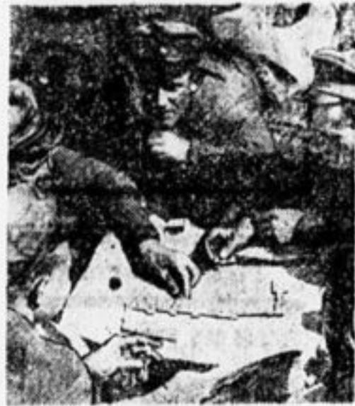
ОДВА на досуге.

ребята гор. Вычегры (941), школа II ст. Ишима (617); Буланская школа (309); 6, 3, 4, 5 школы гор.