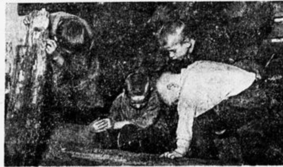
Дети в общежитии Трехгорной мануфактуры. На кухне.

Общее собрание призывает всех рабочих Трехгорки, всех жильцов спальни, всю советскую общественность на решительную борьбу со старым прохоровским бытом.