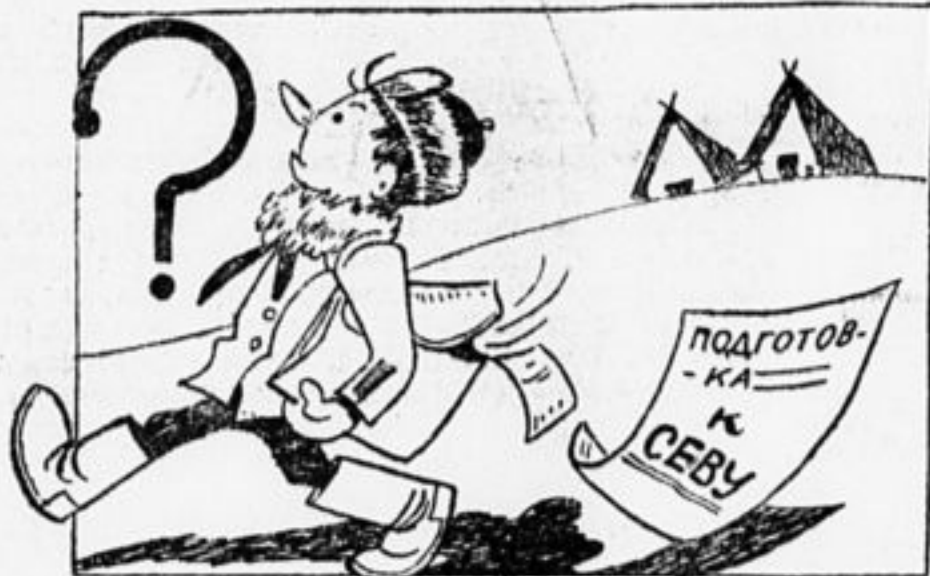
Рассеянный Сеня гулял размышлял. О севе весеннем размышлял гуляя.