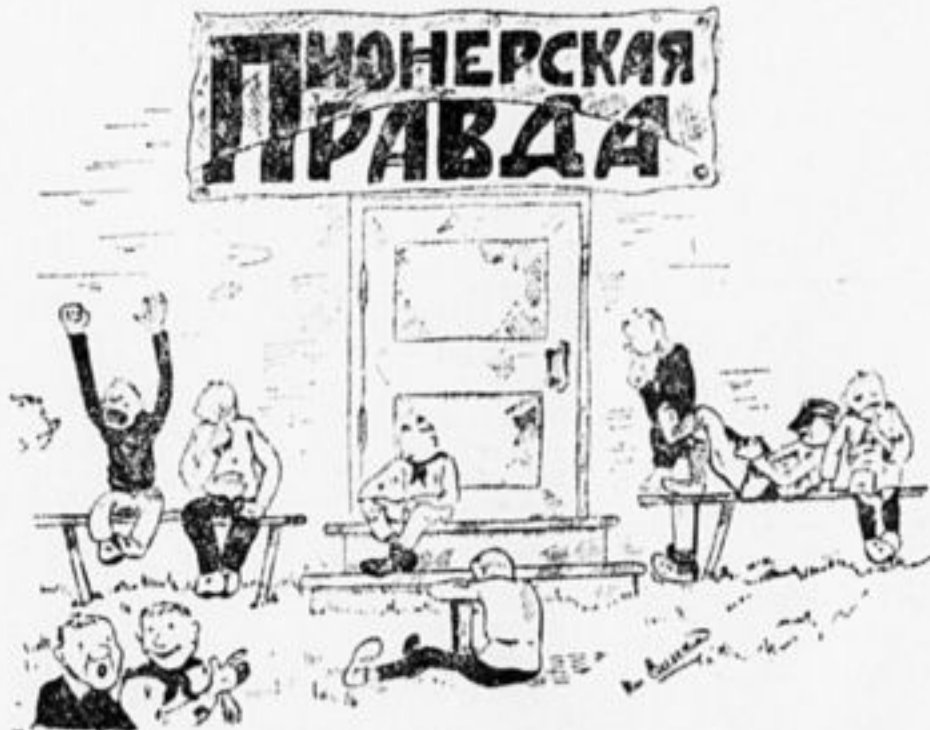
— Скоро ли литстраница-то выйдет? Сколько времени ждем!