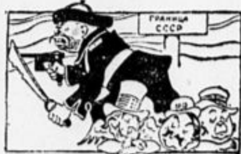
Рис. Б. Ефимова.