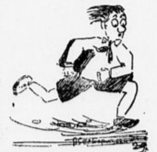
...подписаться на декабрь на «Пионерскую Правду».