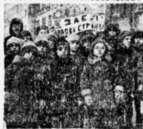
Ребята детсада «Смена» принесли в «П. П.» деньги на помощь ребятам Китая.

Детская конференция обратилась ко всем детям берлинских рабочих с воззванием избрать уполномоченных для руководства борьбой против фашизма и социал-фашизма (меньшевистского фашизма) в школах.