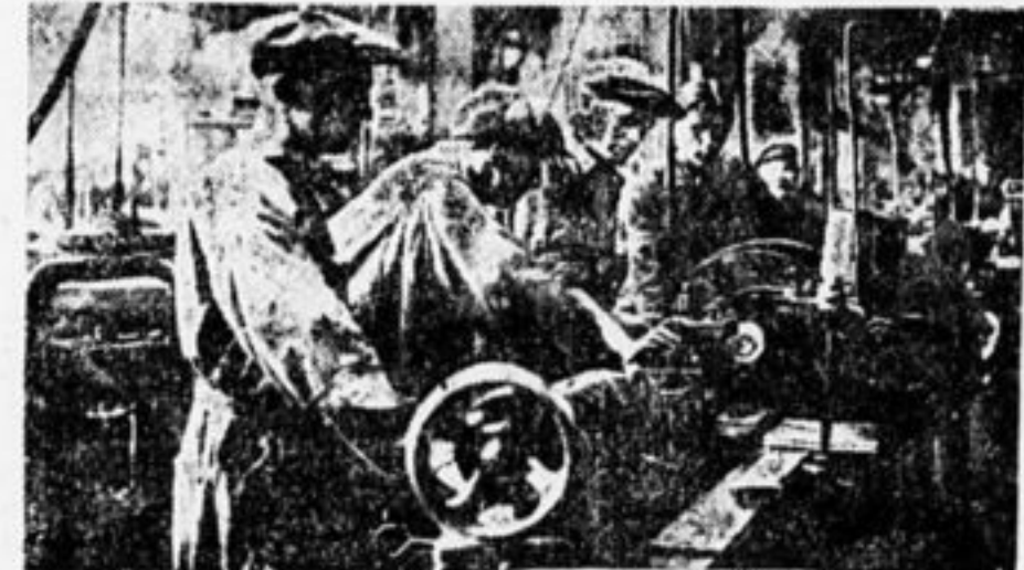
Ни минуты простоя. Бригада тракторного цеха завода «Красный Путиловец».

Ударная бригада на «Котлоаппарате», как и все бригады: нет у нее ни брака, ни простоев. Есть снисходительное отношение и много ярких примеров самоотверженности: например, большие ударники, которым врачи запрещали работать, следовали ходили на завод.