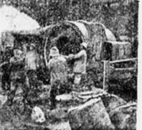
Бригадники за работой. (Днепропетровск).