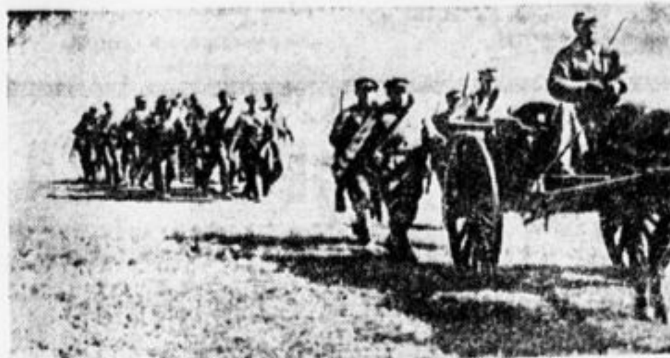
Красноармейцы ОДВА в походе.

Всего по 5 декабря собрано 95.714 подписей.