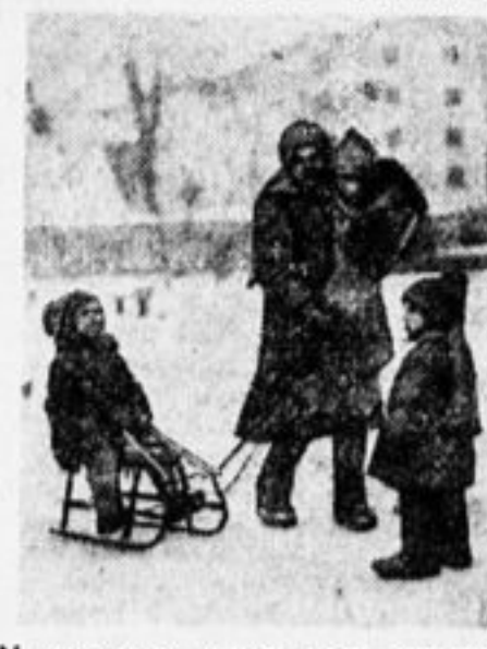
У нас есть няня, нам хорошо...

Сейчас управдомы протерли глаза и видят: ребят-то ведь обошли... Мечутся управдомы.