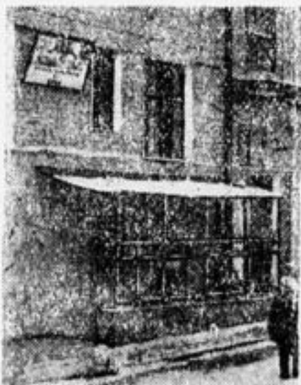
По воле инженера клуб загнан в подвал.

В Харькове и в Ленинграде, Москве, Днепропетровске, Баку—во всех промышленных центрах нашего Союза вырастают корпуса