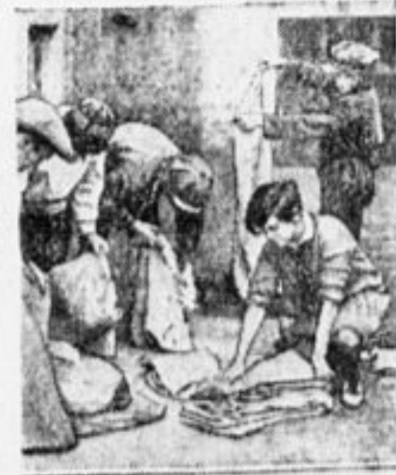
Пионеры за подсчетом собраных мешков.

По отрядам ведется усиленная агитация за «Пионерскую Правду». Поставлена задача — распро-