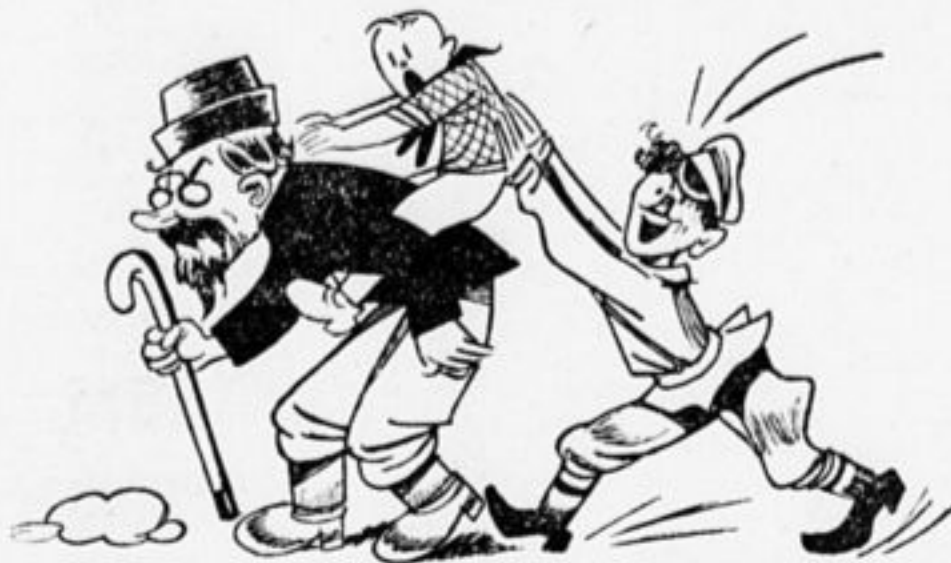
Каждый помочь отряду рад. И, наконец, ура, победа!

Курсы показали, что комсомольская организация Серпуховского округа не интересуется своей сменой и что решения комсомола о выдвижении на пионерскую работу лучших комсомольцев забыты. Надобно об этом напомнить.