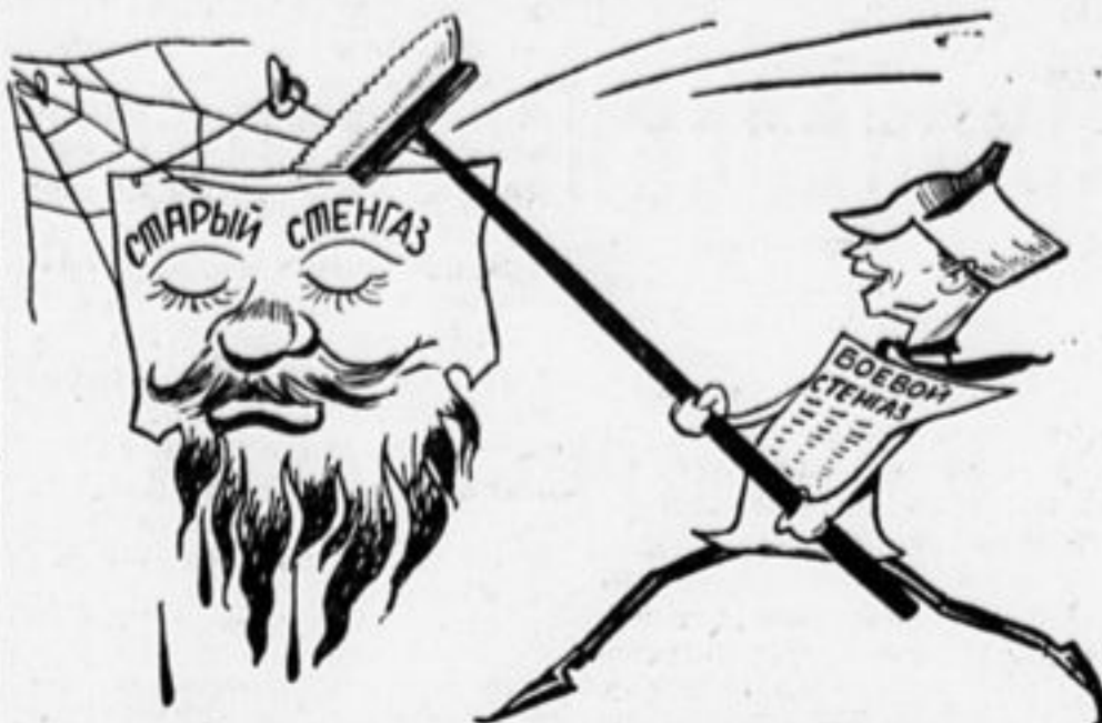
— Нечего грязь разводить здесь! Дай место новой стенгазете.

Подписная плата на 1929 г.: На 1 месяц — 20 коп., на 3 мес. — 60 коп., на 6 мес. — 1 р. 20 коп., на 12 мес. — 2 р. 40 к.