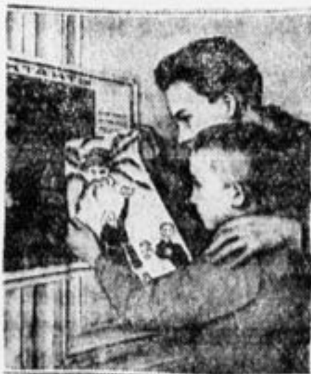
В антирелигиозном уголке.

Нужна помощь и прежде всего помощь от комсомола. Но комсомольские ячейки не руководят пионерской организацией, не интересуются ее работой. Неделю назад закончили курсы вожатых. Окружком комсомола за день до открытия курсов звонил по райкомам и требовал, чтобы через день были присланы комсомольцы в Серпухов. Кого выбрать, на сколько дней — никаких разъяснений.