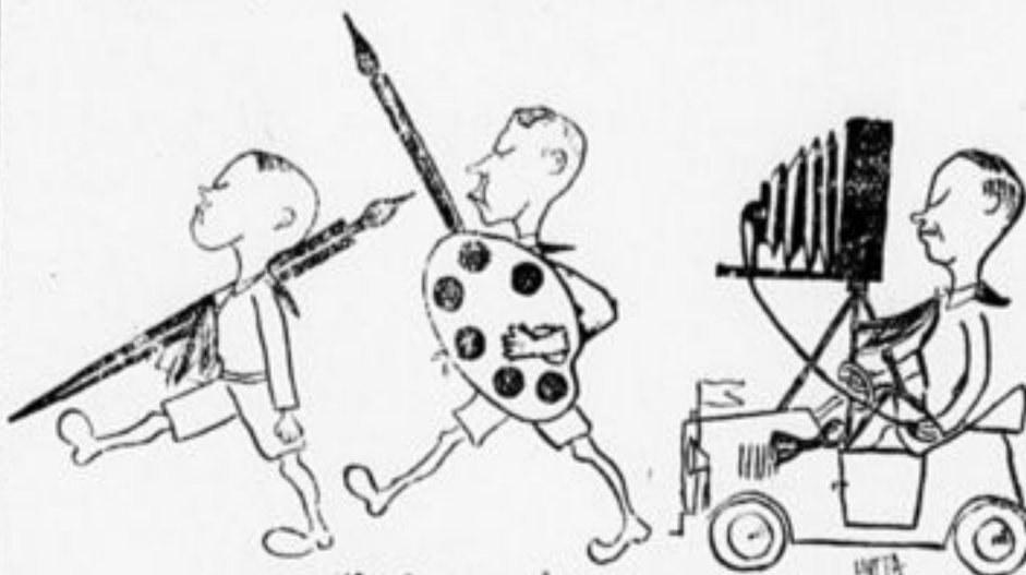
Бойцы «Пионерской Правды» в походе.