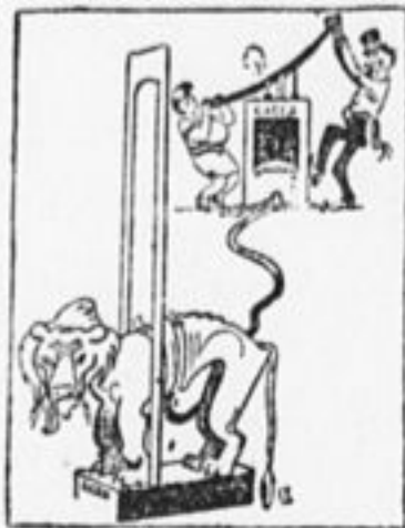
Английский лев чихнет не по дням, а по часам. Из него монету тняет Американский дядя Сам.

Принимая все меры к тому, чтобы со стороны советских частей не было перехода границы даже в отдельных случаях, советское правительство считает, что китайские власти должны разоружить отряды белогвардейцев и предупредить все и всякие налеты на советскую территорию со стороны китайских частей. В противном случае дальнейшие осложнения, вызванные новыми нападениями на советскую территорию, будут лежать целиком на ответственности нанкинского и мукденского правительств.