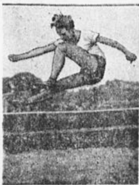
На всесоюзной пионерской спартакиаде.

ГЕЛЬФАНД (Москва). Пионеры плохо знают пятилетку. Надо ее изучать в каждой отряде. МОСКОВСКАЯ ОБЛАСТЬ ВЫЗЫВАЕТ ЛЕНИНГРАДСКУЮ НА СОРЕВНОВАНИЕ ПО ЛУЧШЕМУ УЧАСТИЮ В СОЦИАЛИСТИЧЕСКОМ СТРОИТЕЛЬСТВЕ. Все делегации должны заключить такие договоры. Наша школа еще не стала трудовой советской школой. Надо ее приблизить к производству. Очень часто на форпост раскачивает школу, а учком—форпост. Пионеры должны быть толкачами школы. Надо больше внимания обращать на военизацию и физкультуру.