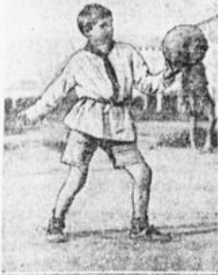
На всесоюзной спартакиаде.

дом последовала волна беспощадной, жестокой критики.