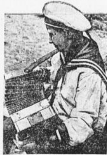
На показе художественной работы.

«Слабо работала киносекция. Участвовали в ней только мо-