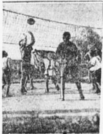
На всесоюзной спартакиаде.

А старые калоши? Путем переработки их «воскрешают», и