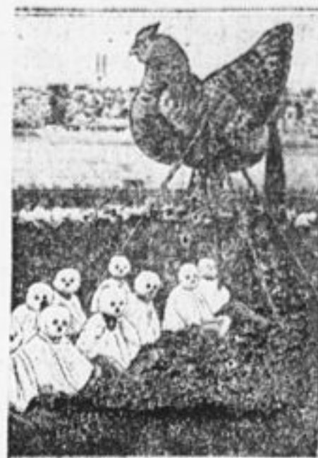
Украина на карнавале: Дорогу курице.

СОСТОЯЛОСЬ 18 СОВЕЩАНИЙ ДЕЛЕГАТОВ СЛЕТА С НАРКОМАТАМИ И ОБЩЕСТВЕННЫМИ ОРГАНИЗАЦИЯМИ, КОТОРЫМ ПИОНЕРЫ ПРЕД'ЯВИЛИ СВОИ ТРЕБОВАНИЯ.