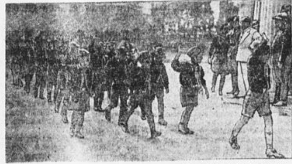
Муссолини принимает парад фашистской детской организации «Балила».

После речи представителя короля раздался лай: «Гау, гау, гау». Словом, оказалось, что скауты членораздельно говорят ле умеют. Да это им и не нужно. Не для этого готовят их капиталисты. Когда английские комсомольцы пытались распространить среди скаутов коммунистические листовки, немедленно же псы капиталистов окружили комсомольцев, на место действия явились полицейские и потащили комсомольцев в участок. «200 рублей штрафа»—был приговор судьи. Щенят хорошо охраняют. Английских комсомольцев арестовывают, но полиция благо-