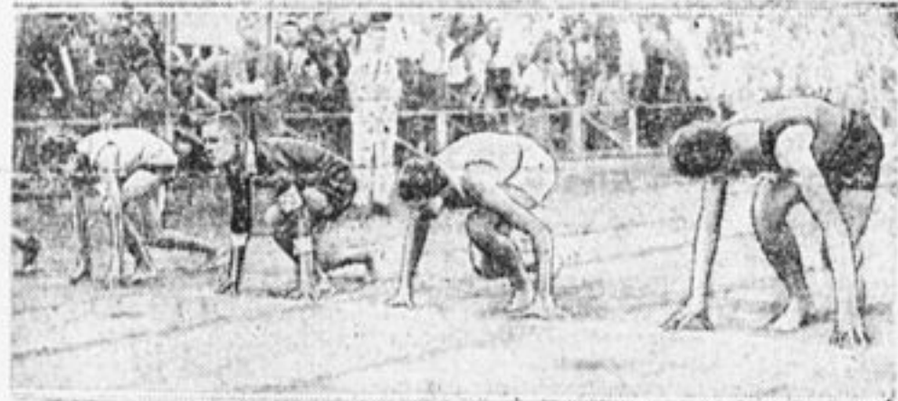
На всесоюзной пионерской спартакиаде.

Центр нашей работы—пятилетний план великих работ. Батрачата, няньки, кустарята требуют защиты пионеров. Слушай, Сибирь! У вас работают 30.000 ребят. Слушай, ЦЧО! У вас работают 35.000 батрачат. Не допустить их эксплуатации—боевой лозунг. Дальше идет школа. Мы в ней зачастую работаем спустя рукава. Школа должна стать основной базой нашей работы. Долой второегодичество, с'едающее ежегодно 40 миллионов руб., или 8 заводов. Внешкольная работа,—дорога, по которой к нам придут неоргани-