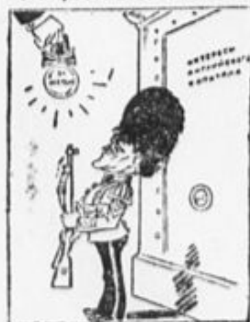
«Рабочая» партия в Британии «Рабочие» партий прочих. Охраняет с усердием и старанием Капитал от рабочих.