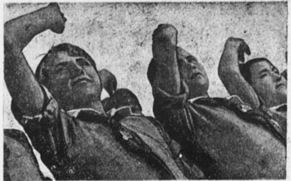
К борьбе за рабочее дело—всегда готовы!

10. С 22 часов — грандиозный фейерверк на реке Москве.