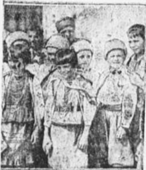
Группа украинских делегатов.

гинец «Кинто». Зал помогает хлопками, одобрителными криками. Замечательный у закавказцев шумовой оркестр. Вот уж подлинно победили бедность изобретательностью. Вместо барабана бочка. Тут и бутылки, и трезвон, и гребешки — что хотите. И, главное,