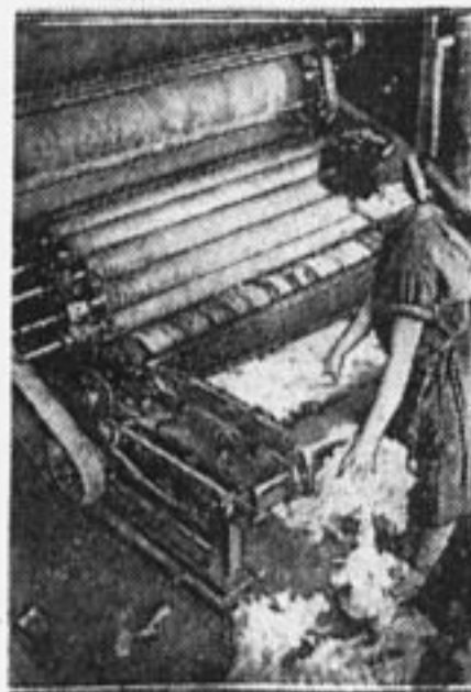
Новая машина по очистке грубой шерсти овец и превращении ее в тонкую, изобретенная в СССР.