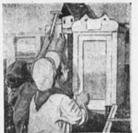
Пионеры еврейской колонии в Малаховке готовятся к слету.

вети коллективные заявления с требованием закрыть церкви и отдать их под пионерские клубы.