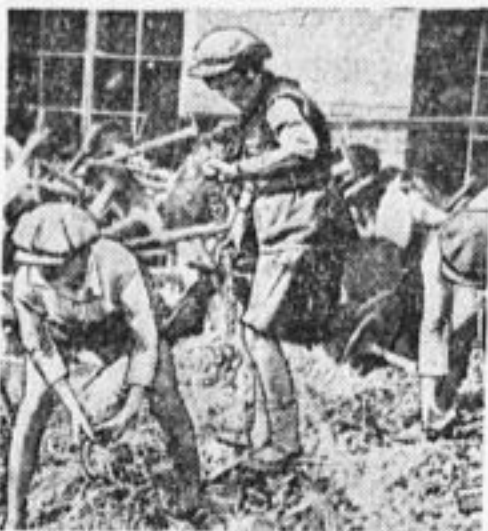
Пионеры «Красного Путиловца» работают в день индустриализации.

Пионеры 47 базы об'ехали 3 завода—«Красную Зарю», «Красную Нить», зав. им. К. Маркса.