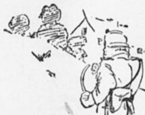
ПОЛИЦЕЙСКИЙ: Ого! Тайное собрание коммунистов! Я им покажу!..