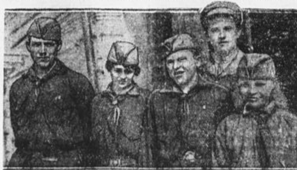
Шведские пионеры на слете в Вологде.