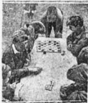
Свободный час в лагере базы Нарпит (Москва).