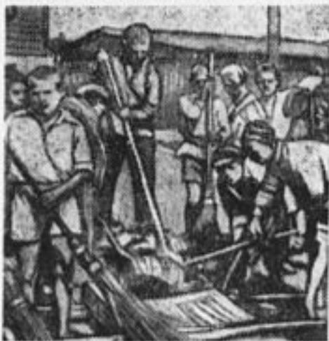
109 отряд при Хлебниковской фабрике, Московск. обл., на субботнике в день индустриализации