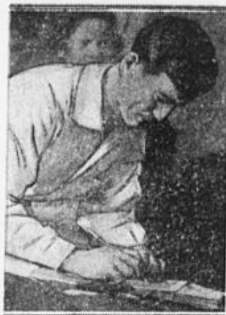
Подписание договора с общественностью на слете Баумановского р.

35-й отряд при ОГПУ организовал в селе Чембурил, Черноморского округа, клуб-читальню, снаб-