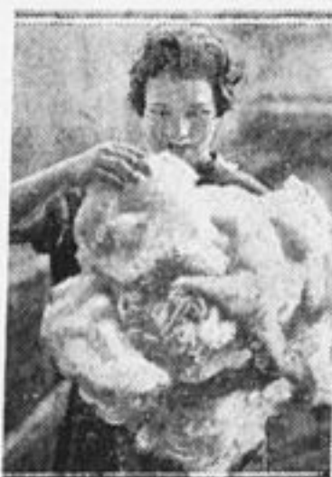
Раньше из грубой шерсти овец делали дерюгу. Теперь изобретена машина, которая превращает грубую шерсть в тонкую...