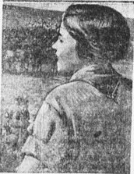
На смычке с Красной армией.

Тридцать машин исколесили 12 августа Ленинград вдоль и поперек. В художественной форме трудящиеся Ленинграда узнали, что 13 августа, в 7 ч. веч., на