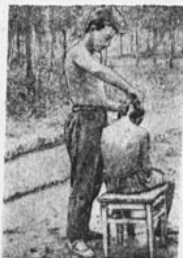
В Малаховской еврейской колонии (Моск. обл.) стригут делегата на слет.

Секция по работе с октябрятами краснопресненского районного слета.