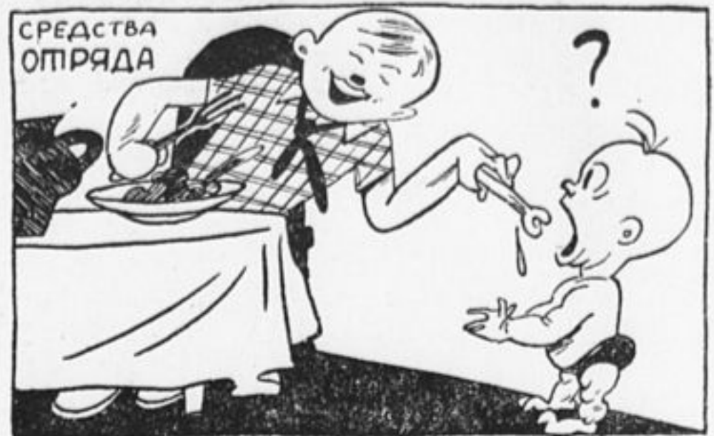
ОКТАБРЕНОК: Не всякие остатки сладки.