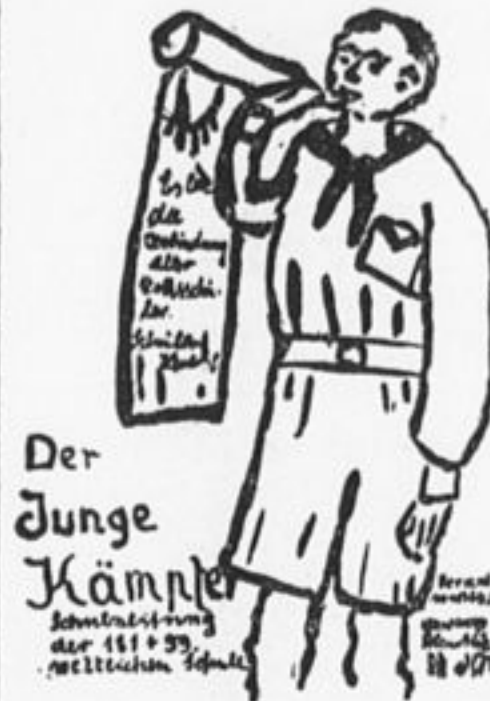
Обложка газеты «Юный Борец» школьной ячейки пионеров №№ 181 и 59 г. Берлина.

Еще за два часа до парада прилегающие к стадиону строительные улицы были запружены широкими колоннами пионеров. Мелькают плакаты о книгах, спускают с лентами через плечо маленькие продавщицы книжек Госиздата.