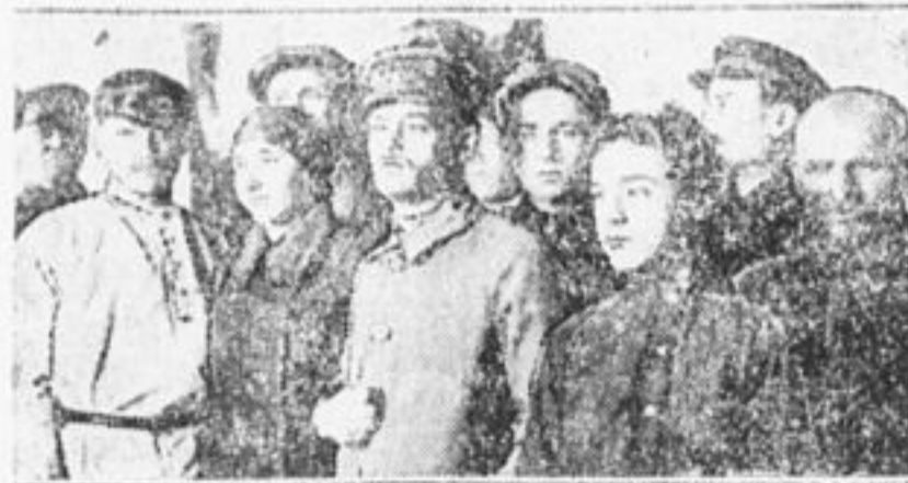
Рабочие з-да «Сепаратор» заслушивают договор.

Ставьте на рабочих собраниях отчеты о работе по хозяйственному походу