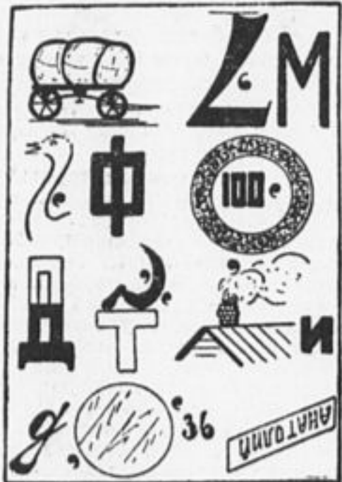
ХУДОЖЕСТВЕННАЯ ЗАДАЧА № 183.