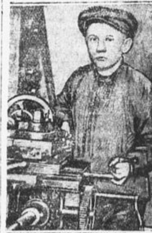
На заводе «Леуна» в Германии подростки 12—15 лет работают по 9 часов и получают лишь половину заработной платы взрослых рабочих.

Сокольники первые приглашают на свой парад, который будет 26 мая, делегации из других районов. Кто последует этому примеру?