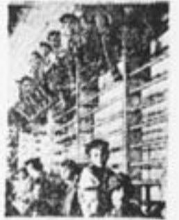
На собрании в Перми.