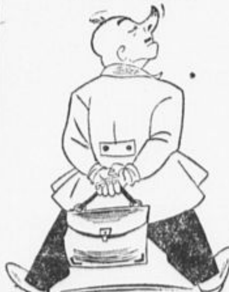
Директор Лысьвенского завода, отказавшийся обсудить договор пионеров.