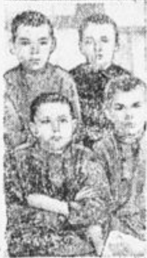
Эти ребята завербовали 19 крестьян для опытов по вымочке семян.

Меня на собрании выбрали ребята, чтобы я снимал и писал в газету, как мы работаем по посевной кампании. Вот мои первые снимки и заметка: