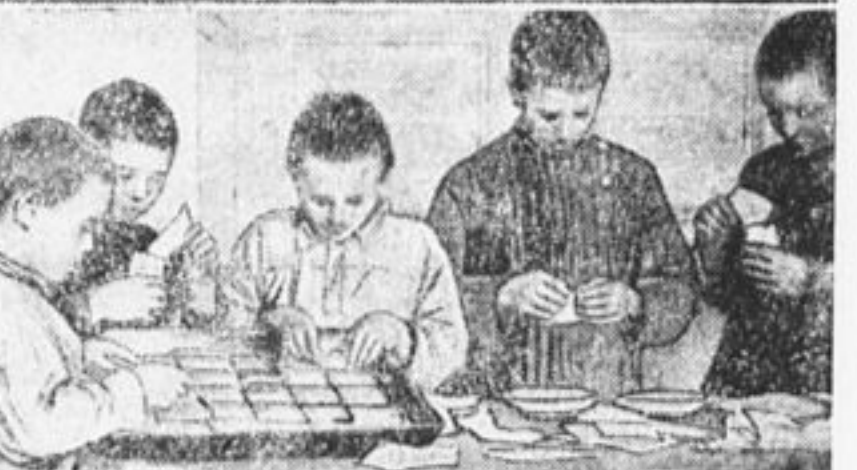
Члены комиссии замачивают семена для проращивания