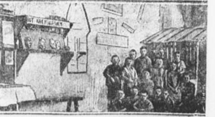
Комиссия по поднятию урожая кленовской школы.