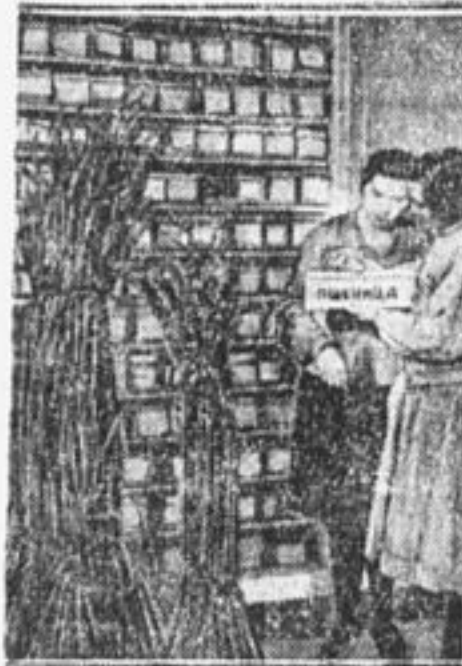
Новые сорта пшеницы. Колосья пшеницы «Новинки» и ее зерноархив (в ящиках). Детскосельская станция.

Им на помощь идут шекомята. Они помогают организовывать коллективы. Теперь школа занята созданием коллектива в селе Ново-Никольском. Вообще ребята тесно связаны с коллективами, учатся друг у друга. Школа протравит зерно четырех колхозов.