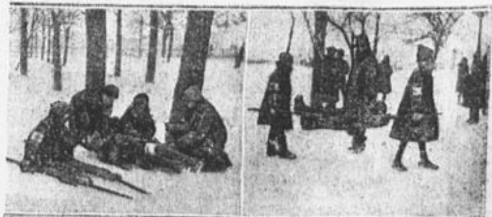
Санитары 31 школы гор. Ленинграда на маневрах.

Сборы звена первое время также проводились беспорядочно. Соберутся ребята в клуб, два человека заседают за писание плакатов, два еще за что-нибудь, а остальные мешают этим четверым.