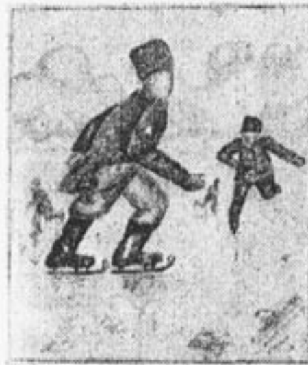
Деткира П. Малюка.