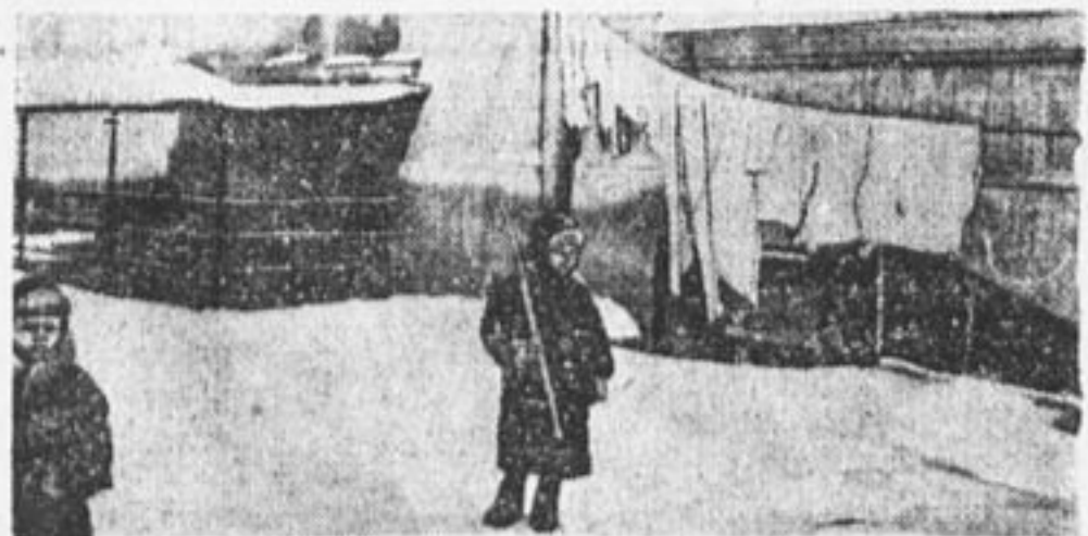
Шестилетний мальчик охраняет белье, когда мать ушла на переборы советов.