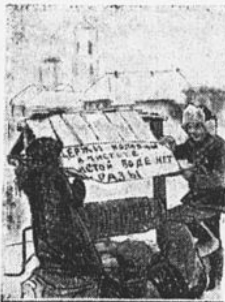
Заботы о чистке колодца (деревня Н. Шуструй, Пензенск. г.).

рот пионерам «задания», теперь делать этого не будет. Каждый пионер должен сам присматриваться к жизни, которая идет около отряда, и сам выбирать работу, обсудив ее на звене.