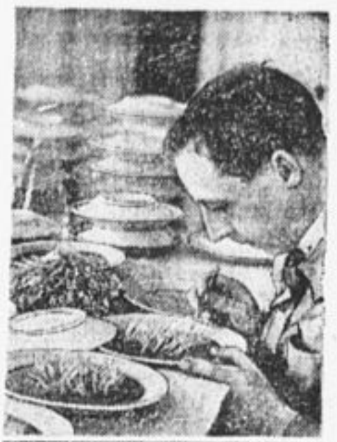
Подсчет «искусственного» урожая на контрольной семенной станции в Москве.

По намеченному маршруту зерноочистительный обоз дол-