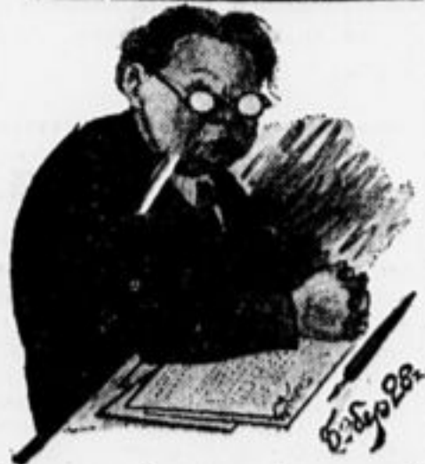
Писатель Гладков (дружеский шарж)