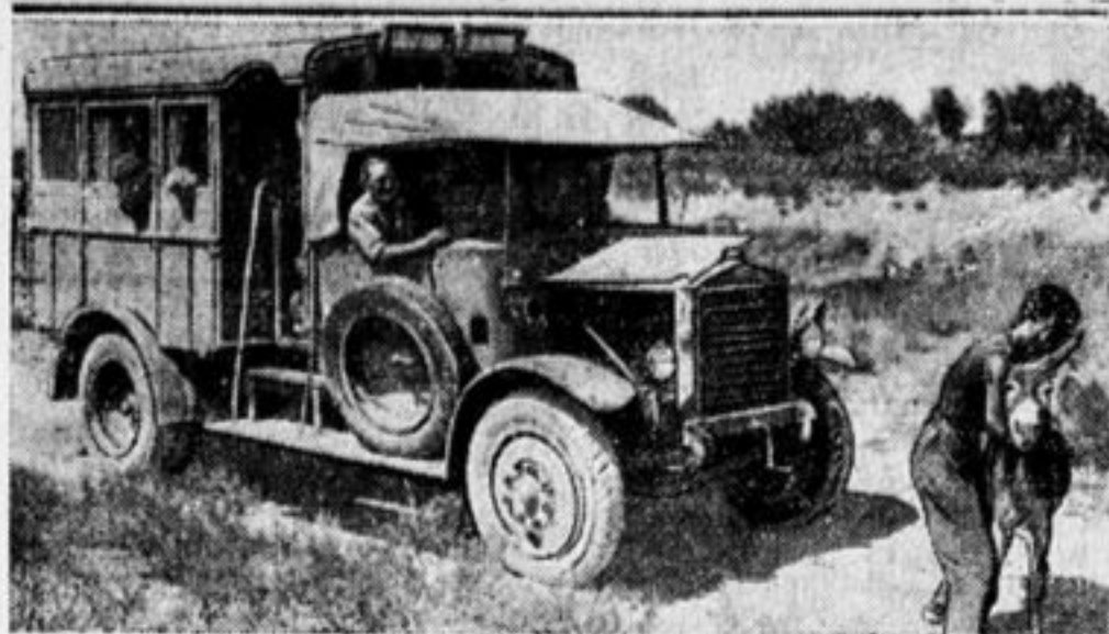
Неожиданное препятствие. В глухом уголке Таджикистана. Осел не хочет уступить дорогу сопернику-автобусу.