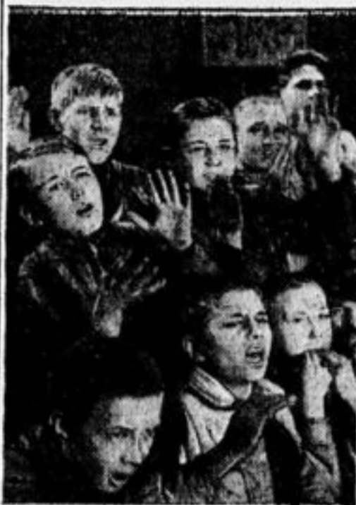
Из кинокартины «Оторванные рукава».