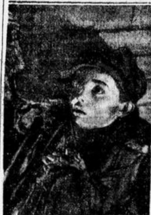
Читай в следующем номере о просмотре кинокартины «Отверженные рукава».