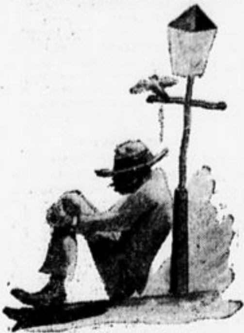
Писатель Никифоров (дружеский шарж).