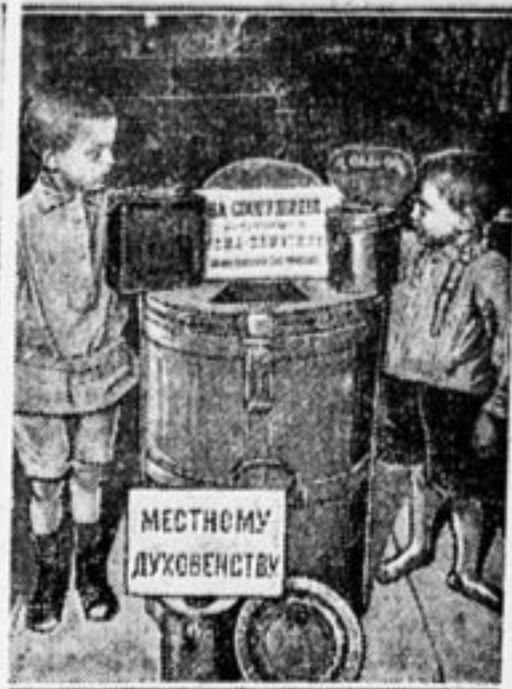
ПУСТЯКИ-КРУЖКА. Кружка для сбора пожертвований у мощей Сергия в Сергиевском монастыре.

При чем тут закон и какой именно закон, никто не понял,