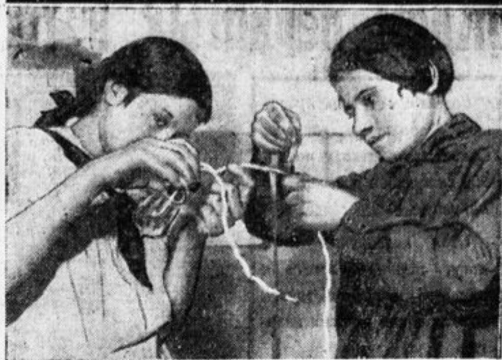
Трудовому воспитанию уделяется в отрядах много внимания. Ребята не встанут втупик, если в клубе испортится электричество. На снимке пионерки 48 отряда изучают лампочку.