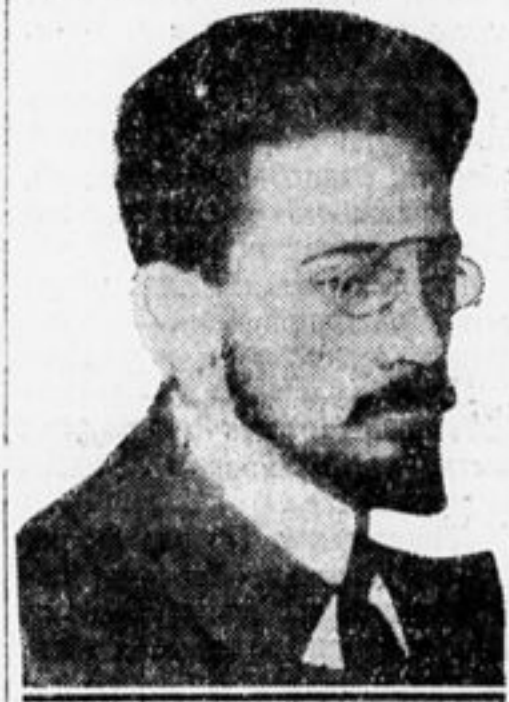
Я. М. СВЕРДЛОВ.

Пробравшись подалее в угол, низенький человек с лысой головой утонул лицом среди окружающих. Светлые и острые глаза Свердлова заметили его. Гладкие, как гальки, слова свои Свердлов протолкнул поскорее, как камешки в воду, в сотни ушей и остановился в говорении. Легким и как всегда определенным жестом указал он на вешедшего человека с веселым лицом и умными огненными глазами.