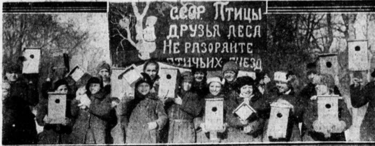
«День птиц» в Сокольниках.

Стаи перелетных птиц могут спокойно лететь к нам. Для пернатых друзей готовы сотни уютных квартир.