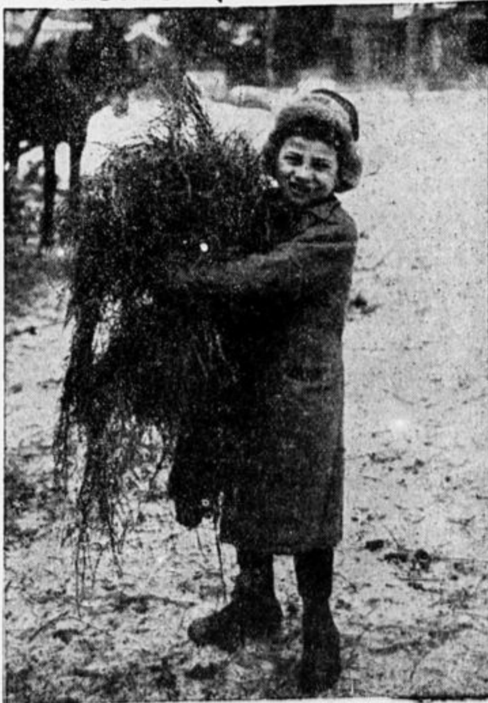
ДОСТАЛ ДЛЯ ЛОШАДИ ОХАПКУ СЕНА.

красневшиеся, веселые и довольные, мы ворочались обратно. На другой день в печке приятно потрескивала сосна, и мы могли заниматься.