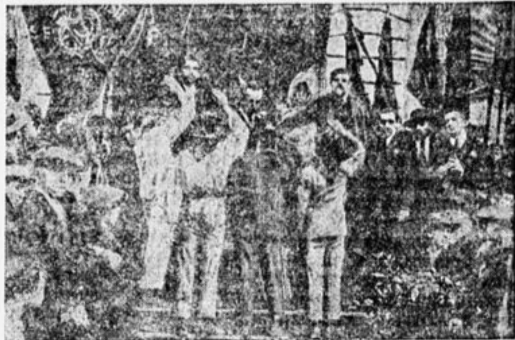
ПИОНЕРЫ СЕН-ДЕНИ ДАЮТ ТОРЖЕСТВЕННОЕ ОБЕЩАНИЕ

В декабре был созван всефранцузский съезд пионеров, с участием представителя КИМ'а. Этот съезд обсуждал следующие вопросы: 1) политическое положение и задачи деткомдвижения; 2) связь пионеров с партией и комсомолом; 3) доклад о