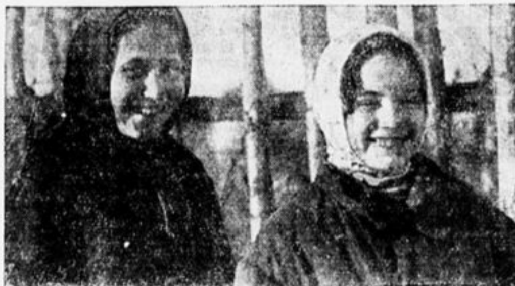
«БУДЕМ КОМС ОМОЛКАМИ!»