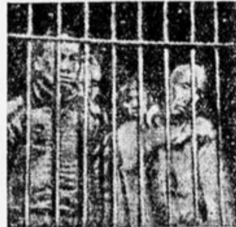
В ЗАСТЕНКАХ У ЧЖАН-ЦЗО-ЛИНА.

Видали вы, ребята, как иногда несколько собак дерутся из-за кости. Такими