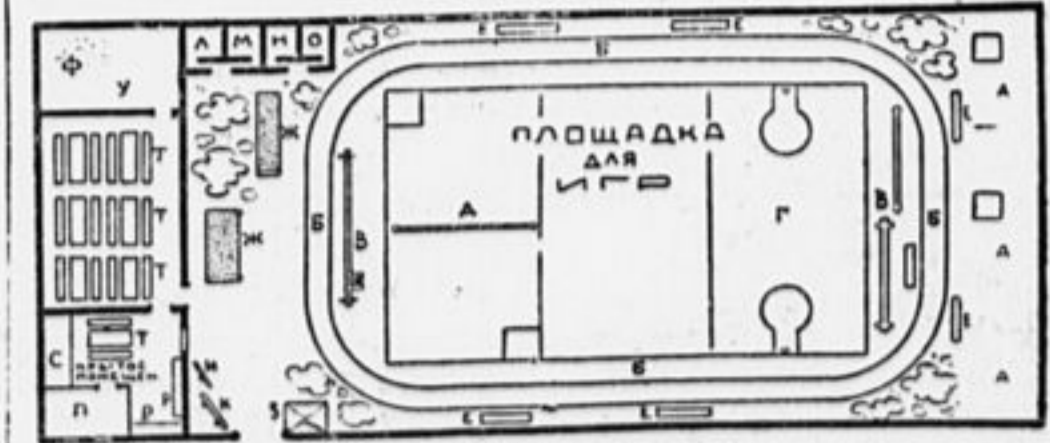
ПЛАН ЛЕТНЕЙ ПЛОЩАДКИ.

Площадка должна быть достаточно просторной (по 10 квадр. аршин на пионера), солнечной, защищенной от пыли, желательно с зеленью. Ее нужно обязательно огородить. Для хранения инвентаря и для укрытия от непогоды поблизости должно быть крытое помещение (например, клуб). На площадке должны быть