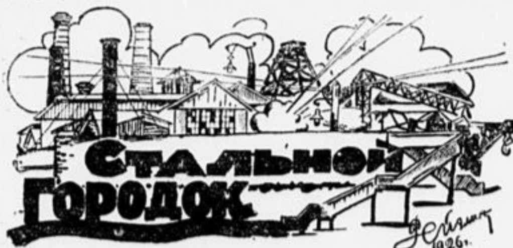
(Большой московский металлургический завод «Серп и Молот», б. Гужона).

«Он понес его к Гужону, К душным, мрачным мастерским. Печи яркие горели, Страшный жар стоял от них. Здесь среди мрака и шиленья Из огромного котла В приготовленные формы Лава яркая текла».