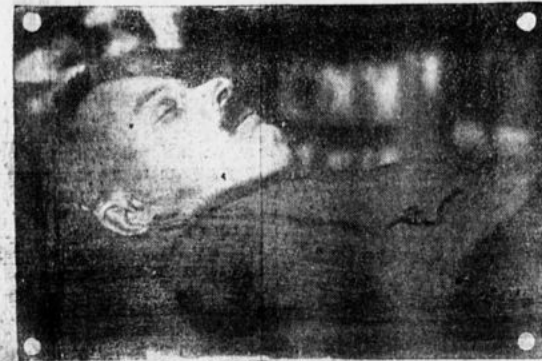
Тов. ФРУНЗЕ в гробу.

пионер» с нами в лагере. Но его обязанности не дали ему возможности пробыть подольше с нами. Он вернулся к своим командирам и красноармейцам на маневры.