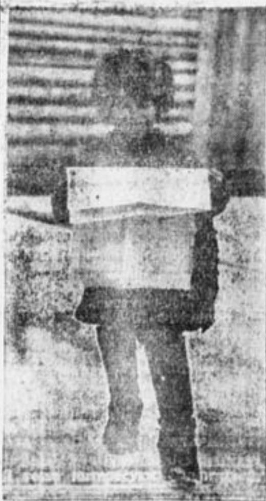
Я тоже интересуюсь политикой.

Надо крепкую нам смычку, С нашим городом держать, Чтобы ленинца мы иличку Смогли всюду оправдать.