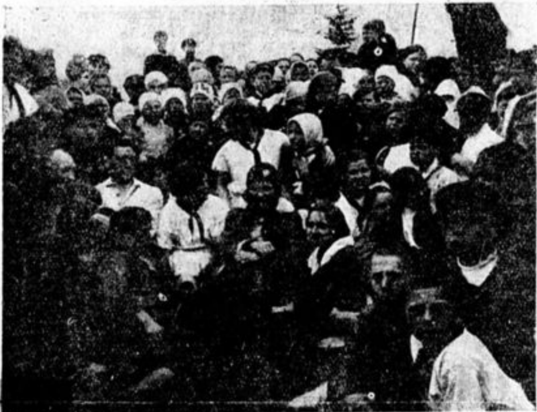
Новое и старое в деревне.