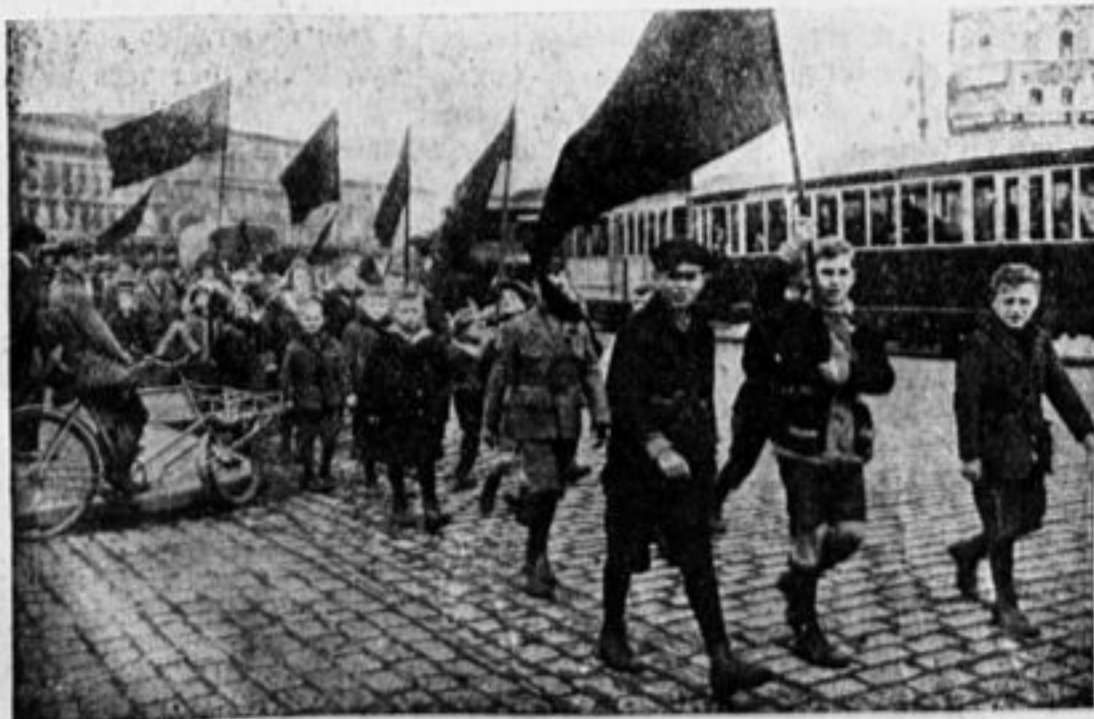
Детком группы на улицах Берлина 1 мая.