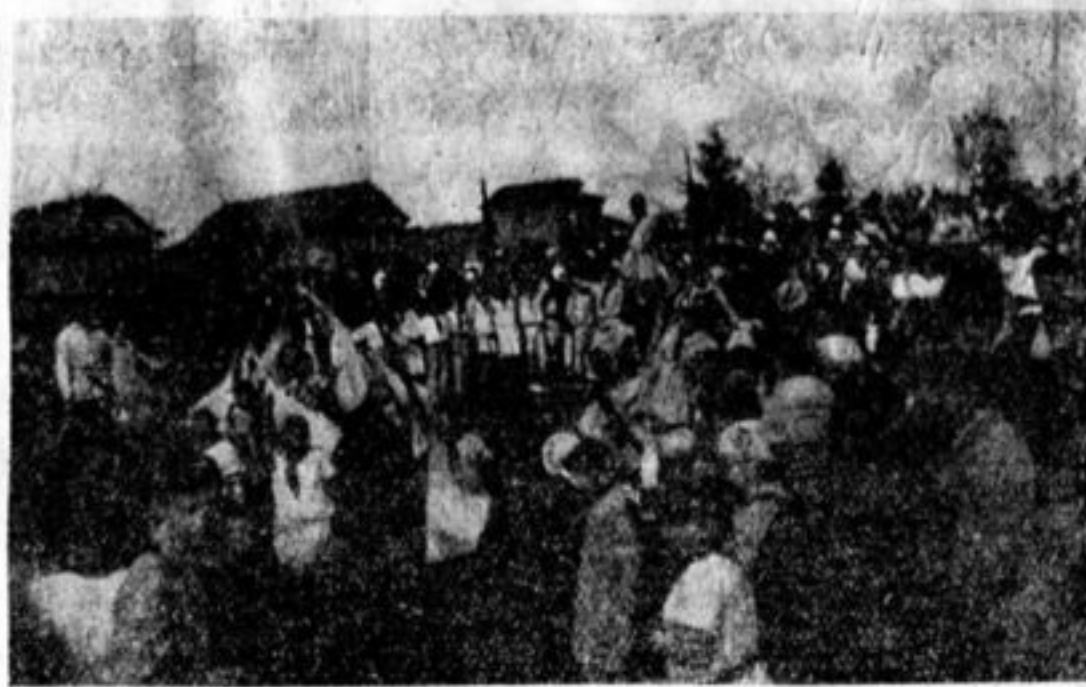
Московские пионеры на смывке в деревне Чапчиново.