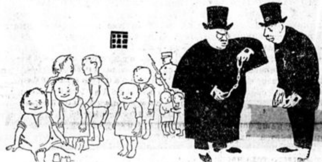
Чехо-словацкий суд приговорил к каторге 28 спартаковских скаутов. (Из „Правды“).

У селения Слободзея, по Днестру на лодке ехали вдоль советского берега комсомолец и двое крестьян. Румынская стража потребовала, чтобы они причалили к их берегу. В ответ на отказ румыны открыли стрельбу. Комсомолец убит. Крестьяне ранены.