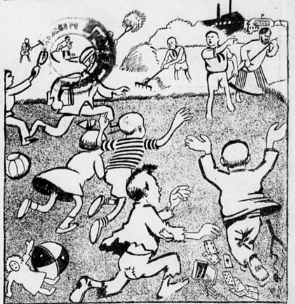
ВМЕСТЕ СО ВСЕМИ НЕОРГАНИЗОВАННЫМИ РЕБЯТАМИ