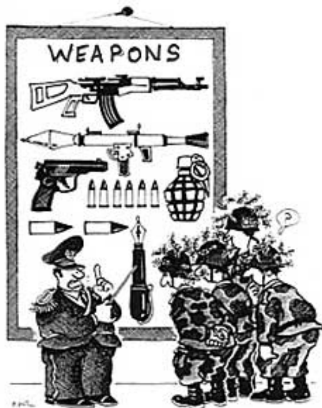
Рисунок © Plantu

В 2002 г. правительство Руанды создало верховный совет по делам печати (ВСП), который будет заниматься вопросами регламентирования деятельности СМИ. Однако, как отмечает Ндикумана, это консультативный орган, не обладающий большими полномочиями. Он может консультировать министра информации, который предоставляет лицензии новым СМИ и правомочен налагать санкции. Новый закон, предусматривающий передачу этих полномочий принятия решений ВСП, находится в настоящее время на рассмотрении парламента. Деятельность журналистов начинает приобретать более организованный характер, свидетельством чего является создание пресс-центра и наби-