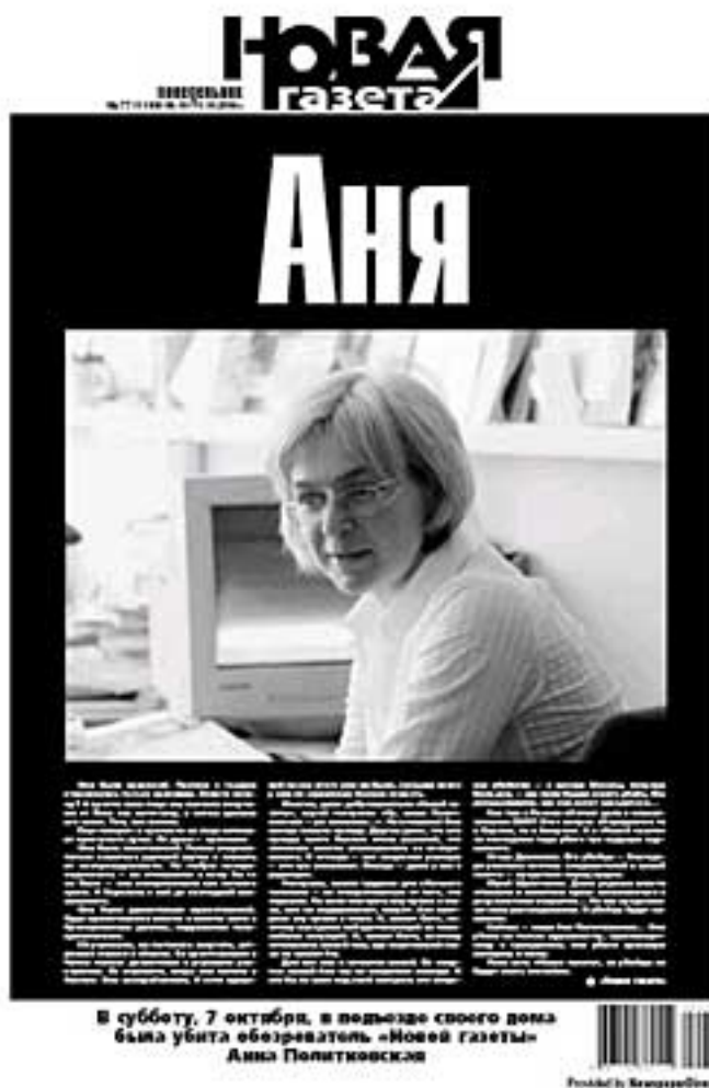
Специальный выпуск «Новой газеты», посвященный Анне Политковской