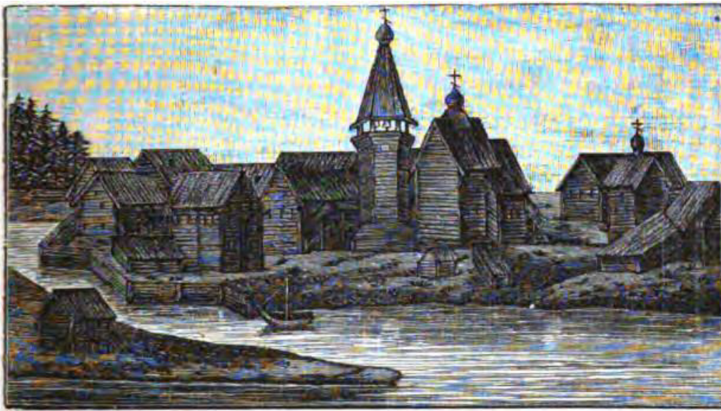
Старообрядческая Лексинская пустынь въ XVIII столѣтіи.