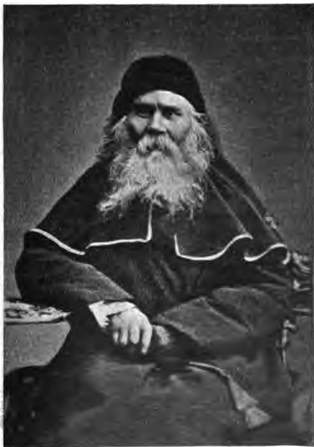
Кононъ, епископъ Новозыбковскій.