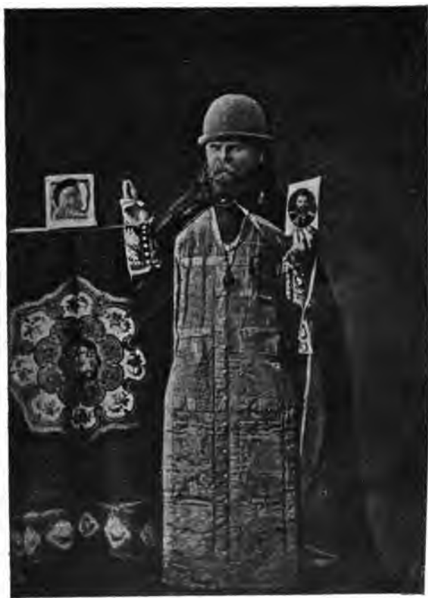
Епископъ Геннадій, освобожденный императоромъ Александромъ III.