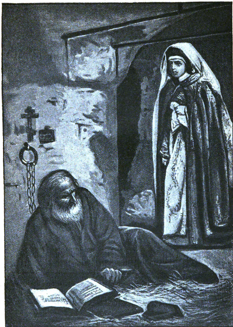
Боярыня Морозова посѣщаетъ въ заключеніи Аввакума.