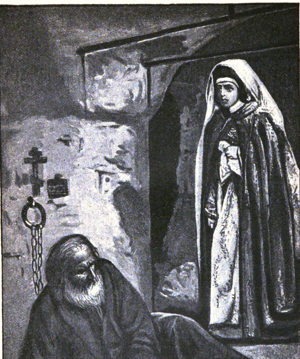
Великий подвижник, протопоп Аввакум Сергей Петрович Мельгунов