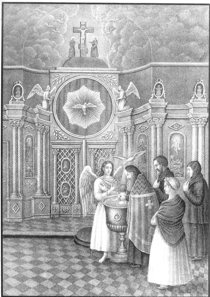
Совершение таинства Св. Крещения по обряду Православной Восточной Церкви.