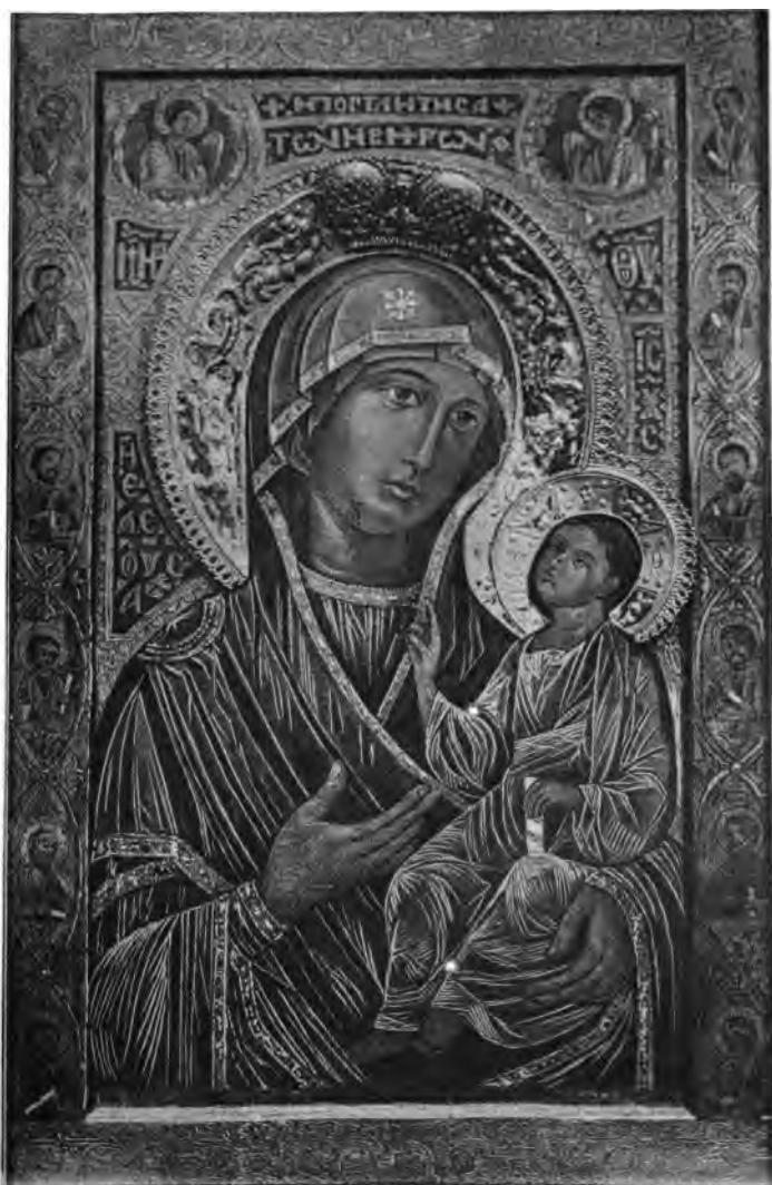
Фото-гравюра ЛЕВИТСКАГО Арбатъ. Дозволено духовною Цензурою Москва 1886 г.