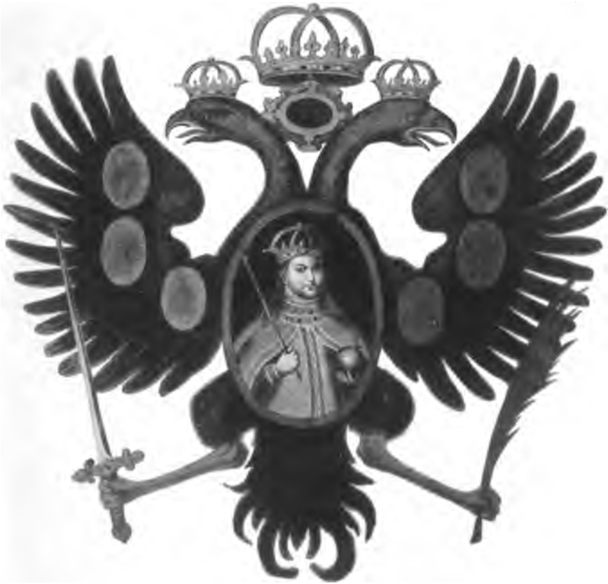
Фото-гравиора Л. Витковскаго. Арт. атл. Импер. Царского Музея. Москва 1884 г. в. а.