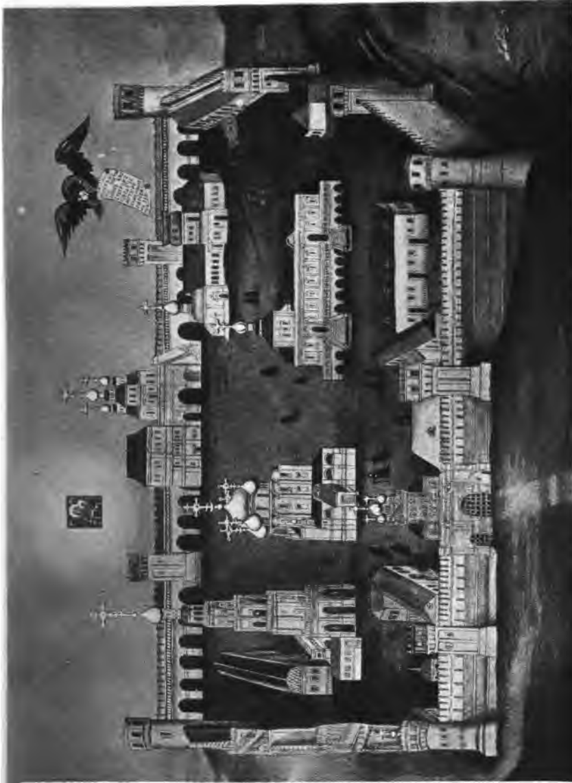
ВИДЪ МОСКОВСКАГО НОВОДЬВИЧЬЯГО МОНАСТЫРЯ ВЪ КОНЦѢ 18 ВѢКА.

Рисованъ архитекторомъ А. С. Шубинымъ въ Москвѣ 1834 г.