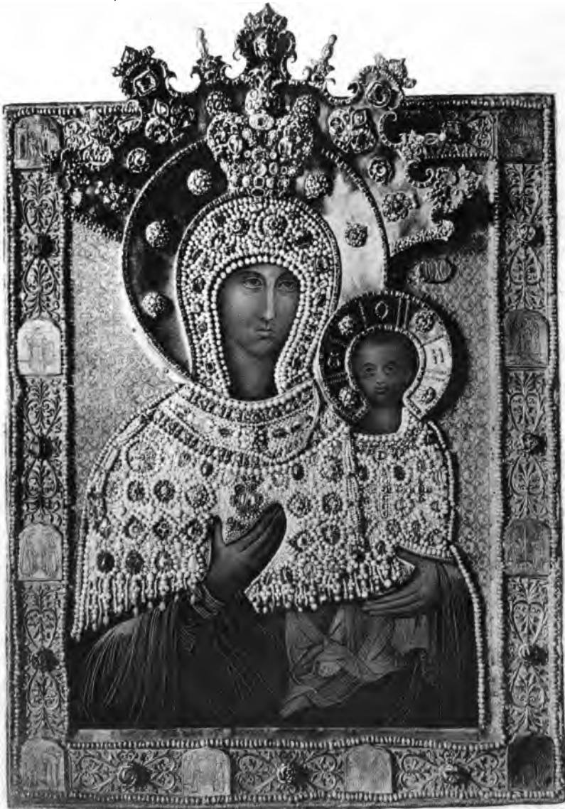
Фото-гравюра Левитскаго, Арбатъ. Дозволено Цензурою, Москва, 1886 года.