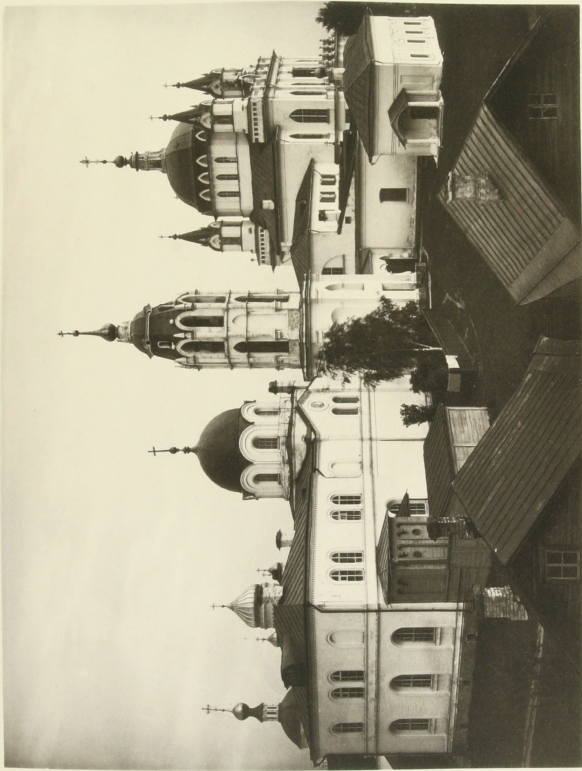
1881 г. Ч. III, ОТД. I, № 2.

Външній вигляд Монастиря Зачатьевскаго въ Звенигородѣ.