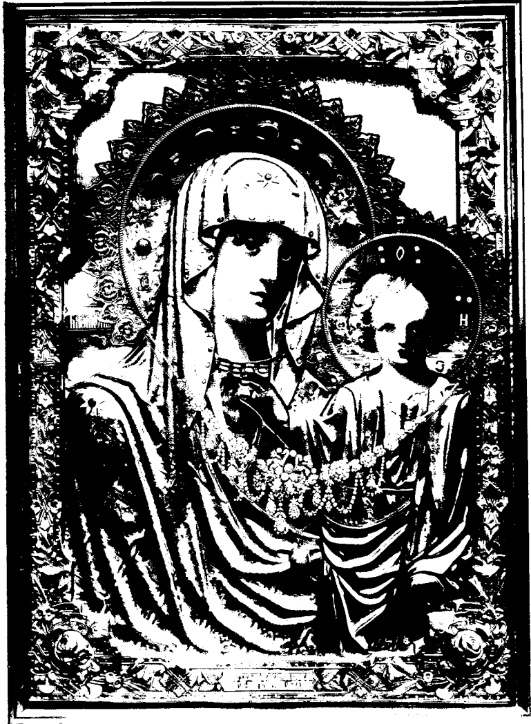
Фототипия Шверера Настольная икона въ Москвѣ.

Изображеніе Казанской храмовой иконы Божіей Матери, находящейся въ Казанскомъ Голо- винскомъ женскомъ монастырѣ Московскаго оубзда.